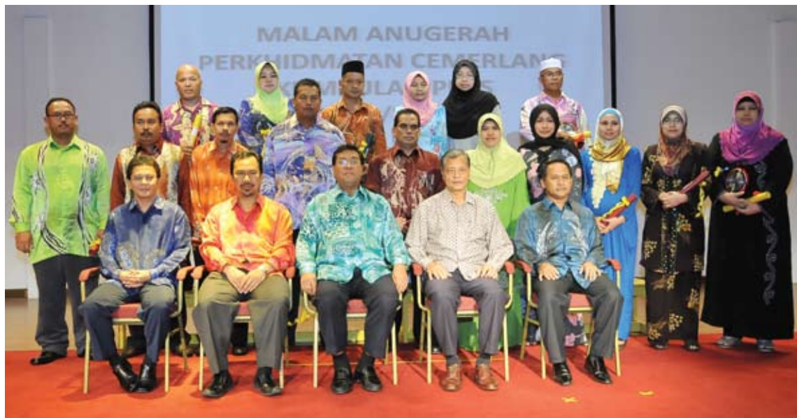
Menteri Besar bersama penerima Anugerah Perkhidmatan Cemerlang dan Jasamu Dikenang PKPS 2011/2012

Pihak PKPS turut menjalankan projek ternakan lembu tenusu yang menghasilkan 1,000 liter sehari selain mensasarkan penghasilan lebih 3,000 liter sehari dalam tempoh dua tahun akan datang.