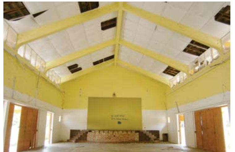
Keadaan dalam dewan yang kelihatan uzur

Menurut Jaafar, apabila terbiar ia menjadi tempat remaja