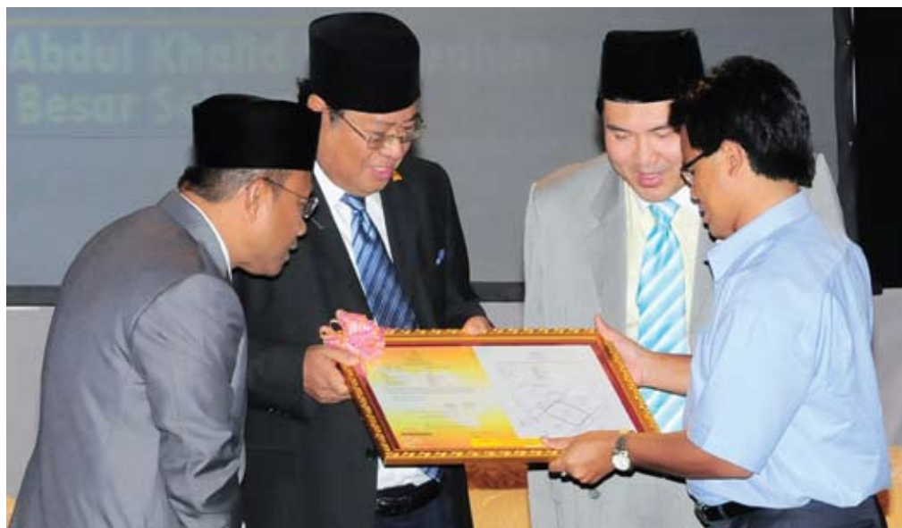
Menteri Besar menyerahkan pelan tanah yang diwakafkan kerajaan negeri kepada wakil penduduk