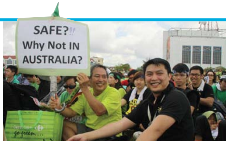
BERSUARA... pelbagai lapisan rakyat 'turun' nyatakan bantahan

"Ramai keluarga di kampung-kampung yang bergan-