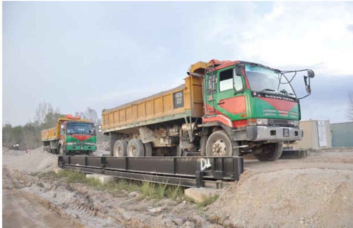
Kerajaan negeri bersikap terbuka dalam menangani masalah isu curi pasir yang didakwa berlaku di Rawang, Kuala Langat dan Semenyih

Ini berlaku walaupun kampung tersebut terletak di dalam sempadan Kuala Kubu Baru.