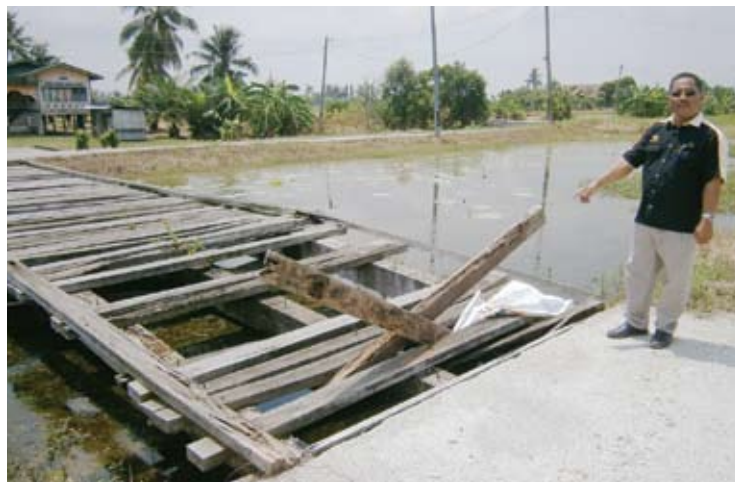
Latif menunjukkan jambatan usang yang menimbulkan masalah kepada penduduk

PENDUDUK Kampung Parit 10 dan 12 meminta kerajaan negeri menyergerakan pembinaan jambatan konkrit di hadapan Masjid Parit 10 di sini bagi memberi kemudahan orang ramai keluar dan masuk ke masjid itu.