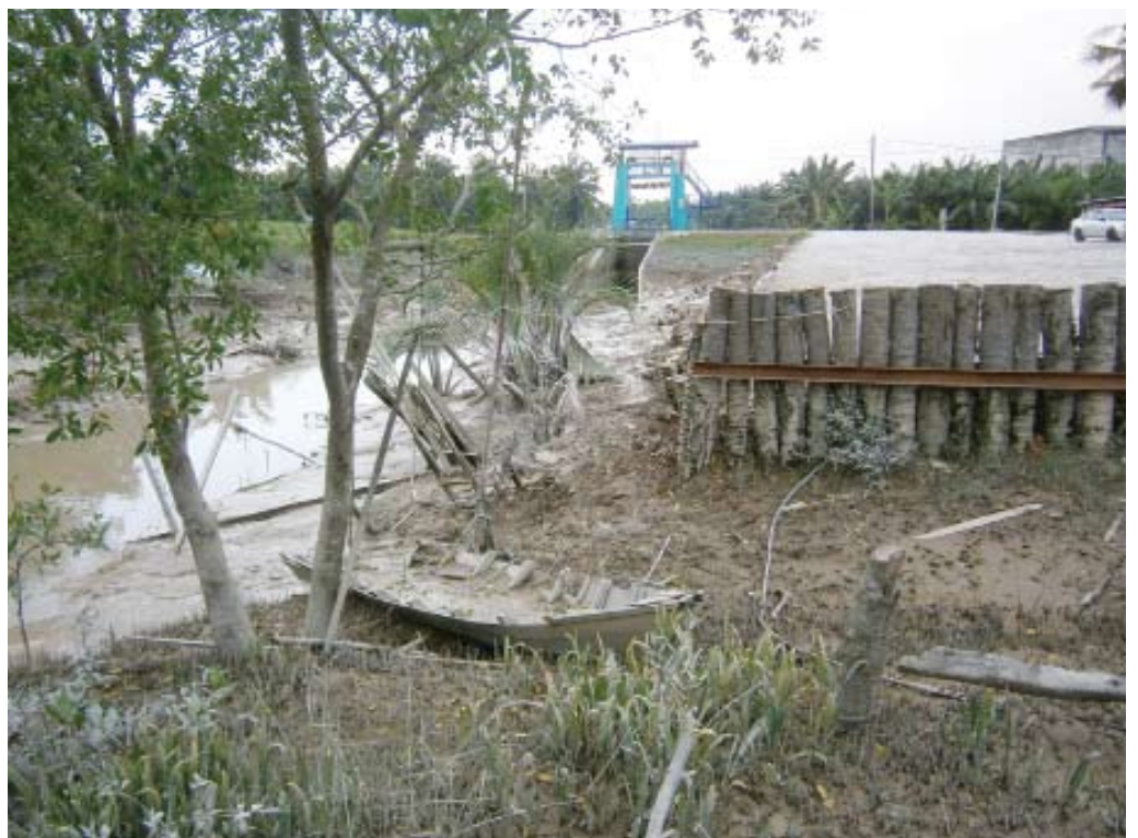
SAMBIL LEWA... penggunaan batang kelapa sebagai penahan dianggap sebagai tindakan tidak serius pihak terbabit tangani masalah rakyat

“Sepatutnya projek kecil seperti ini boleh diberikan kepada anak-anak tempatan kampung ini yang memiliki lesen kontraktor kelas F,” ujarnya lagi.