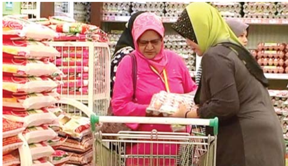
Peserta 'Jom Shopping' sedang memilih barangan yang ingin dibeli

“Namun masih terdapat sebilangan kecil masyarakat yang terkongkong dalam fahaman politik sempit,