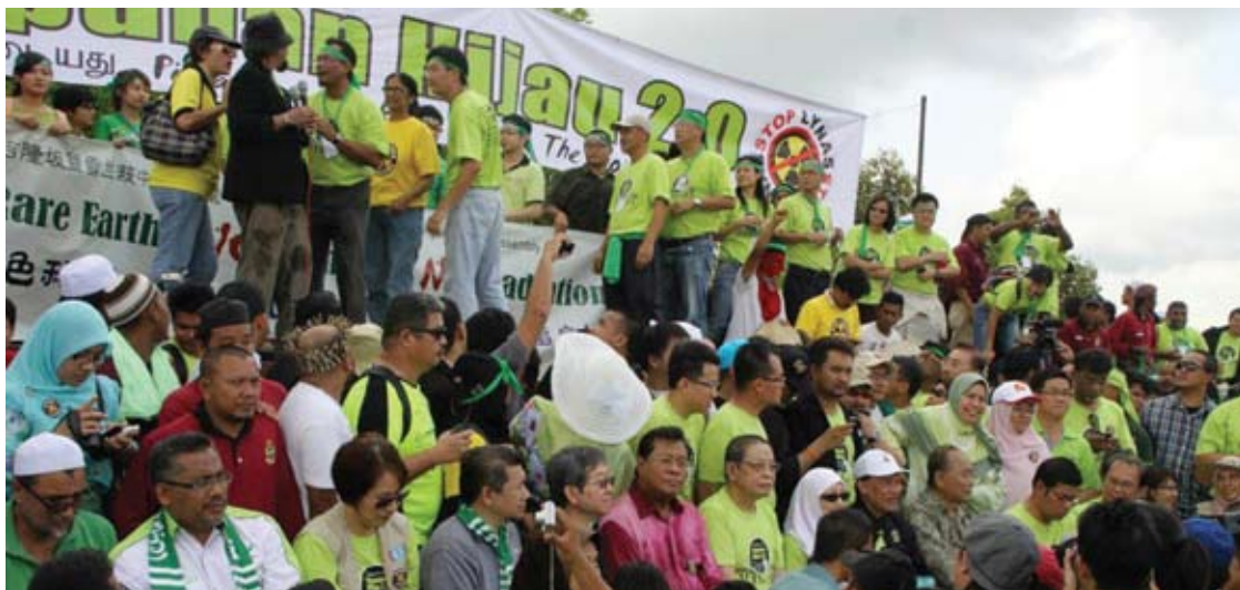
Sebagian daripada pimpinan Pakatan Rakyat turut hadir tanda sokongan pada Himpunan Hijau 2.0

Esok, perhimpunan besar-besaran membantah projek Lynas akan diadakan di Padang MPK 4, Kuantan, selain empat lagi lokasi berbeza seluruh tanah air.