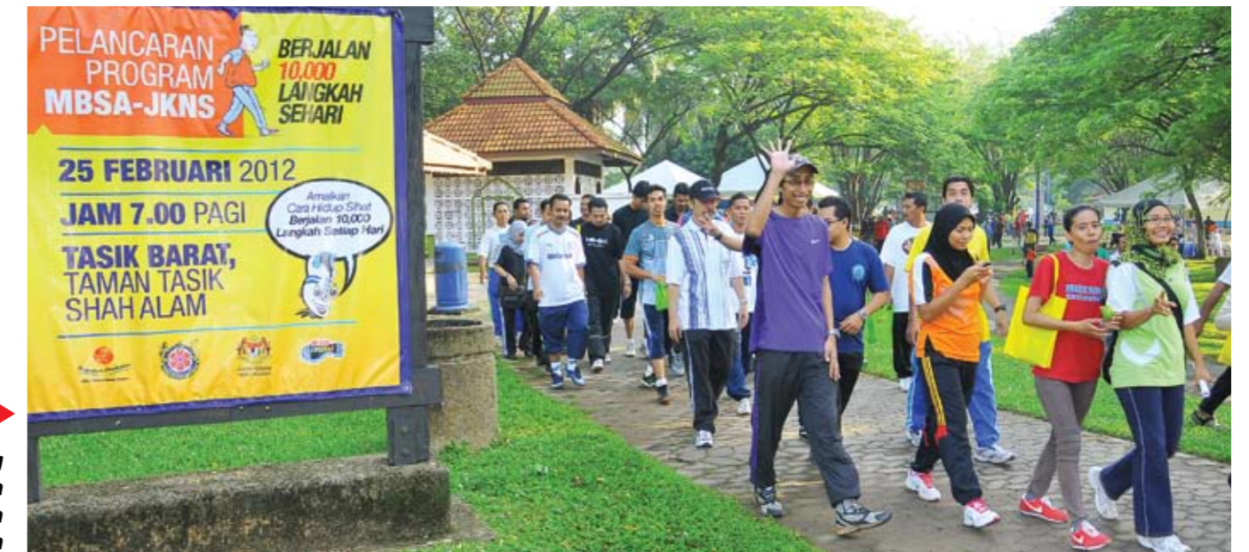
▲ AKTIVITI SIHAT... Orang ramai yang hadir pada Pelancaran Program MBSA-JKNS 'Berjalan 10,000 Langkah Sehari' di Taman Tasik Shah Alam