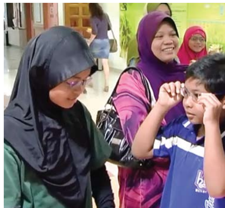
TERUJA... penerima 'bergaya' dengan cermin mata yang diterima

“Jadi kita harap pemberian cermin mata ini akan dihargai