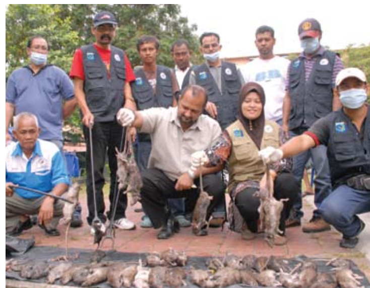
MEMBIAK... kehadiran tikus yang banyak, dikhawatiri menjadi punca kepada wabak penyakit

"Saya harap program sebegini tidak berakhir setakat ini, tetapi wajar diteruskan pada masa hadapan," kata beliau.