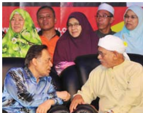
Anwar dan Haji Hadi Awang hadir memeriahkan majlis

cepat oleh PR, ujar Abdul Khalid menjadikan Selangor jauh lebih baik sebelumnya. Hasil itu juga katanya, hampir RM600 juta hasil pendapatan negeri diagihkan kepada rakyat.