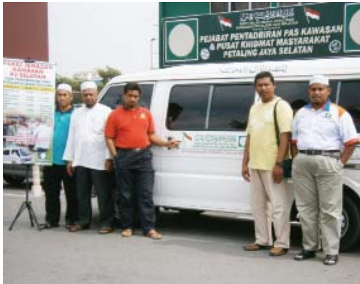
AMAL JARIAH... Perkhidmatan van jenazah turut disediakan