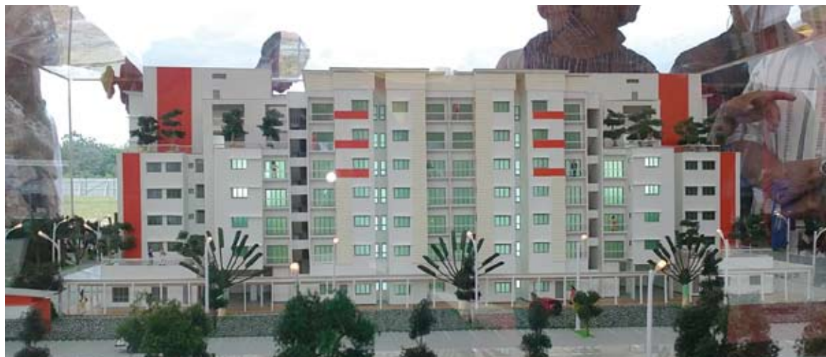
Rumah mampu milik memberi peluang kepada golongan berpendapatan sederhana memiliki kediaman sendiri