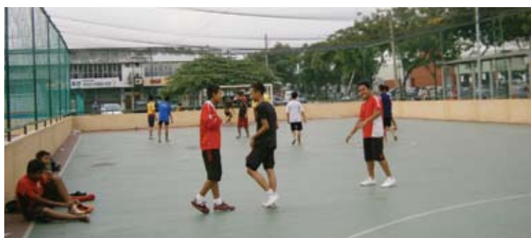
Gelanggang futsal antara yang terdapat di Dataran Anak Muda

“Alhamdulillah dengan usaha dan ilham YB Haniza, kita dapat laksanakan program HWR, iaitu tempat pelajar sekolah boleh berkumpul di luar waktu persekolahan untuk buat kerja