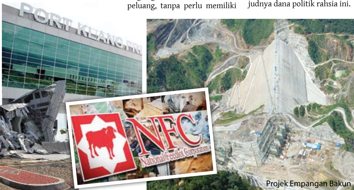
Projek Empangan Bakun

Maka itu adalah amat penting bagi sebuah kerajaan baru untuk mengenakan peraturan yang ketat dan menguatkuasakan pembiayaan politik, sekalipun ini akan menjejaskan politiknya sendiri.