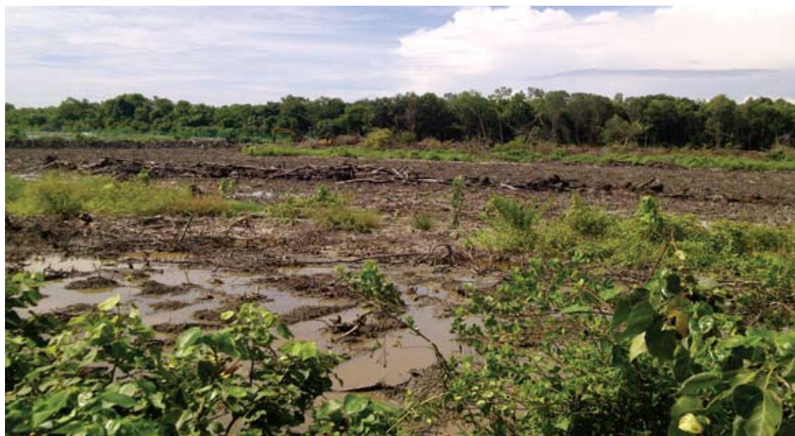
Masalah kecurian kayu bakau yang berleluasa berjaya ditangani JPS secara proaktif

"Tindakan pemasangan tanda ini adalah sebagai salah satu kaedah untuk memaklumkan kepada masyarakat tentang kewujudan hutan simpan," ujar beliau.