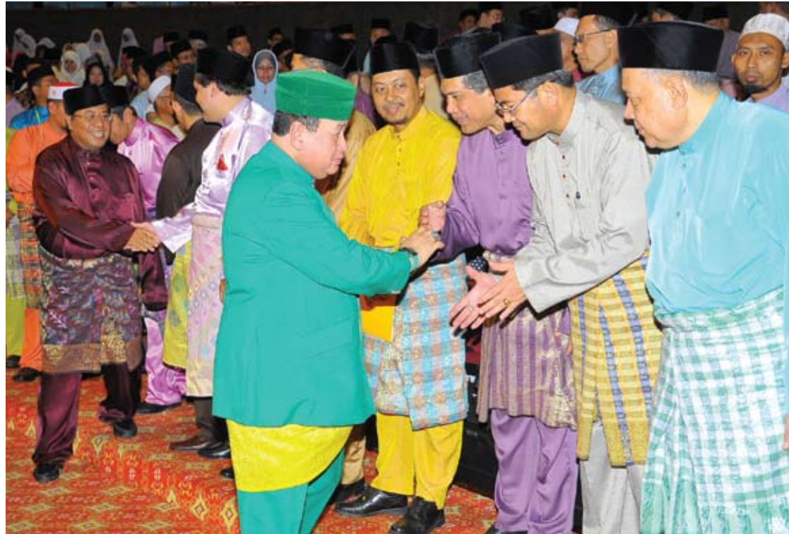
YAM Tengku Sulaiman Shah bersalaman dengan tetamu jemputan di Pertandingan Hafazan Peringkat Negeri Selangor 2012