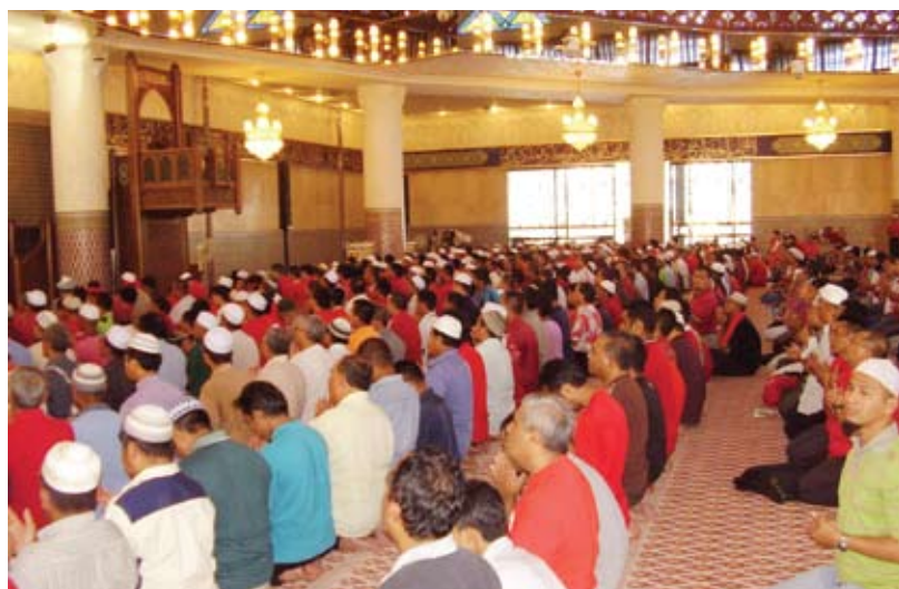
UKHUWAH... masjid bukan sekadar tempat ibadat semata-mata

“Kita tidak hanya tertumpu pada penyampaian ceramah semata-mata tetapi menyeluruh ke pelbagai program dan aktiviti yang lebih efektif,” jelasnya lagi.