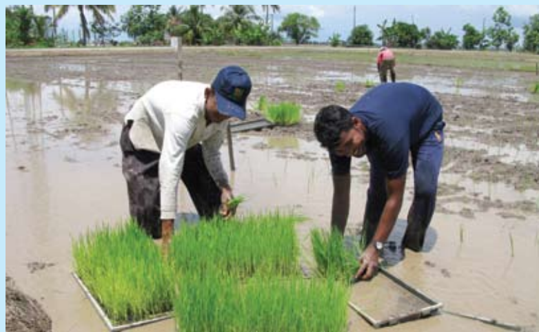
Nasib petani akan terus dapat pembelaan kerajaan negeri

"Kerajaan negeri meluluskan peruntukan sebanyak RM3,013,302 pada tahun 2009, RM4,930,000 pada tahun 2010, RM3,050,000 pada ta-