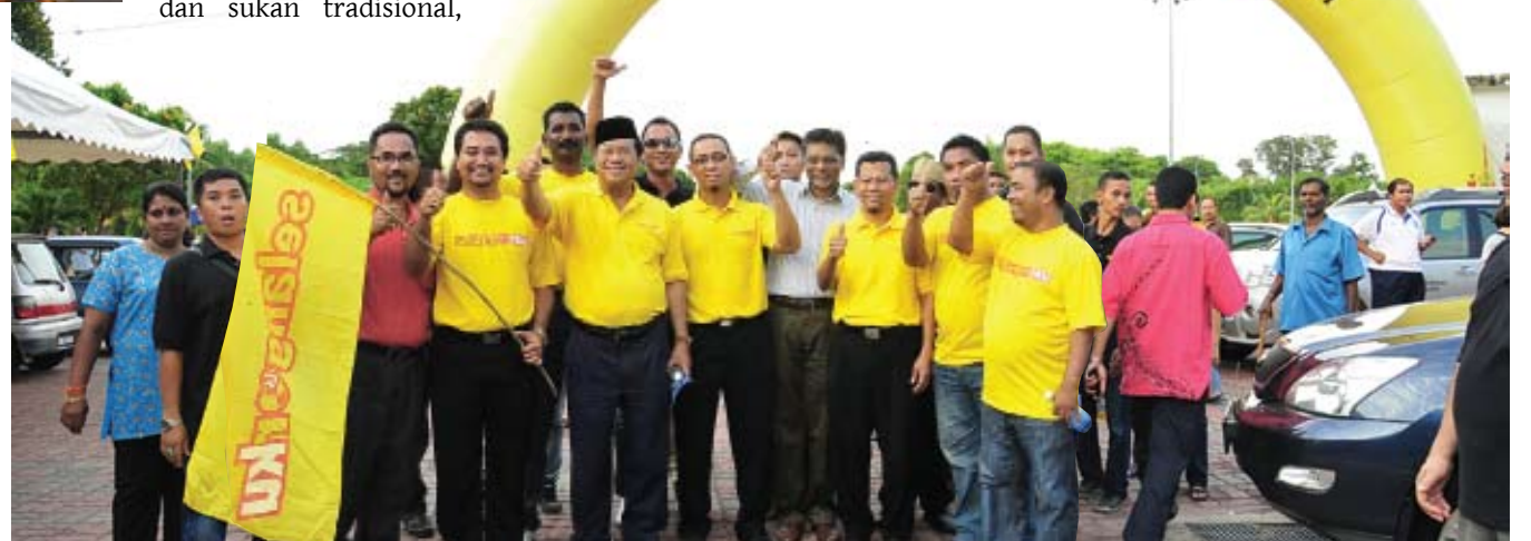
MAJU... Menteri Besar bersama pimpinan Pakatan Rakyat akan teruskan tingkatkan ekonomi Selangor