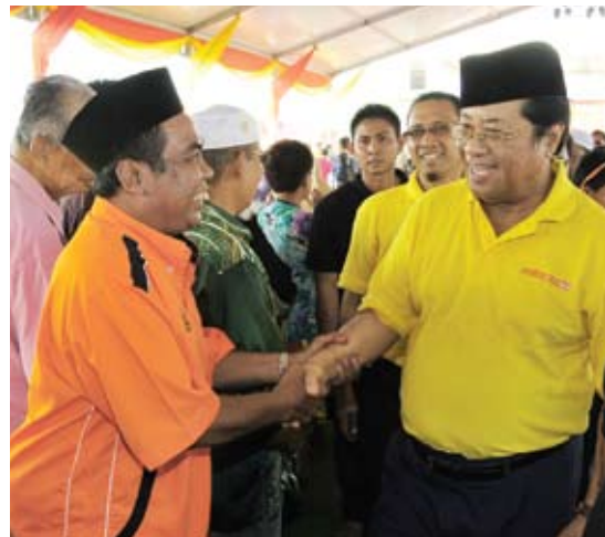
Menteri Besar disambut meriah oleh orang ramai

"Apa cerita? Negara kamu jaga pun banyak rasuah dan ambil projek," katanya.