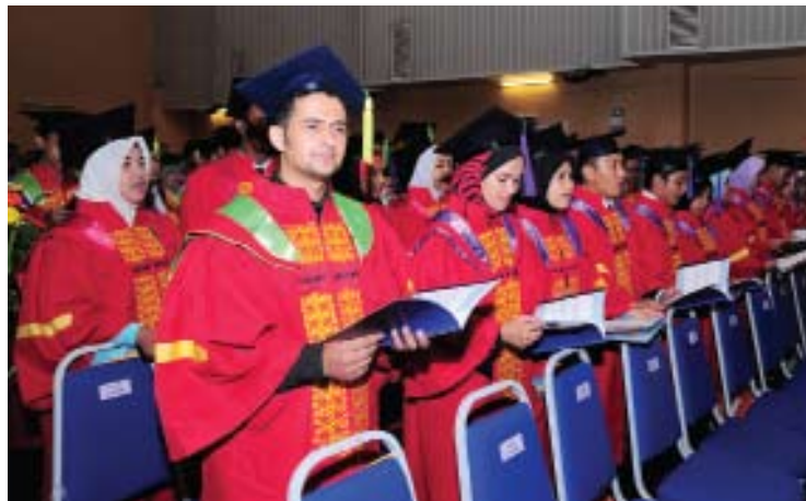
BERSEMANGAT... para graduan menyanyikan lagu rasmi Unisel pada majlis Konvokesyen Unisel Kali Ke-6