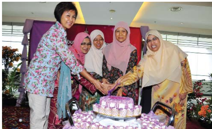
MUFAKAT... isteri Menteri Besar, mengetuai acara memotong kek Sambutan Ke-100 Tahun Hari Wanita Antarabangsa