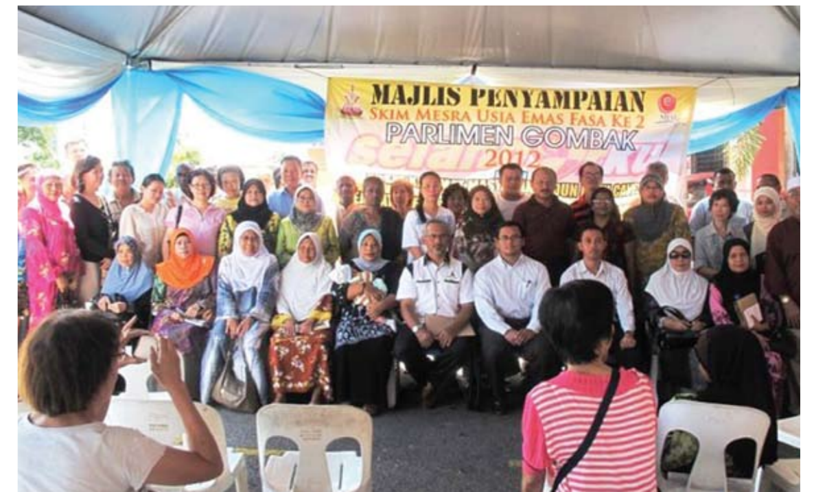
Sebahagian daripada 101 penerima SMUE Fasa 2 di DUN Batu Caves bergambar bersama Amiruddin Shari selepas tamat majlis penyerahan skim tersebut