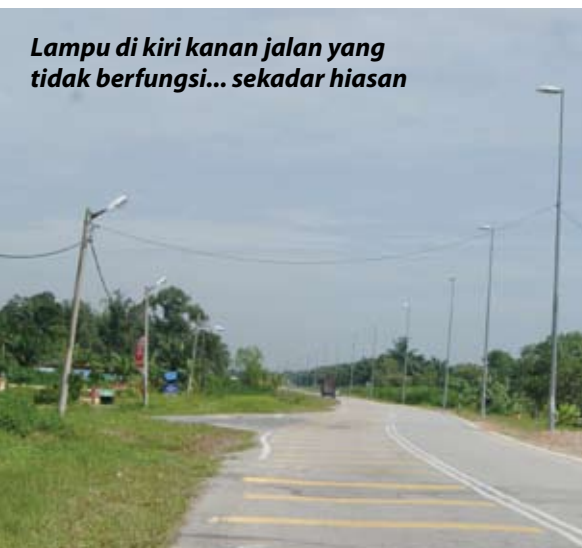
Lampu di kiri kanan jalan yang tidak berfungsi... sekadar hiasan

Katanya, beliau sendiri akan ke Majlis Daerah Kuala Langat (MDKL) bagi menyelesaikan masalah ini.