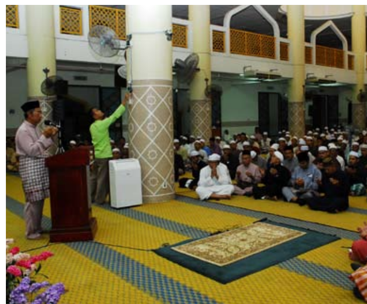
Permasalahan umah turut dibincangkan melalui majlis forum Perdana Ehwat Islam

Projek Pangsapuri Banjarja Court dibina pada 2007 dan mula dijual pada 2009 serta memperolehi Sijil Layak Menduduki (CF) pada 4 Januari 2012. Bagaimanapun proses penyerahan kunci dilakukan secara berperingkat bermula 23 Januari lalu.