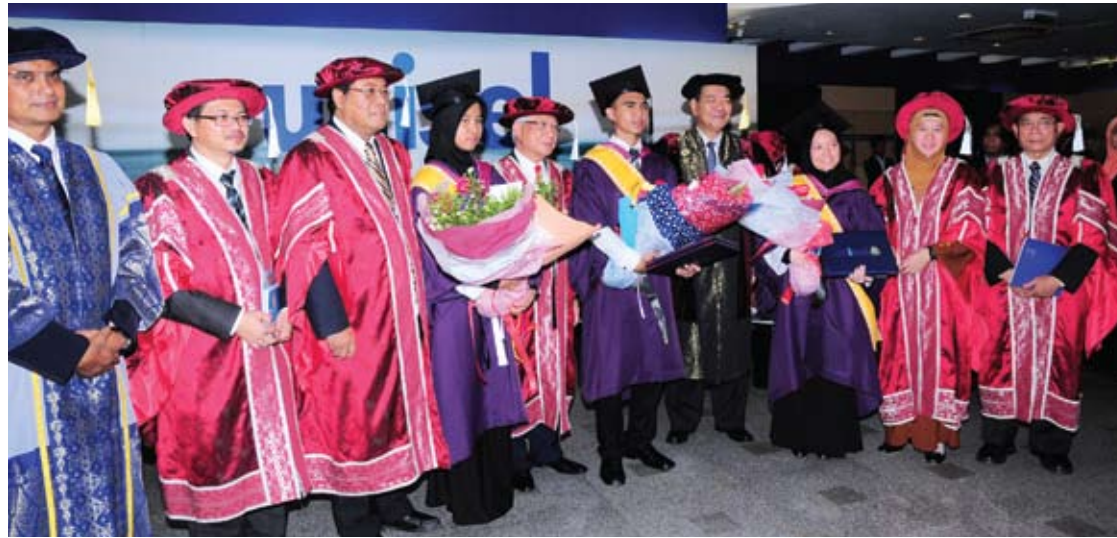
Menteri Besar bergambar bersama penerima Anugerah Graduan Terbaik Japanese Associate Degree Programme

taannya boleh dipertikaikan, malah menjadi bahan lucu bagi orang yang arif dalam bidang berkenaan," katanya.