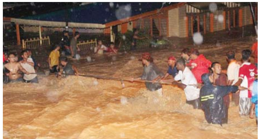
KERJASAMA... orang ramai bersatu tenaga membantu mangsa banjir di Kampung Lembah Jaya Utara

"Saya kira 90 peratus barang-barang mangsa banjir itu musnah sebab kawasan ini bukan berlaku banjir tetapi dilanda