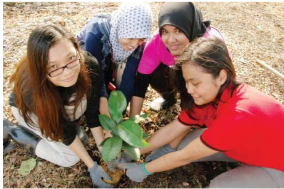
CINTAI ALAM... sukarelawan ini sedang menanam pokok pada Program 'Shah Alam Trees For Life 2012' yang diadakan di persisiran Sungai Reggam, Shah Alam. Program yang melibatkan 500 penyertaan sukarelawan itu bertujuan untuk menjadikan Shah Alam sebagai bandaraya hijau dan bandaraya dalam taman. Sebanyak 2,500 pokok ditanam, terutamanya pokok buah-buahan seperti jambu air, kundang, rambutan ditanam di persisiran sungai