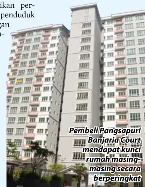
Pembeli Pangsapuri Banjarja Court mendapat kunci rumah masing-masing secara berperingkat