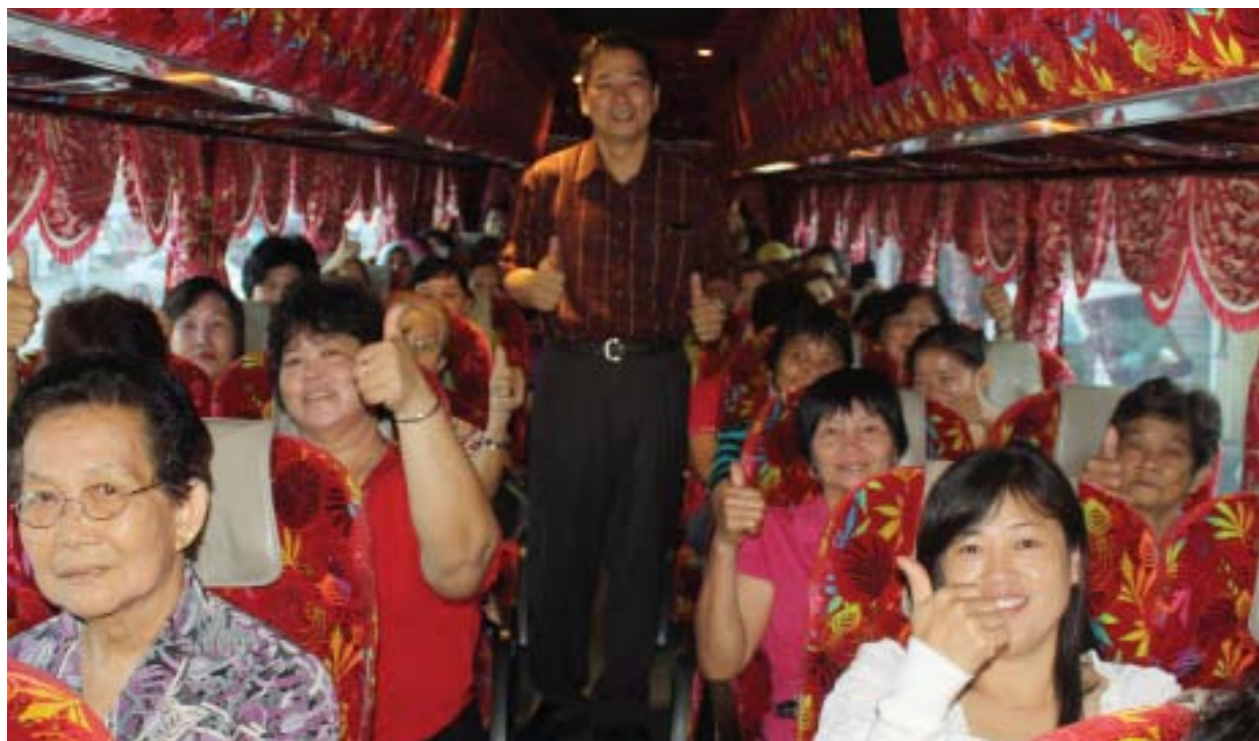
Seramai 44 orang peserta mengikuti program Mammogram anjuran Pusat Khidmat Masyarakat DUN Sekinchan. Peserta dibawa menaiki bas ke Forrest Medical Group Kepong untuk menjalani pemeriksaan payudara.