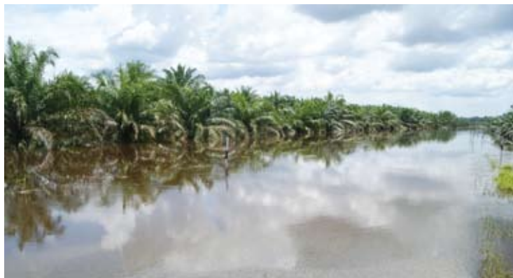
Jalan pintas ini sering ditenggelami air, menyukarkan aktiviti harian

PUSAT KHIDMAT DUN SUNGAI PANJANG Lot 1581 Tingkat 1, Jalan Bunga Kenanga Medan, 45300 Sungai Besar Tel :03-3224 7633 Fax :03-3224 7633