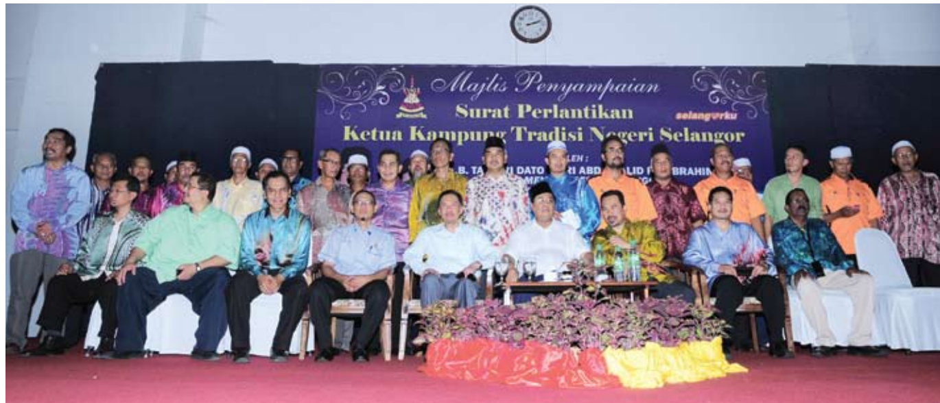
Pimpinan Pakatan Rakyat Selangor bergambar kenangan dengan ketua-ketua kampung yang dilantik

“Sebagai ketua masyarakat, semestinya berita ini menggembirakan saya kerana dapatlah saya salurkan bagi perkara-perkara