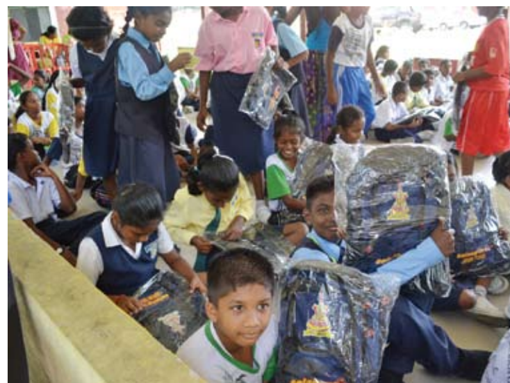
Pelajar-pelajar ini gembira dengan sumbangan beg yang diterima

"Beg kali ini lebih baik kualitinya berbanding daripada beg yang diedarkan dua tahun lalu," tambahnya.