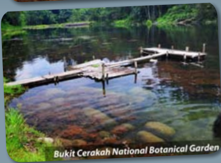
Bukit Cerakah National Botanical Garden