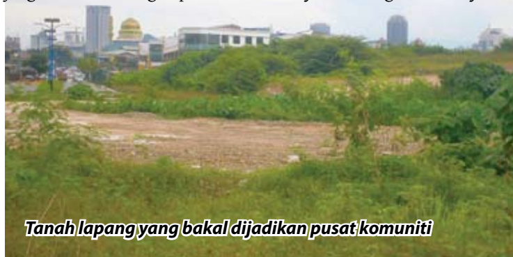
Tanah lapang yang bakal dijadikan pusat komuniti

“Pusat kemahiran itu mempunyai konsep yang sama seperti Pusat Latihan Giat Mara. Sehubungan itu, saya benar-benar berharap kerajaan negeri dapat memberi sokongan kepada usaha ini bagi mengelakkan masalah gejala sosial dari terus menular di kalangan masyarakat terutamanya di Selangor,” katanya.