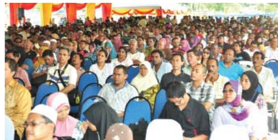
Melalui majlis dialog, pemimpin berpeluang mendengar rintihan rakyat

“Dengan adanya dialog ini mereka dapat melepaskan perasaan. Itu juga sesuatu yang baik, kerana selepas itu mereka jadi lebih lega,” ujarnya lagi.