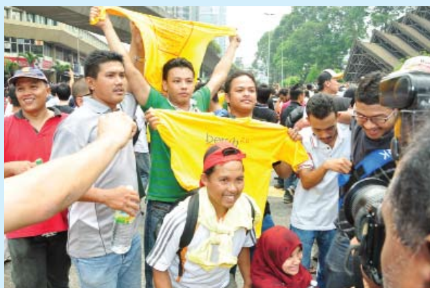
Bersih 2.0 dilancar menuntut perubahan dalam perjalan sistem pilihan raya yang lebih adil dan bersih

bawa perkara ini kepada SPR," Abdul Khalid berkata apabila ditemui di luar Dewan Negeri Selangor (DNS).