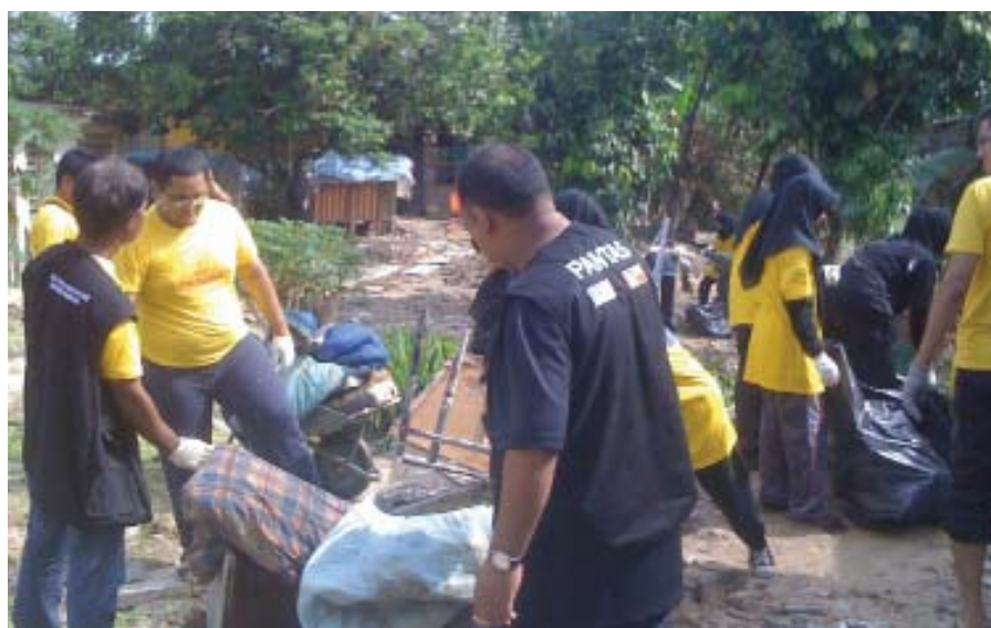
Banyak harta benda yang musnah akibat banjir

Kerajaan negeri juga memperuntukkan sejumlah dana bagi membaiki prasarana seperti jambatan dan jalan raya yang rosak di kawasan terbabit. Kerja-kerja baik pulih tersebut dijangka mengambil masa sebulan dan akan dimulakan dalam waktu terdekat melalui peruntukan geran Selangorku