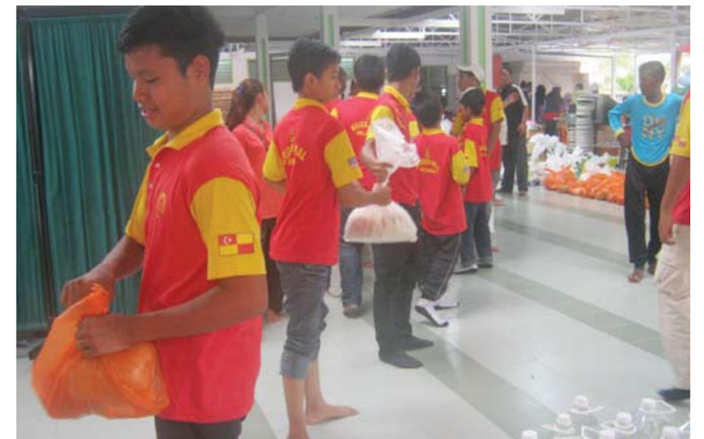
MELENTUR BULUH BIAR DARI REBUNG... Pasukan Briget Amal Selangor, menolong mengedarkan barang-barang bantuan kepada mangsa banjir di Pusat Khidmat Masyarakat Lembah Jaya