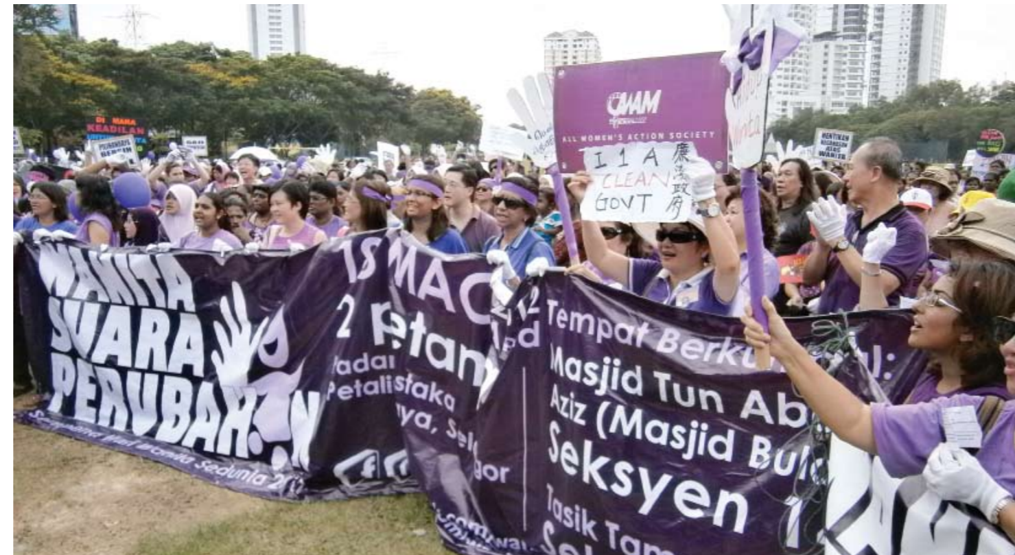
SUARA RAKYAT... perhimpunan Wanita Suara Perubahan sempena Hari Wanita Sedunia di Padang Astaka bagi menuntut supaya Kerajaan Pusat merealisasikan pilihan raya bersih dan adil di negara ini, khususnya bagi Pilihan Raya Umum ke-13 (PRU13) nanti dengan membersihkan undi pos, mereformasikan undi pos, gunakan dakwat kekal, masa kempen minima 21 hari, akses media yang bebas dan adil serta kukuhkan institusi awam