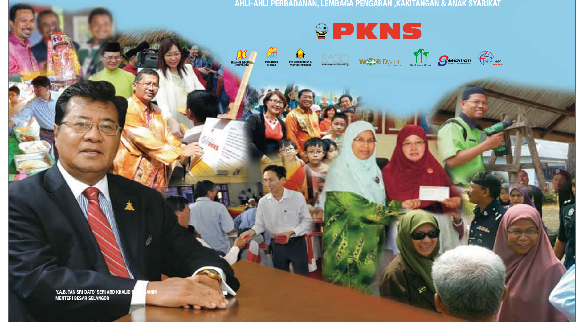
Y.A.B. TAN SRI DATO' SERI ABD KHALID IBRAHIM MENTERI BESAR SELANGOR