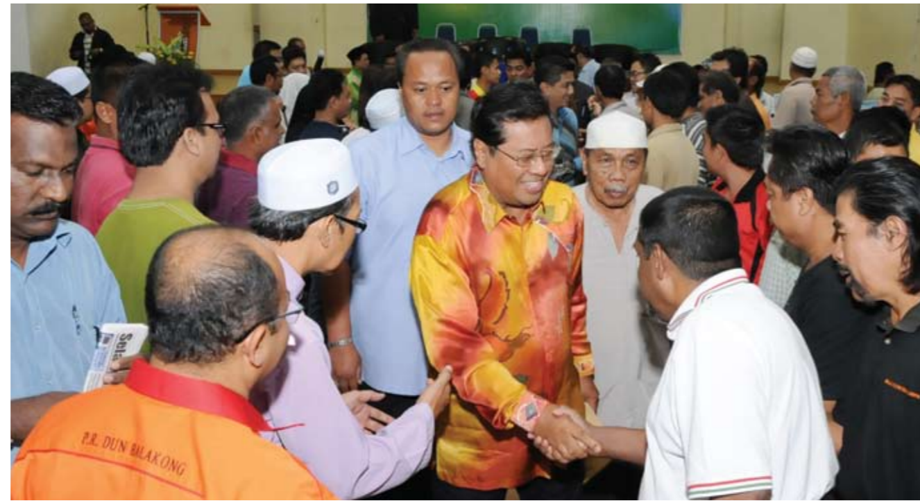
Menteri Besar bersalaman dengan orang ramai, selepas selesai Majlis Mesra Rakyat di Hulu Langat