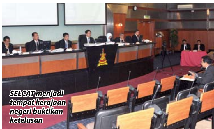
SELCAT menjadi tempat kerajaan negeri buktikan ketelusan

Dalam setiap perbelanjaannya, Selangor amat mendahulukan dan mengutamakan budaya cermat bagi memastikan setiap sen daripada setiap peruntukan ini terlepas daripada mana-mana orang tengah dan sampai terus kepada rakyat.