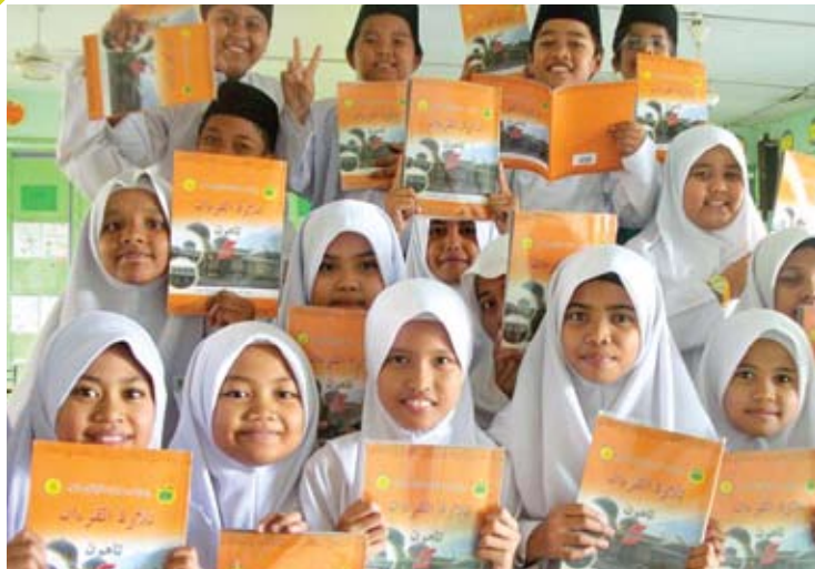
Sekolah vernakular yang dahulunya terabai turut mendapat peruntukan daripada kerajaan negeri

Kita harus lakukan perkara ini dengan cara yang betul. Jika kita lakukan dengan betul, tidak ada apa-apa yang perlu kita takutkan. Jadi, lakukanlah!