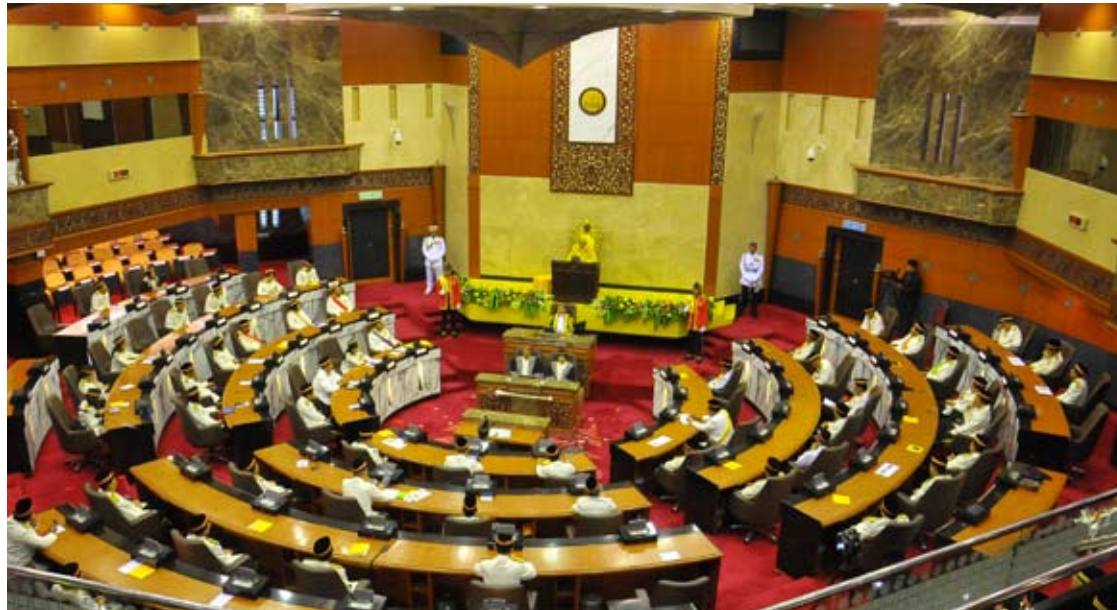
Sidang Dewan Negeri menjadi arena perbincangan kritis terhadap kerajaan dan pelaksanaan dasar-dasar kerajaan