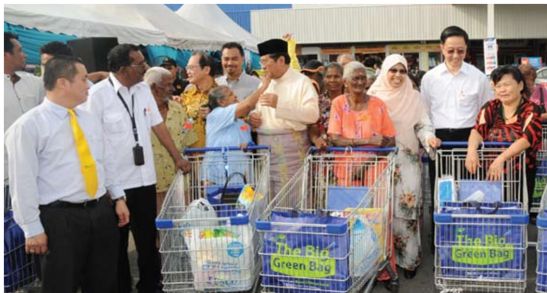
Jom Shopping merupakan agenda murni kerajaan negeri membalas jasa golongan warga emas

“Kita harus lakukan perkara ini dengan cara yang betul. Jika kita lakukan dengan betul, tidak ada apa-apa yang perlu kita takutkan. Jadi, lakukanlah!”