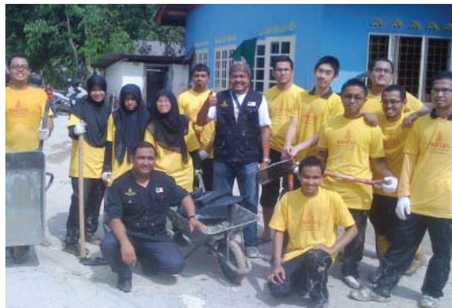
Sebahagian daripada anggota Pantas bergotong-royong membersihkan rumah-rumah mangsa banjir

Kerajaan negeri juga memperuntukkan sejumlah dana bagi