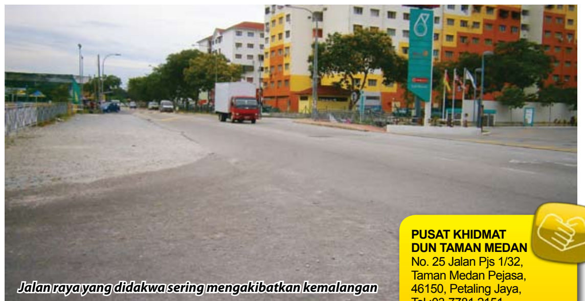
Jalan raya yang didakwa sering mengakibatkan kemalangan