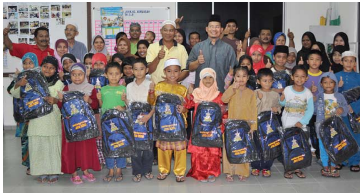
Saari Sungib dengan kerjasama Pusat Khidmat Masyarakat DUN Hulu Kelang menyumbangkan beg sekolah kepada murid-murid sekitar DUN berkenaan di Dewan JKKK Kampung Kemensah.