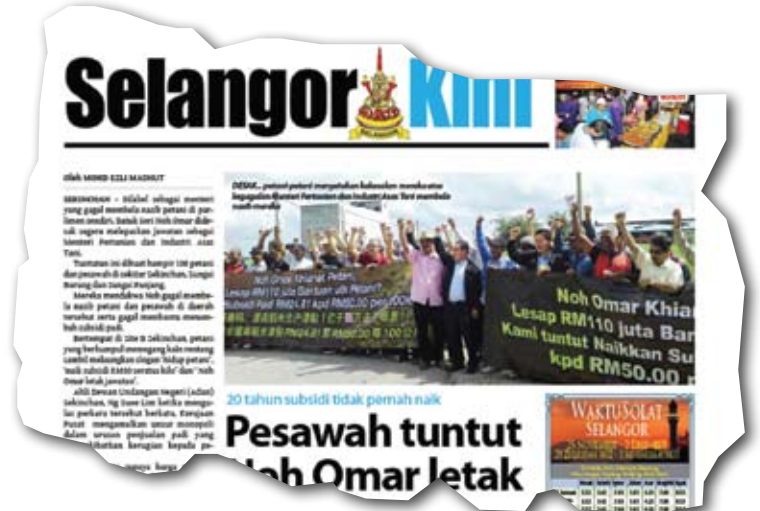
Berita tentang nasib petani di Tanjung Karang yang menjadi 'kemarahan' Noh

Tambahnya, susulan dari- pada demonstrasi itu dalam tempoh lima hingga tujuh