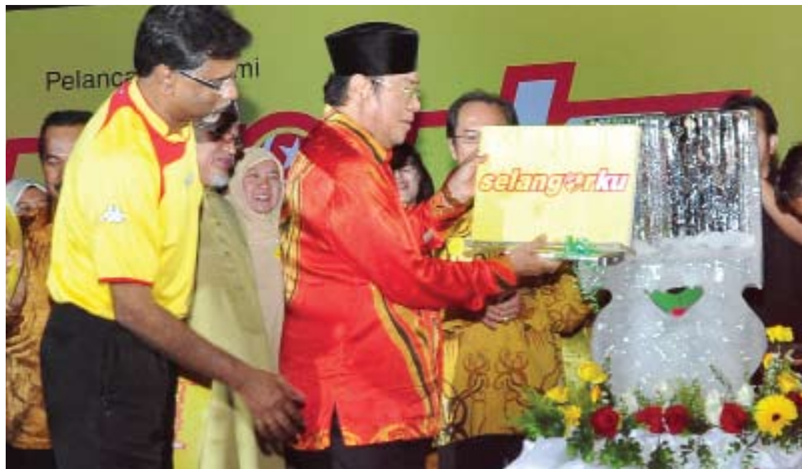
Pelancaran logo 'Selangorku' sebagai simbol kerajaan negeri oleh Menteri Besar

Jika GLC negeri terlalu dungu hingga melanggar undang-undang maka kerajaan negeri akan menghukumnya, sama seperti kerajaan negeri yang akan menghukum mana-mana syarikat persendirian. Kami tidak boleh memilih bulu