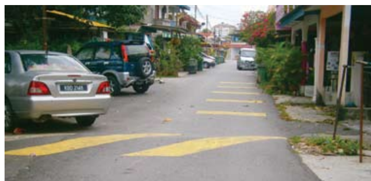
SEMPIT... pembinaan rumah yang tidak terancang menyebabkan masalah tempat letak kereta berlaku

“Penghuni juga terpaksa berhadapan dengan kesesakan kritikal di jalan utama dan lorong di taman untuk keluar masuk rumah pada waktu pagi dan petang,” tegasnya.