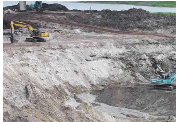
Hasil perolehan daripada perlombongan pasir di Selangor disalurkan terus kepada rakyat melalui program MES

jakan lebih daripada RM600 juta kepada lebih daripada 1.6 juta rakyat melalui pelbagai program di bawah program Merakyatkan Ekonomi Selangor (MES).