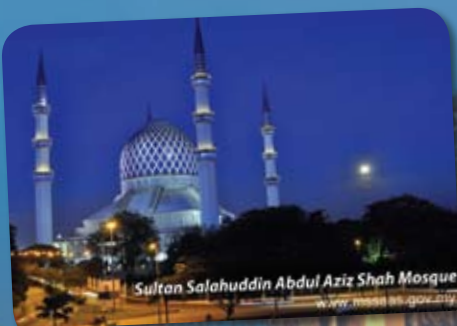
Sultan Salahuddin Abdul Aziz Shah Mosque www.masjid.gov.my

A1-11-2 & A1-11-3, Jln Multimedia 7/AH, Park City, I-City, 40000 Shah Alam, Selangor No Tel: 03-55218740 Faks: 03-55218742