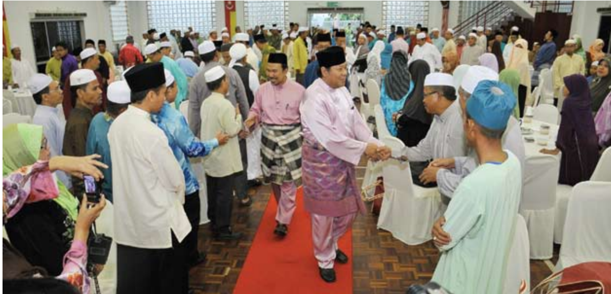
MESRA... Menteri Besar bersalaman dengan pemimpin masyarakat sewaktu majlis terbuka puasa di kediaman beliau

SHAH ALAM - Tujuh Dewan Undangan Negeri (DUN) di Selangor berjaya menyelesaikan proses mengenal pasti pengundi dalam Program Selangorku Bersih.