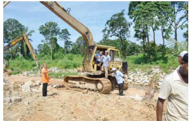
Pembinaan jambatan konkrit dibuat serta-merta apabila jambatan lama rosak teruk akibat banjir