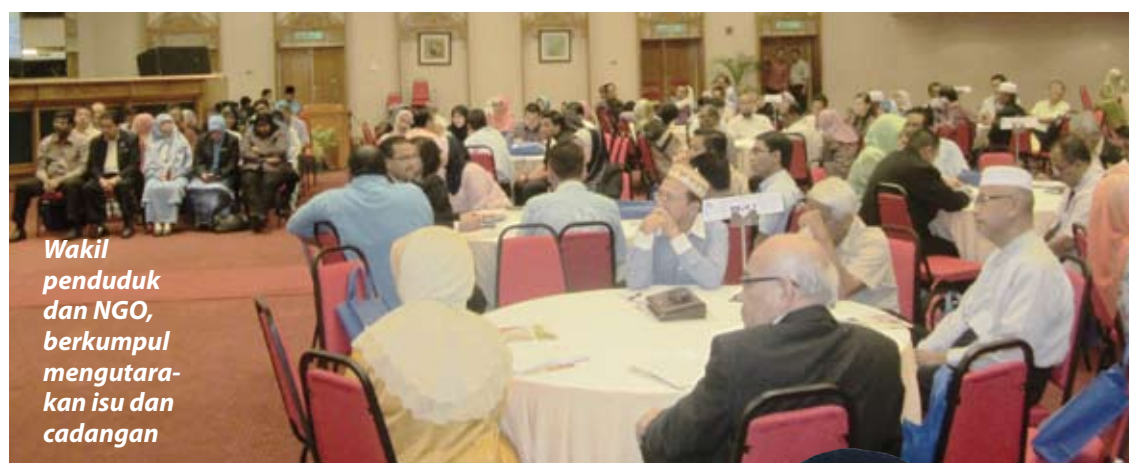
Wakil penduduk dan NGO, berkumpul mengutarakan isu dan cadangan

Warga bandaraya juga berharap kursus keusahawanan dan program bimbingan diperbanyak dan diperluaskan, khususnya kepada golongan kurang mampu dan muda