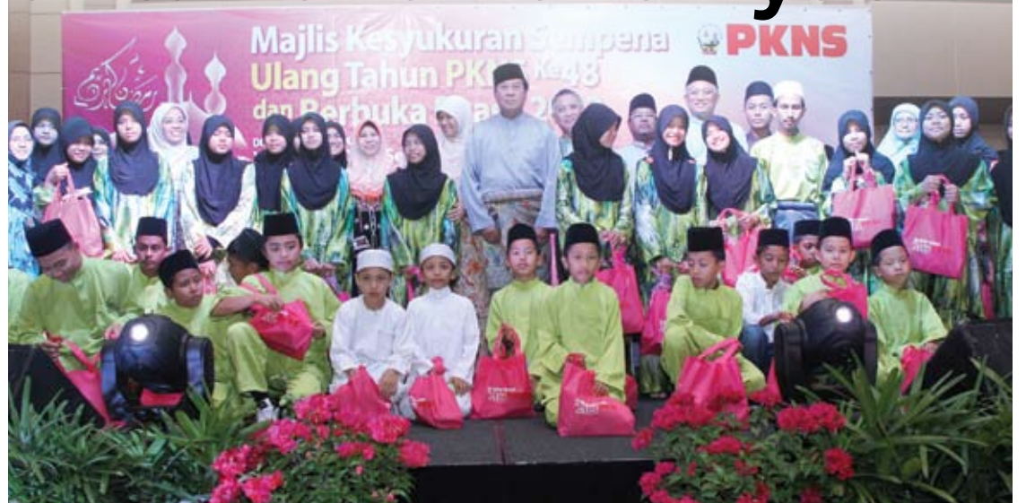
GEMBIRA... Menteri Besar bergambar beramai-ramai dengan anak-anak yatim