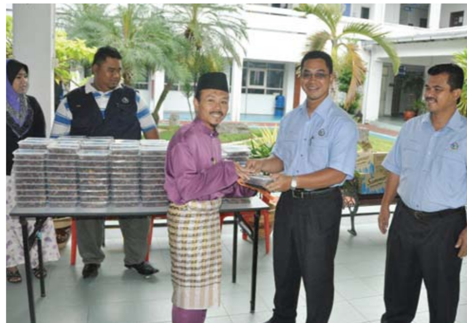
▲ Majlis sumbangan kurma kepada kakitangan Majlis Daerah Kuala Langat (MDKL) sempena menyambut bulan Ramadan