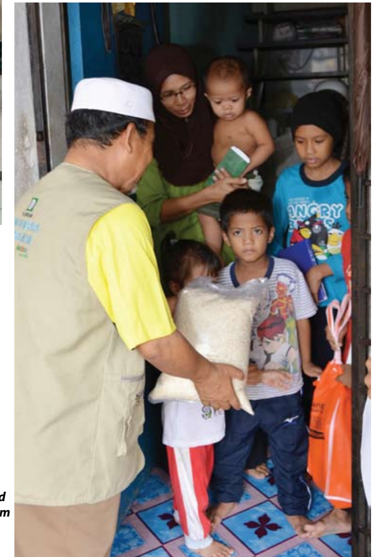
▲ PENYAYANG... Ahli Parlimen Kuala Selangor, Dr Dzulkefly Ahmad, meraikan peserta Jom Shopping Bonus Selangorku di Econsave Alam Jaya, Puncak Alam