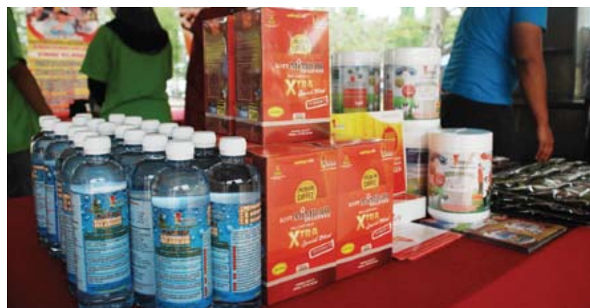
Antara produk-produk yang dihasilkan peserta Mimbar

"Inisiatif ini juga mampu menggalakkan peniaga supaya lebih agresif, berkeyakinan, dan bersungguh-sungguh dalam usaha menambah pendapatan seisi keluarga," ujarnya.