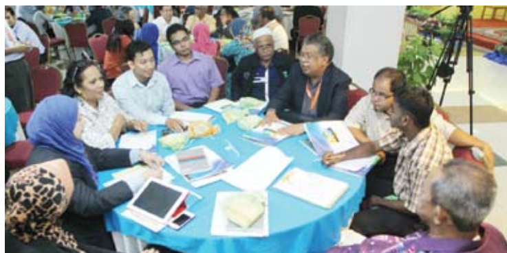
MUFAKAT... berbincang dan saling bertukar-tukar pendapat