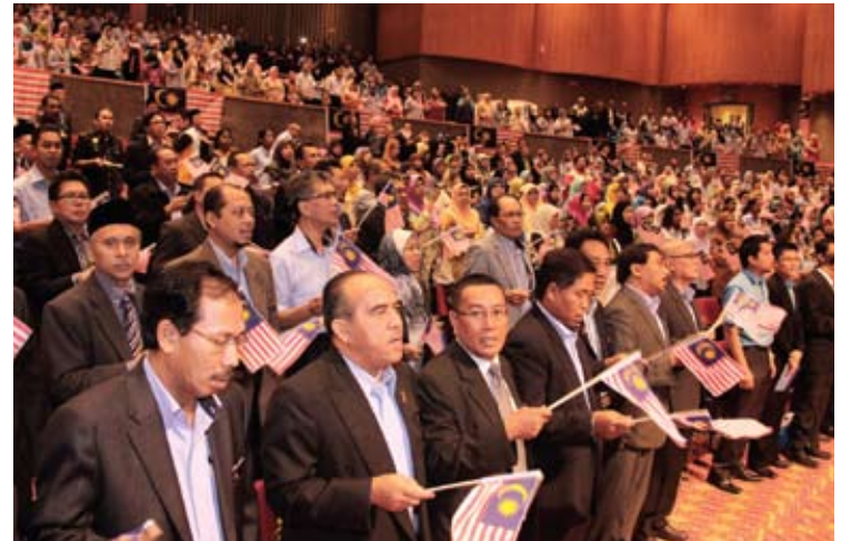
Penjawat awam menjadi tulang belakang kemajuan negara