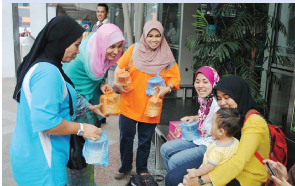
MESRA... Ahli Parlimen Lembah Pantai, Nurul Izzah Anwar, bersama petugas Pusat Khidmat Masyarakat Lembah Pantai, mengedarkan bubur lambuk sempena Ramadan di sekitar Stesyen LRT Bangsar dan KL Sentral

"Tindakan mereka ini sengaja menafikan hak rakyat untuk menikmati perkhidmatan air bersih pada kadar berpatutan semata-mata kerana mahu menawarkan kontrak besar dan lumayan kepada kroni termasuk projek Langat 2," katanya lagi.