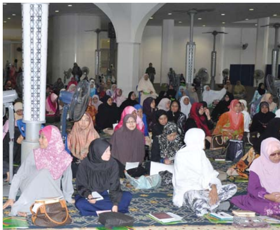
Kaum wanita tanpa mengira usia mengambil bahagian bertadurus di Masjid Negeri

"Fahaman itu seterusnya dapat kita terapkan kepada masyarakat bukan Is-