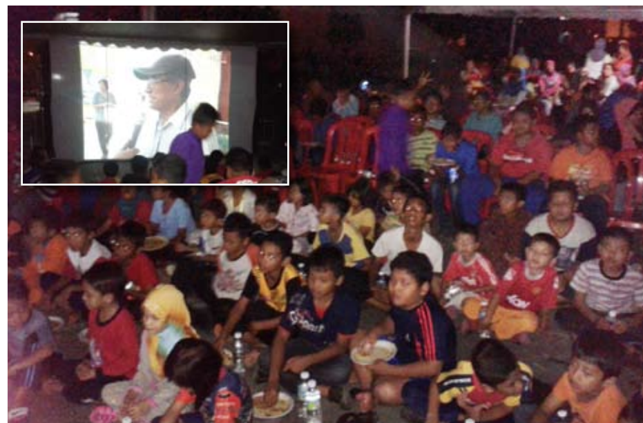
SANTAI... Wayang Pacak (gambar kecil) mendapat sambutan daripada masyarakat setempat.

“Sesi penerangan dengan diselang seli acara hiburan dalam program ini membolehkan hadirin berasa terhibur dan cara