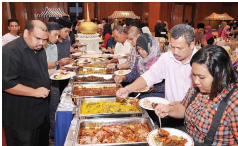
LAZAT... petugas media berbaris mengambil juadah untuk berbuka puasa

PUSAT TUISYEN RAKYAT Unit Pendidikan, Bahagian Pengurusan Sumber Manusia, Tingkat 3, Bangunan Sultan Salahuddin Abdul Aziz Shah, 40000 Shah Alam, Selangor Tel: 03-5544 7480/7481/7482/7543 Faks: 03-55104095/ 55135564/ 55447391 Blog http://tuisyenrakyat.blogspot.com