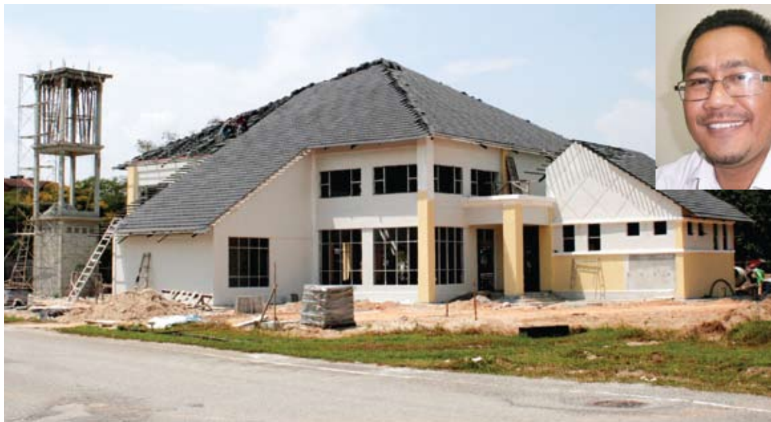
Surau Al Qayyum yang dijangka siap sepenuhnya menjelang Aidilfitri ini

lah daripada banyak pihak termasuk hasil kutipan dan derma orang ramai, tidak terkecuali Kerajaan Negeri yang menyumbang sebanyak RM300,000. Kita merakamkan ucapan penghargaan dan terima kasih atas segala bantuan ini,” katanya.