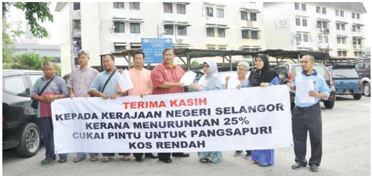
Penduduk Pandan Jaya mengucapkan terima kasih atas keprihatinan Kerajaan Negeri

Borang pengurangan cukai taksiran ini boleh dida-