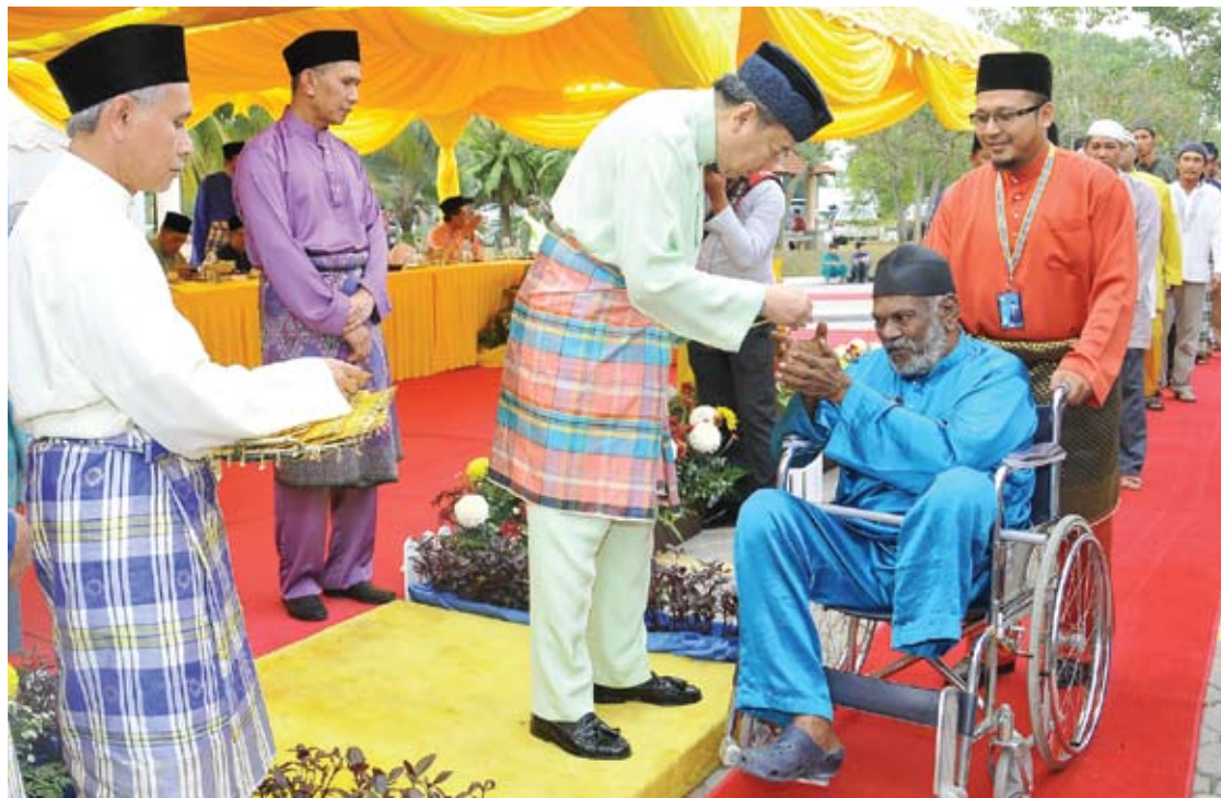
PRIHATIN... DYMM Sultan Selangor menyampaikan sumbangan kepada golongan OKU