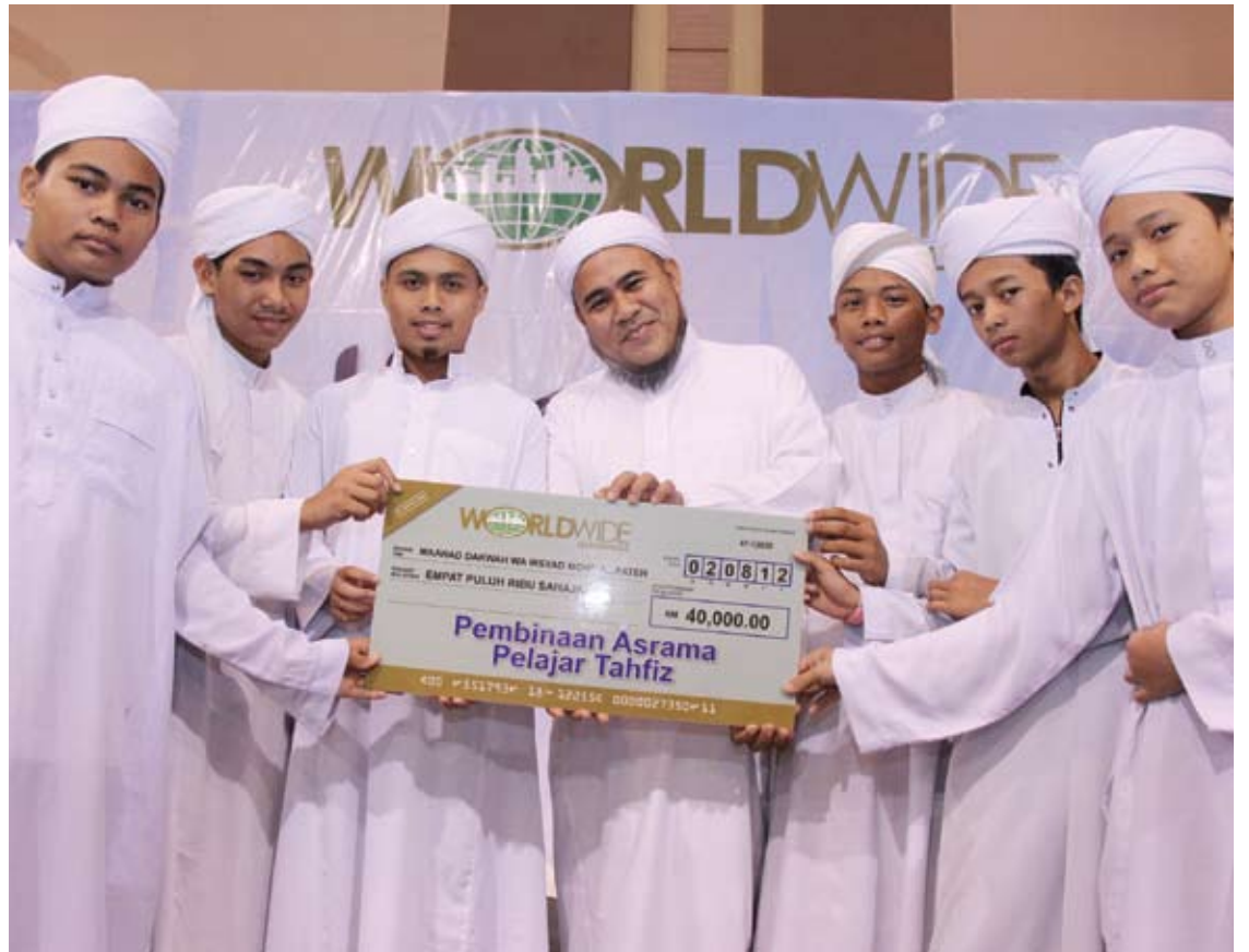
Maahad Dakwah Wa Irsyad Mohd Al-Fateh turut mendapat dana bagi pembinaan asrama tahfiz

Antara lain, Worldwide juga memberi sumbangan RM20,000 kepada Islamic Relief Malaysia, RM40,000 kepada Maahad Dakwah Wa Irsyad Mohd Al Fateh bagi pembinaan pondok asrama serta RM5,850 kepada Pertubuhan Membantu Pesakit Parah Miskin Malaysia.