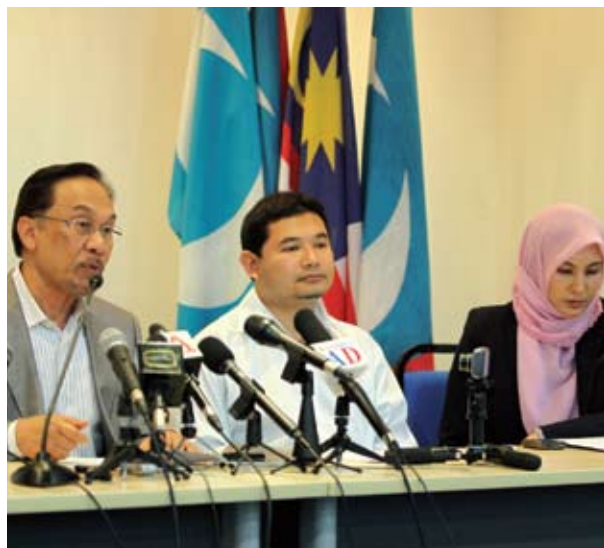
Anwar mahu kurangkan beban hutang rakyat

PETALING JAYA - Pakatan Rakyat (PR) akan mengutamakan pelaksanaan sistem pengangkutan awam yang cekap dengan kadar munasabah sebagai rancangan kerangka dasar automotif negara jika berjaya menawan Putrajaya.