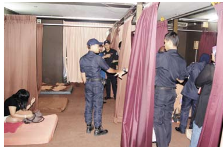
CEGAH... MPK teruskan operasi membanteras rumah urut haram

Menurutnya, MPK tidak akan berkompromi terhadap mana-mana pihak yang ingkar kepada undang-undang dan majlis sentiasa mengalu-alukan aduan dan pendapat daripada orang awam bagi tujuan pencegahan.