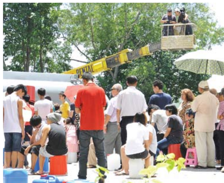
Rakyat jadi mangsa kerakusan kuasa mereka yang tidak bertanggungjawab

mereka juga kelihatan merungut dan memekik marah kerana terpaksa beratur panjang untuk mendapatkan air bagi keperluan harian.