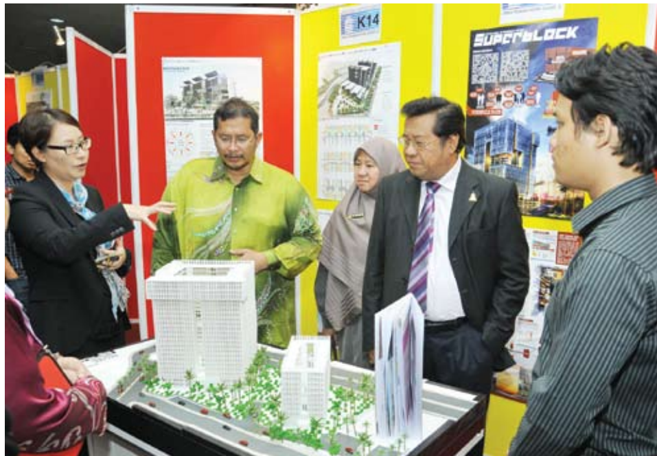
Menteri Besar serta para Exco melihat hasil ciptaan kumpulan 'Superblock' yang menjuarai pertandingan