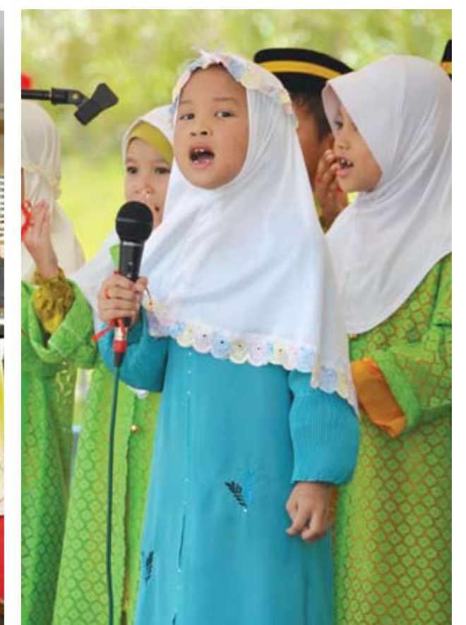
▲ COMEL... aksi kanak-kanak yang mengambil bahagian dalam persembahan nasyyid sewaktu Majlis Ramah Mesra di Bandar Seri Putra, Bandar Baru Bangi