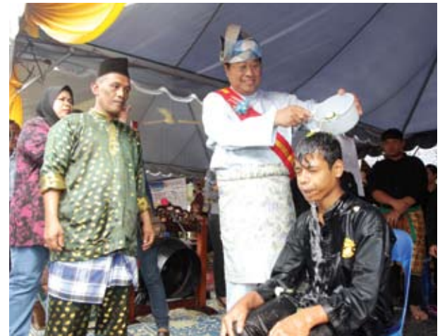
Menteri Besar menyiram air dalam upacara mandi perlimau adat sebagai memenuhi syarat penerimaan ahli baru Silat Gayong

"Tiada gunanya jadi negara maju, tetapi hilang asasnya, iaitu adat budaya kita," katanya keti-