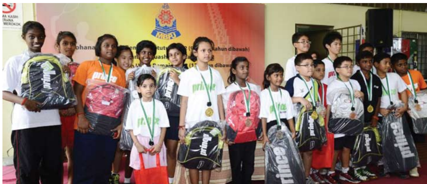
▲ SEMANGAT... sebahagian daripada kanak-kanak yang mengambil bahagian dalam Kejohanan Skuasy Terbuka MBPJ 2012, gembira bersama hadiah dan cenderahati yang diterima