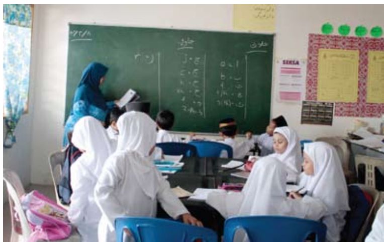
Guru agama memainkan peranan penting di dalam membentuk sahsiah pelajar

Sumbangan guru agama Kafa dalam pembangunan jiwa sangat penting, tetapi mereka menerima imbuhan yang sangat sedikit sebelum ini, langkah terbaru Kerajaan Negeri ini memberi semangat baru kepada guru-guru agama ini