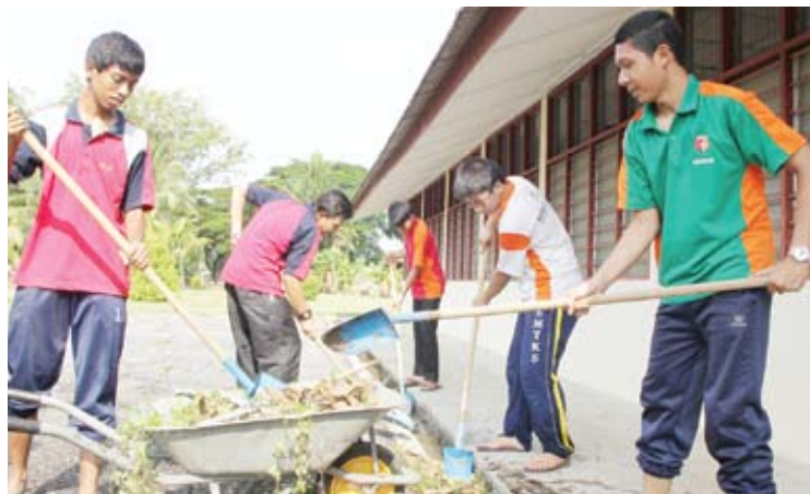
Anak muda ringan tangan membersihkan kawasan masjid