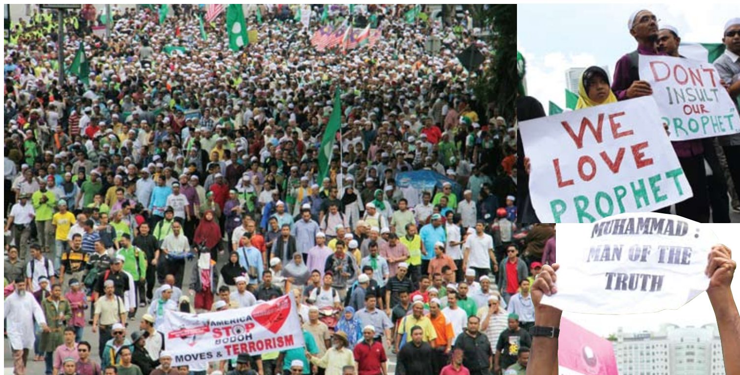
Ribuan umat Islam berarak ke Kedutaan Amerika bagi menyatakan bantahan ke atas filem yang menghina Nabi Muhamad SAW

Selain Nasrudin, wakil pimpinan yang hadir menyerahkan memorandum adalah Ketua Penerangan PAS, Datuk Tuan Ibrahim Tuan Man, Naib Presiden PAS Salahuddin Ayub,