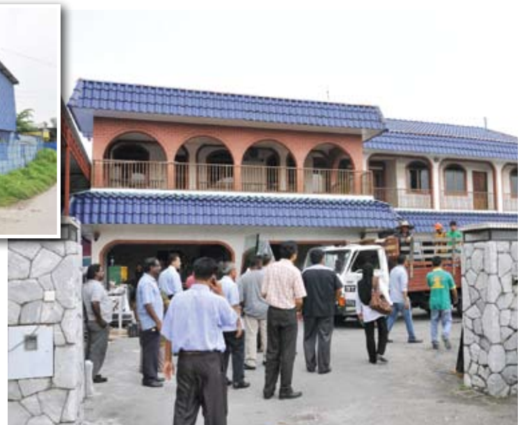
Meninjau kilang haram yang dibina di belakang rumah. Gambar kecil: Kilang haram dari pandangan luar

"Kami sudah tidak tahan dengan bunyi bising dan habuk disebabkan masalah ini, kerana rumah kami mempunyai kanakkanak, hendak tidur juga tidak