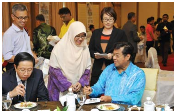
Menteri Besar menurunkan tandatangan pada buku beliau

Buku ini sudah pun berada di pasaran dan boleh didapati di kedai-kedai terkemuka.