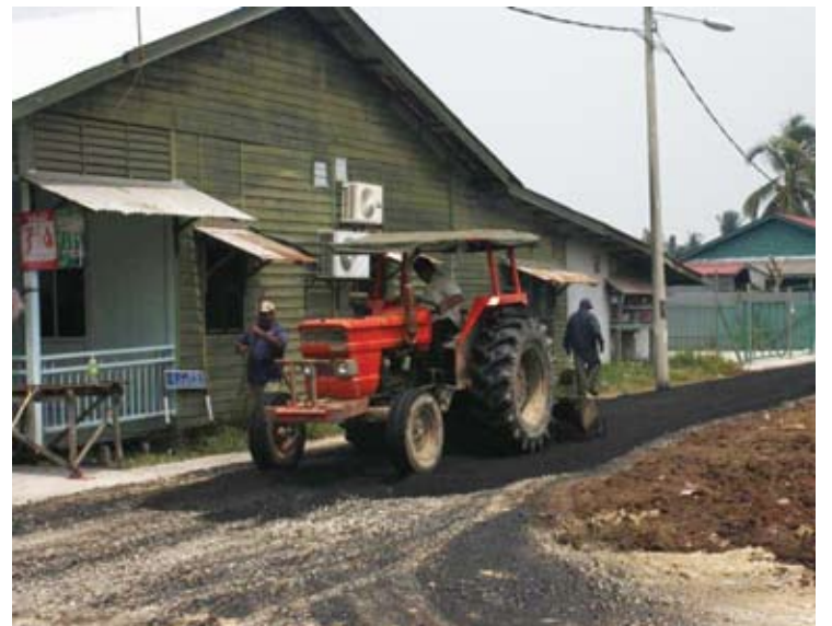
Kerja-kerja naik taraf jalan dilakukan dalam masa sehari