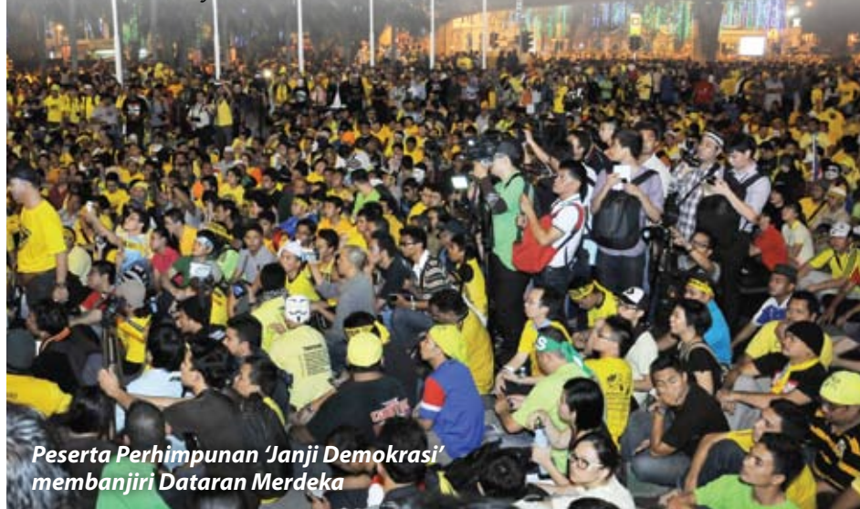
Peserta Perhimpunan 'Janji Demokrasi' membanjiri Dataran Merdeka

Hadir sama barisan pimpinan Pakatan Rakyat seperti Mohamad Sabu, Fuziah Salleh, Dr Dzulkefly Ahmad dan Tian Chua.