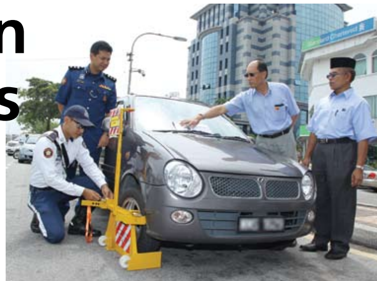
KUNCI... pemilik kenderaan kini lebih berhati-hati untuk meletakkan kenderaan mereka