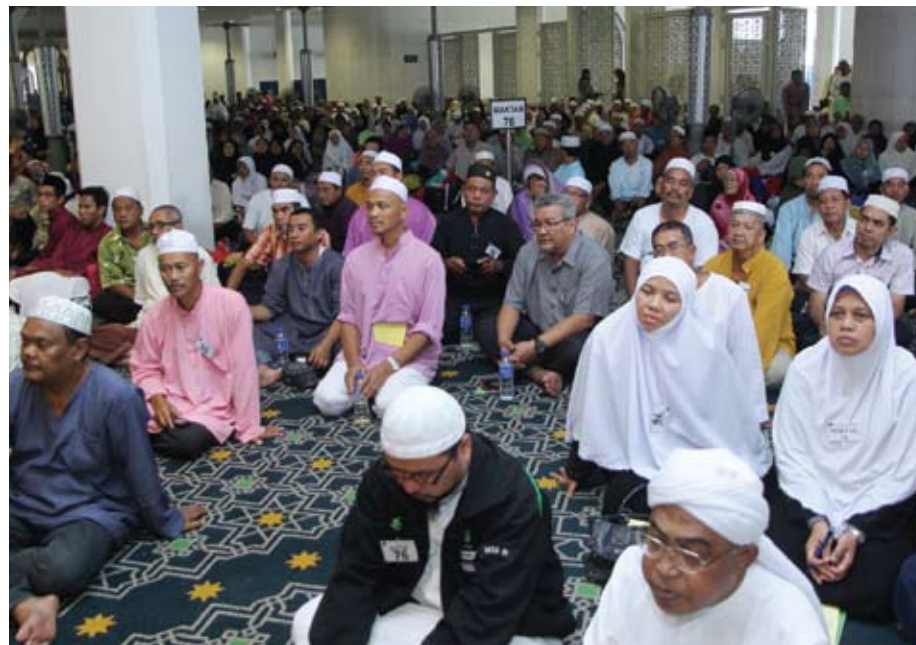
KHUSYUK... Sebahagian daripada peserta haji yang mengikuti program Penyempurnaan Kursus Perdana Haji 2012 di Masjid Negeri

Kursus Perdana Haji yang diadakan itu menghimpunkan semua bakal haji dari seluruh Negeri Selangor di mana seramai hampir 4,500 peserta dijemput menyertai kursus tersebut.