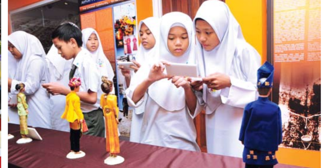
▲ TERTARIK... pelajar Sekolah Menengah Kebangsaan Taman Dato' Harun, melawat Muzium Petaling Jaya, sewaktu Program 'Jom Melawat Muzium' Siri 3 2012 anjuran Muzium Petaling Jaya