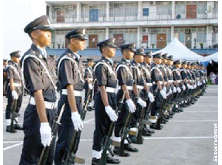
Tawaran kenaikan gaji anggota polis diharap dapat menaikkan semangat mereka untuk bekerja dengan lebih efisien

Katanya, langkah ini dapat menguruskan kewangan negara dengan lebih baik dan memberikan banyak manfaat kepada negara.