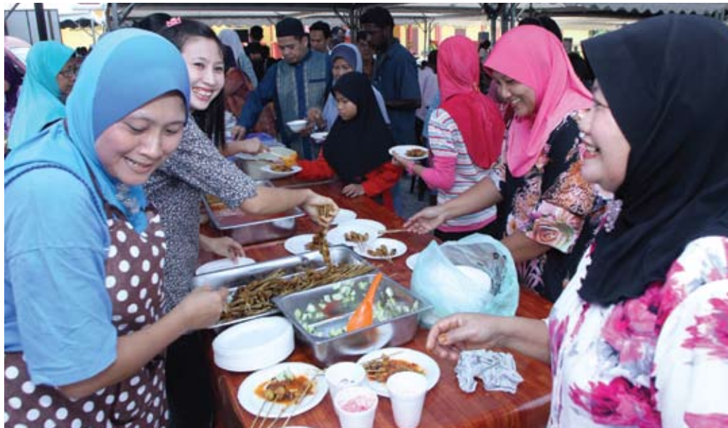
ENAK... orang ramai tidak melepaskan peluang menikmati juadah pada Majlis Rumah Terbuka DUN Ijok