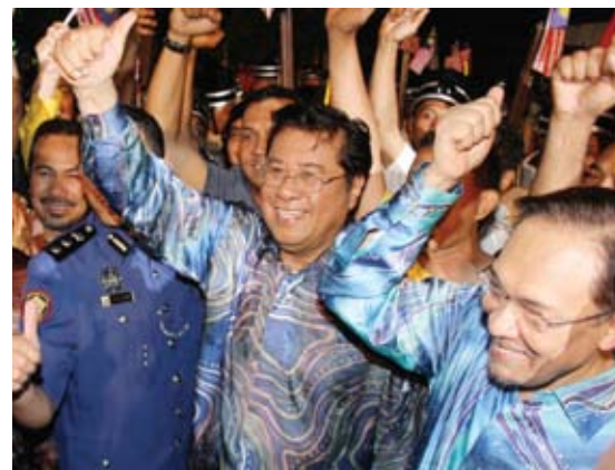
SEMANGAT... Menteri Besar dan Anwar melaungkan merdeka bersama rakyat

"Khazanah Selangor mesti dipulangkan kepada rakyat negeri ini dan inilah nikmat kemerdekaan," katanya di hada-