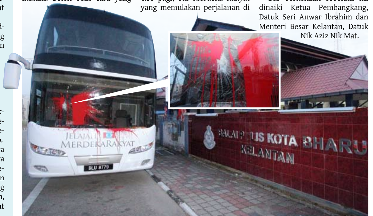
TIDAK BERMORAL... keadaan bus yang dipecahkan cermin dan kotor kerana disimbah cat

Bas berkenaan sebelum ini dinaiki Ketua Pembangkang, Datuk Seri Anwar Ibrahim dan Menteri Besar Kelantan, Datuk Nik Aziz Nik Mat.