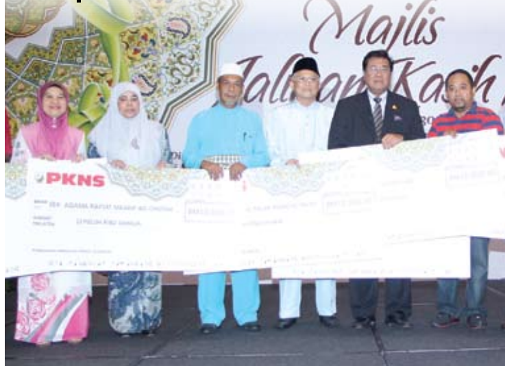
Menteri Besar dan Pengurus Besar PKNS, bergambar bersama sebahagian penerima

SHAH ALAM - Perbadanan Kemajuan Negeri Selangor (PKNS) memperuntukkan sejumlah RM3.4 juta bagi memenuhi tanggungjawab korporat sosialnya pada tahun ini.