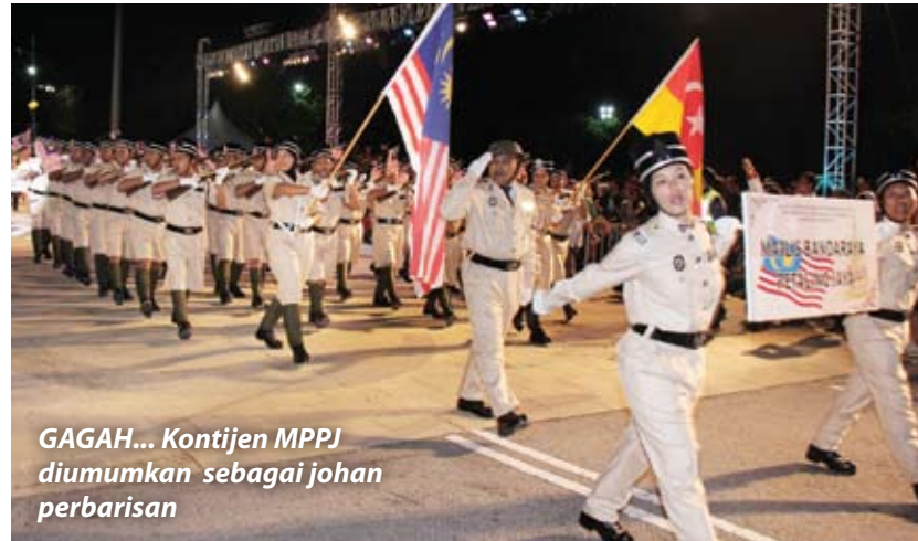
GAGAH... Kontijen MPPJ diumumkan sebagai johan perbarisan