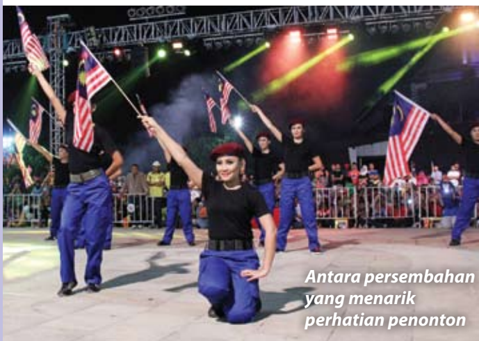
Antara persembahan yang menarik perhatian penonton

Sambutan kemerdekaan yang bertemakan 'Sebangsa, Senegara, Sejiwa: Terima Kasih Rakyat, Selangorku Terus Maju' itu turut dihadiri barisan Exco, Adun dan pimpinan Kerajaan Negeri.