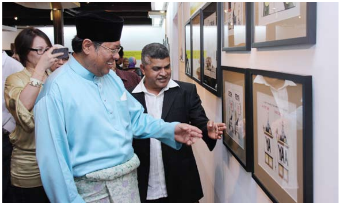
LUCU... Menteri Besar kelihatan tertarik dengan karya-karya kartun yang dipamerkan

PUSAT TUISYEN RAKYAT Unit Pendidikan, Bahagian Pengurusan Sumber Manusia, Tingkat 3, Bangunan Sultan Salahuddin Abdul Aziz Shah, 40000 Shah Alam, Selangor Tel: 03-5544 7480/7481/7482/7543 Faks: 03-55104095/ 55135564/ 55447391 Blog http://tuisyenrakyat.blogspot.com