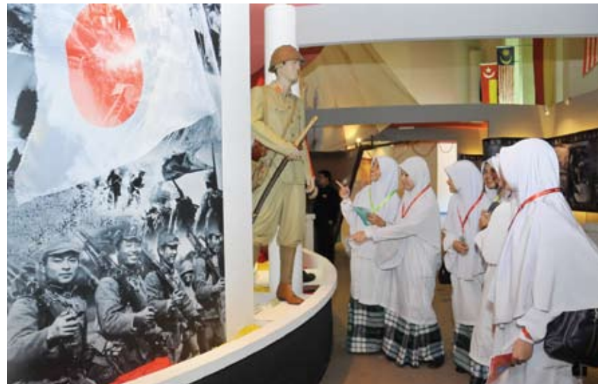
Pelajar Kolej Islam Sultan Alam Shah (Kisas), tertarik dengan barang-barang yang dipamerkan di Muzium Sultan Alam Shah

"Kesemua penambahbaikan ini bakal dilaksanakan tahun hadapan melalui Belanjawan Negeri yang akan di-