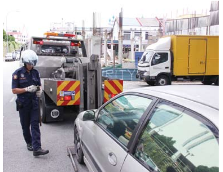
MPK tidak akan teragak-agak untuk mengambil tindakan ke atas kenderaan yang mengganggu kelancaran lalu lintas

Dalam pada itu, orang awam yang ditemui menyambut baik langkah MPK yang dilihat sebagai satu usaha melancarkan lagi perjalanan trafik di Klang.