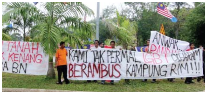
Rombongan Anwar disambut dengan kata-kata hinaan dan cacian

Kali terakhir pengumuman rasmi dibuat ialah pada bulan Julai apabila Menteri Kewangan Kedua, Datuk Ahmad Husni Hanadzlah mengumumkan pengurangan RM0.20 harga seliter.