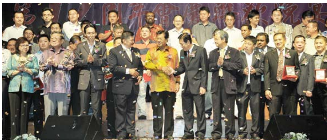
KERJASAMA... Menteri Besar bergambar dengan Ahli Persatuan Pekilang-Pekilang Telok Gong

KLANG - Menteri Besar, Tan Sri Abdul Khalid Ibrahim akan mengadakan perbincangan bersama persatuan pekilang-pekilang di negeri Selangor bulan depan bagi menambah baik infrastruktur kilang-kilang terlibat.