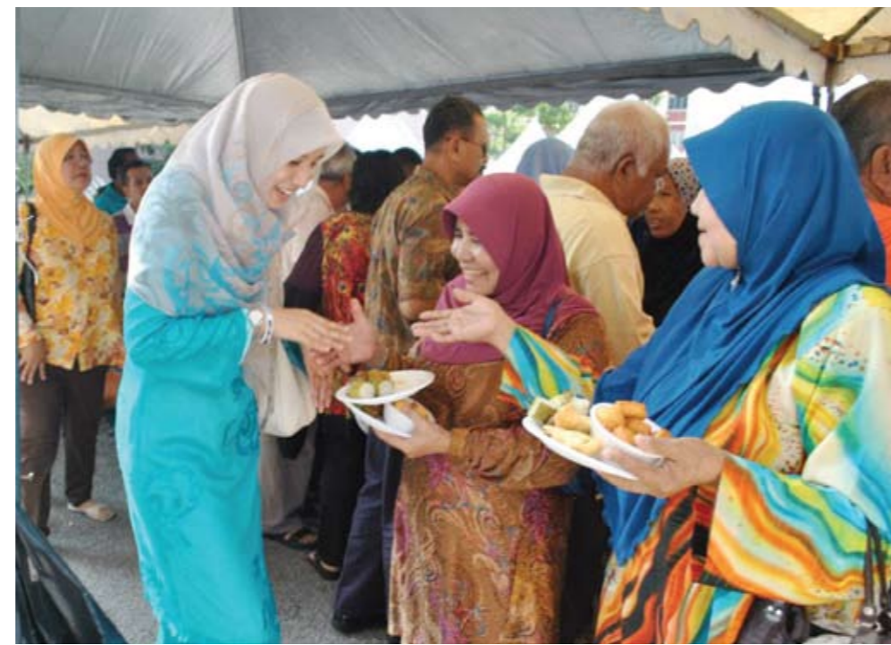
MESRA... Ahli Parlimen Lembah Pantai, Nurul Izzah Anwar bersalaman dengan tetamu yang hadir pada Majlis Jamuan Aidilfitri di Pangsapuri Pantai Permai