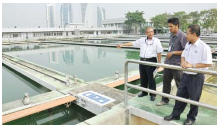
Kerajaan Negeri mempunyai hak dan kuasa dalam projek Langkat 2

Tambahnya, beliau turut meminta pandangan Penasihat Undang-undang Negeri dan peguam yang dilantik untuk membuat satu kenyataan undang-