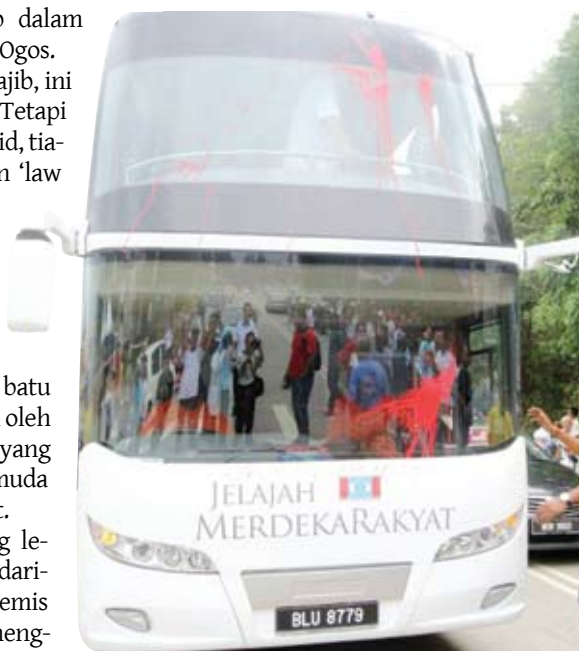
Penyokong Umno-BN Melaka bertindak sembrono ke atas bas Jelajah Merdeka Rakyat yang dinaiki Anwar

Malah, gambar muka samseng daripada kedua-dua insiden tersebut