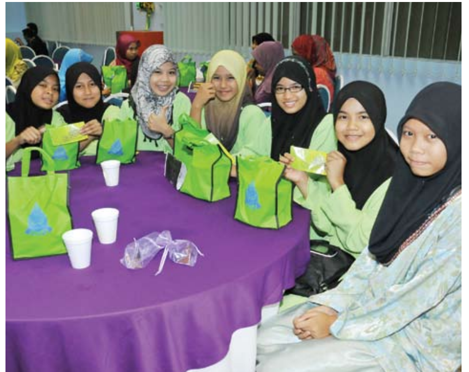
Anak-anak yatim ini gembira menerima duit raya dan cenderahati daripada MBPJ

"Pada 1 Syawal saya menziarahi kubur ayah dan apabila menonton iklan anak yatim di televisyen itu, saya amat