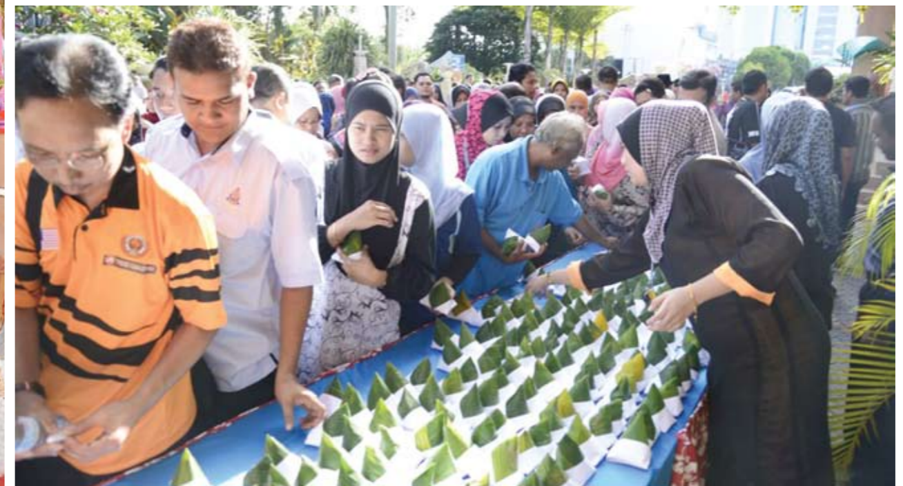
ALAS PERUT... kakitangan Majlis Bandaraya Petaling Jaya (MBPJ), memulakan Program Gotong-Royong Perdana di Ibu Pejabat MBPJ dengan bersarapan nasi lemak terlebih dulu