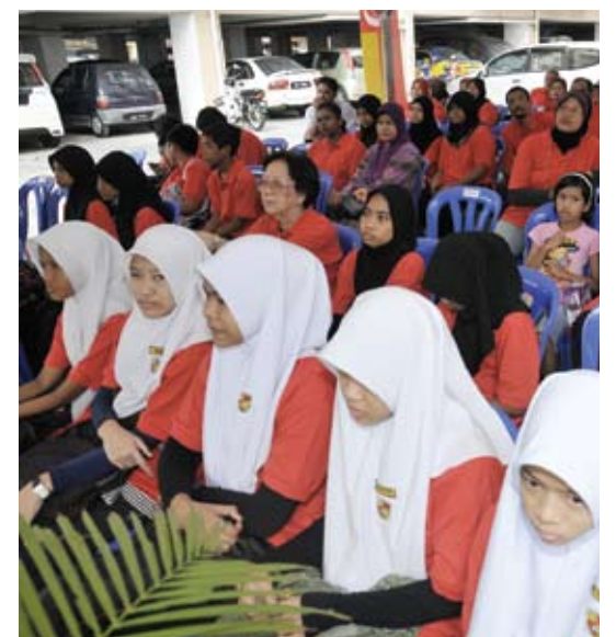
Sebahagian daripada pelajar dan penduduk yang terlibat dalam Skuad Denggi