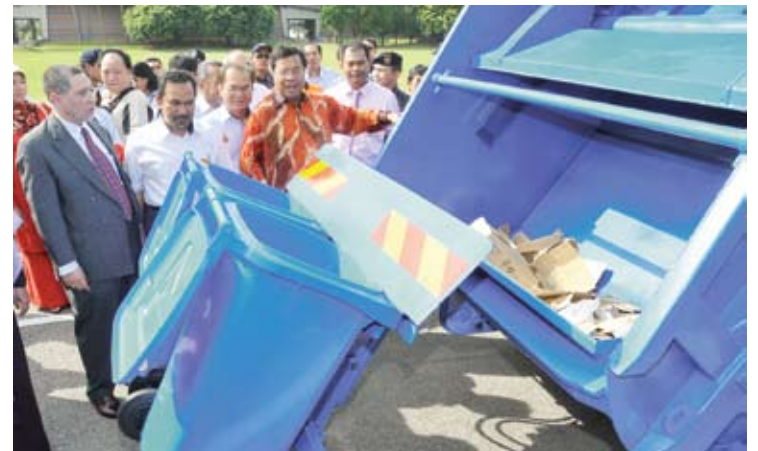
Kompaktor sampah baru untuk disewa kontraktor daripada PBT

Katanya, kompaktor yang dibeli itu adalah berpatutan dan