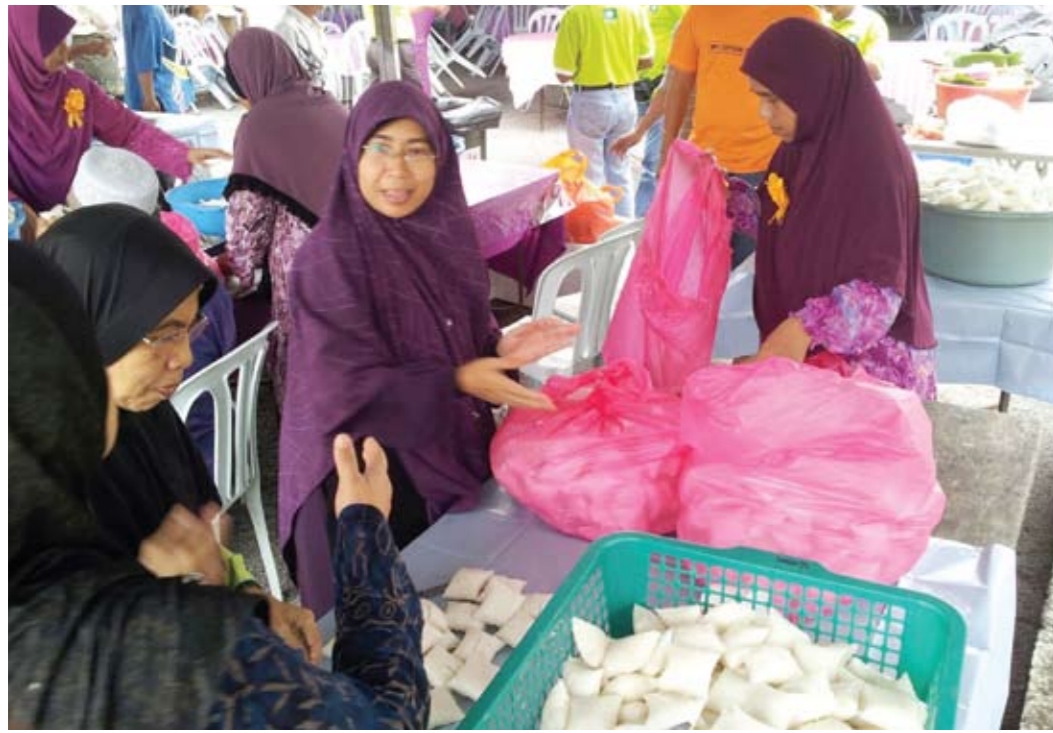
Antara tenaga penting Rumah Terbuka Parlimen Kota Raja yang sedang bertungkus-lumus memotong nasi himpit bagi menjamu kepada tetamu yang hadir pada Majlis Rumah Terbuka Aidilfitri Parlimen Kota Raja