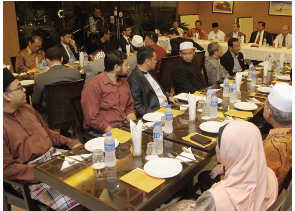
Pimpinan Kerajaan Negeri serta NGO turut hadir meraikan rombongan Menteri Kesihatan Gaza-Palestin, Dr Basem Naim

Sementara itu, Dr Basem pula berkata, selain mengucapkan setinggi-tinggi terima kasih, beliau turut melahirkan keyakinan masyarakat di Malaysia, khususnya di Selangor akan terus membantu untuk memenuhi dana pembinaan hospital di Palestin.