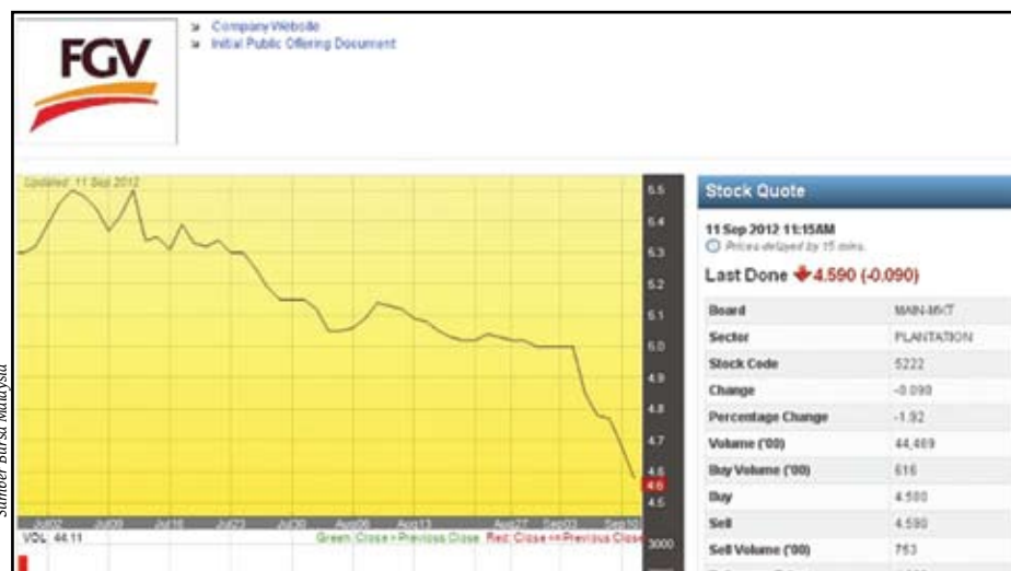
BUKTI... carta menunjukkan saham FGVH terus jatuh sejak ia dilancarkan

Pengerusi Persatuan Anak Peneroka Felda Kebangsaan (Anak), Mazlan Aliman berkata, walaupun saham FGVH disenaraikan pada RM4.55 dan naik kepada RM5.33, tetapi dalam tempoh yang begitu singkat saham ini mula menurun.