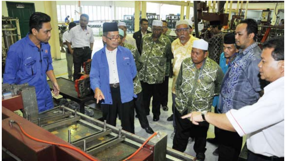
Ketua kampung diberi penerangan tentang pengendalian serta fungsi mesin di kilang Motor Teknologi