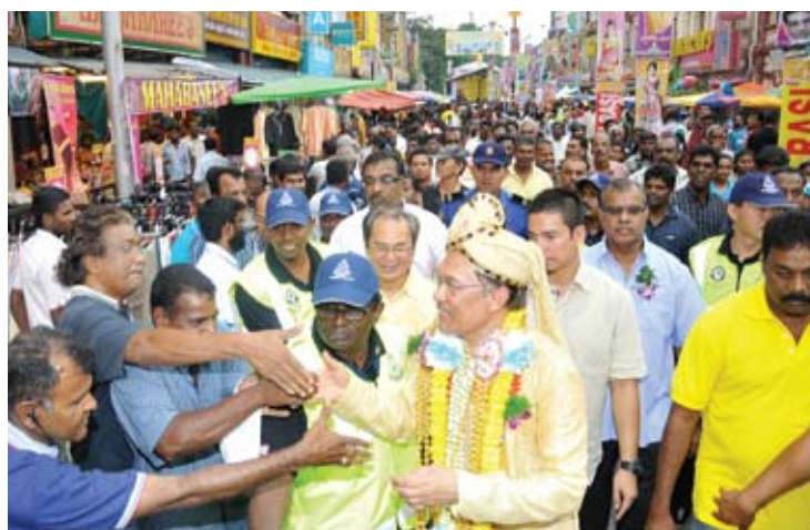
Orang ramai tidak melepaskan peluang bersalaman dengan Anwar