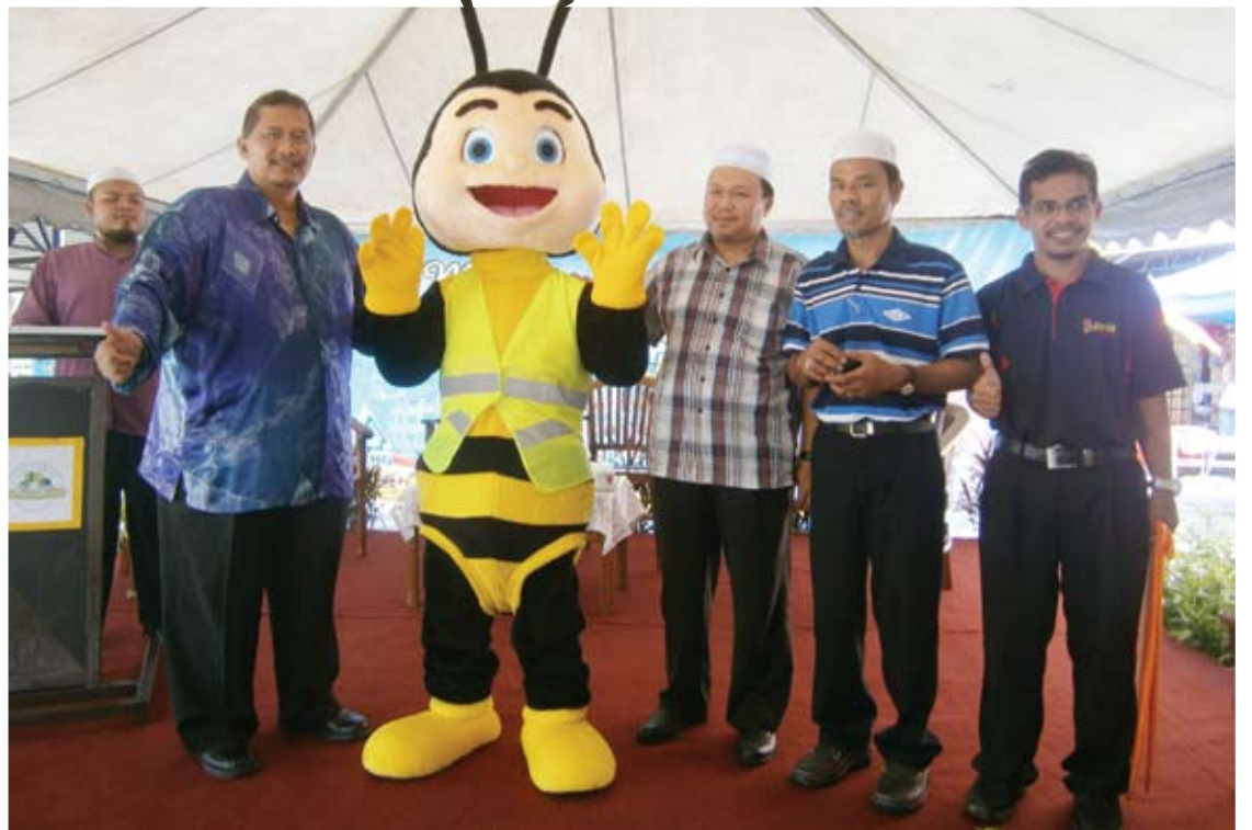
Iskandar sewaktu majlis perasmian Skim Rondaan Kejranaan untuk pangsapuri-pangsapuri di Selangor

rut menyerahkan Sijil Skim Ceria kepada tiga JMB, iaitu Pangsapuri F9-F10 dan Pangsapuri F5-F8 yang mana masing-masing mendapat bantuan membaik pulih lif.