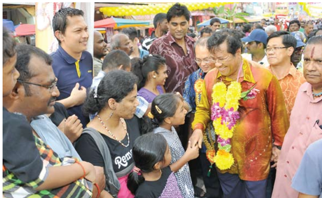
Kanak-kanak juga tidak melepaskan peluang untuk bersalaman dengan Menteri Besar