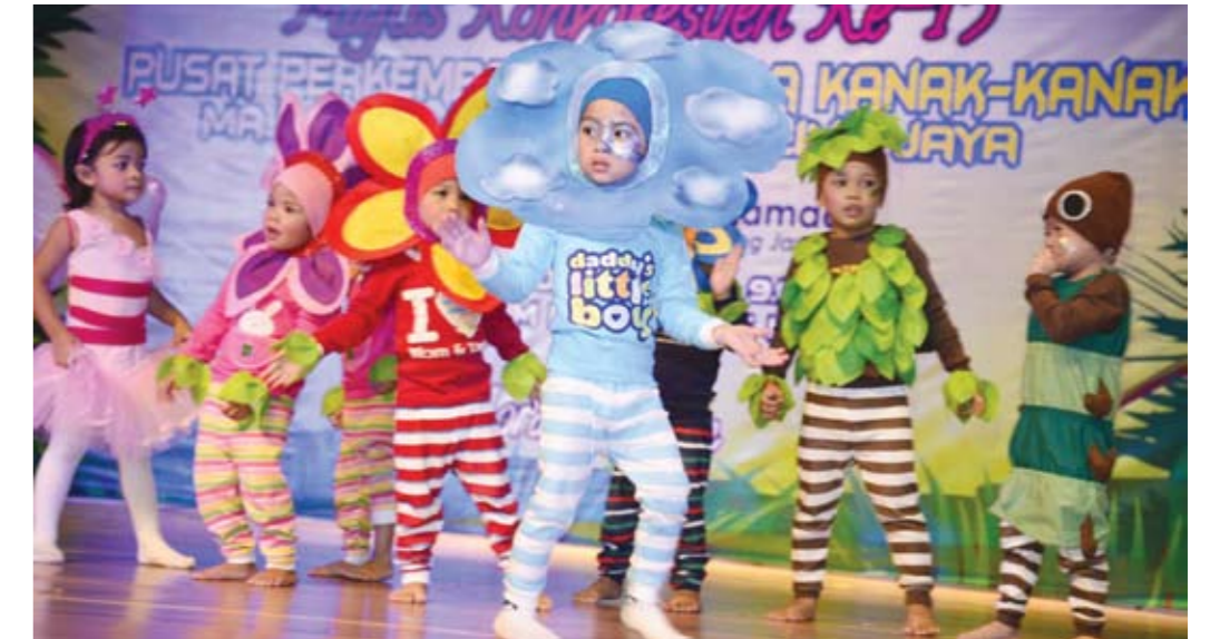
▲ MENCUIT HATI... Majlis Konvokesyen Ke-15, Pusat Perkembangan Minda Kanak-kanak, Majlis Bandaraya Petaling Jaya, berlangsung penuh meriah dengan pelbagai persembahan daripada murid tadika