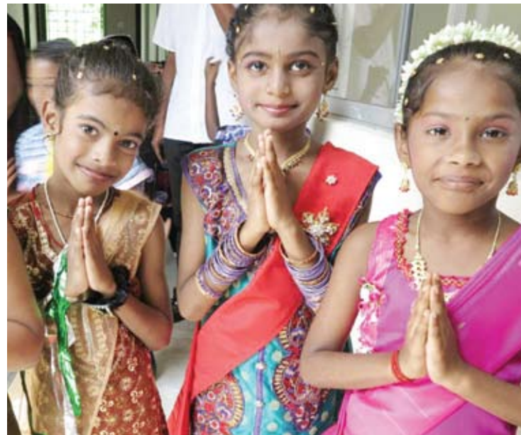
Kanak-kanak tadika ini manis berpakaian tradisional sewaktu membuat persembahan

Tadika yang bernilai kira-kira RM460,000 itu dilengkapi lapan buah kelas dan mampu menempatkan kira-kira 20 orang murid setiap kelas.