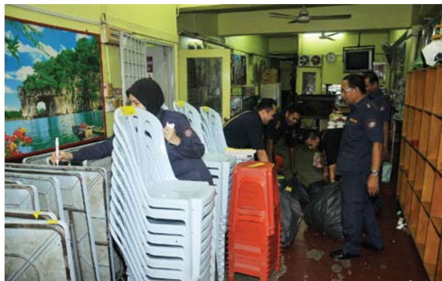
Penguatkuasa MBSA sedang mengumpul barang-barang yang disita

Katanya, kesemua premis ini dipercayai dimiliki warga tempatan, namun disewakan kepada warga asing untuk