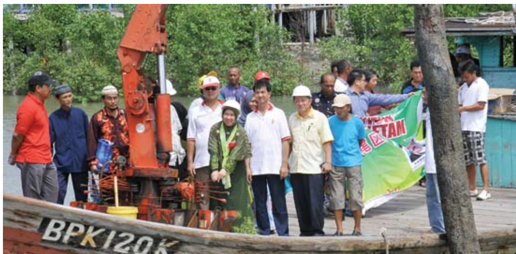
Dr Halimah merasmikan Majlis Pecah Tanah Jambatan Baru, Bagan Teochew di Pulau Ketam

PELABUHAN KLANG - Sebuah jambatan konkrit bernilai RM250 ribu akan dibina dalam waktu terdekat bagi menggantikan jambatan kayu di Bagan Teochew, Pulau Ketam yang musnah dilanggar bot September lalu.