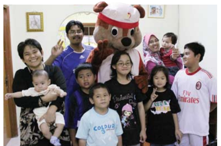
CERIA... Tawas memberi faedah kepada anak-anak Selangor

"Skimsel berjaya mencapai bayaran balik sebanyak 97.02 peratus, manakala Mimbar ialah 83.03 peratus. Kebanyakan pinjaman ini dibayar secara konsisten oleh peserta menggunakan perkhidmatan bank yang disediakan," katanya lagi.