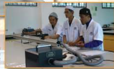
Suasana Pembelajaran di Makmal Sains / Fizik oleh Pelajar Program Fast Track Tahfiz 2011