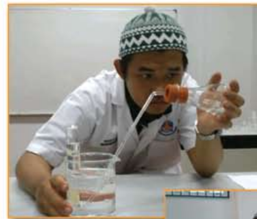
Pelajar Kemasukan 2011 tekun menjalankan ujikaji di Makmal Kimia Unisel.

YAPIS merupakan sebuah yayasan yang ditubuhkan bagi memperkayakan pendidikan Islam bagi pelajar khususnya di negeri Selangor. UNISEL, milik penuh Kerajaan Negeri Selangor menawarkan lebih 86 program akademik di peringkat tahun asas, diploma, sarjana muda, sarjana dan kedoktoran.