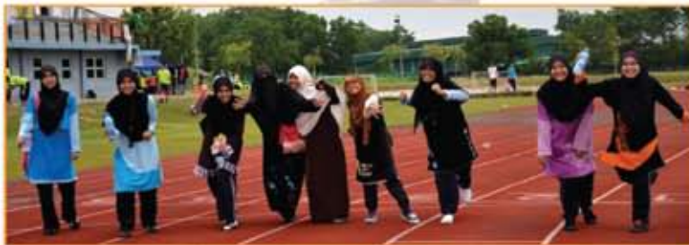
Aktiviti riadah oleh pelajar perempuan Program Fast Track Tahfiz Kemasukan Ulung 2011 di Kompleks Sukan Unisel