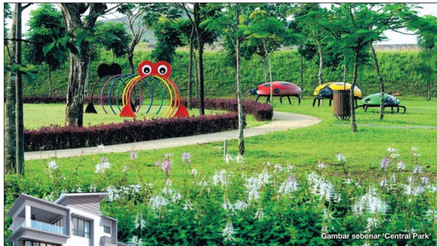
Gambar sebenar 'Central Park'