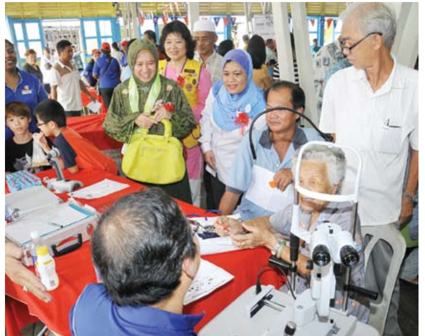
Warga emas ini tidak melepaskan peluang membuat pemeriksaan mata

semua kakitangan memberi komitmen yang baik terhadap program ini," katanya ketika ditemui.