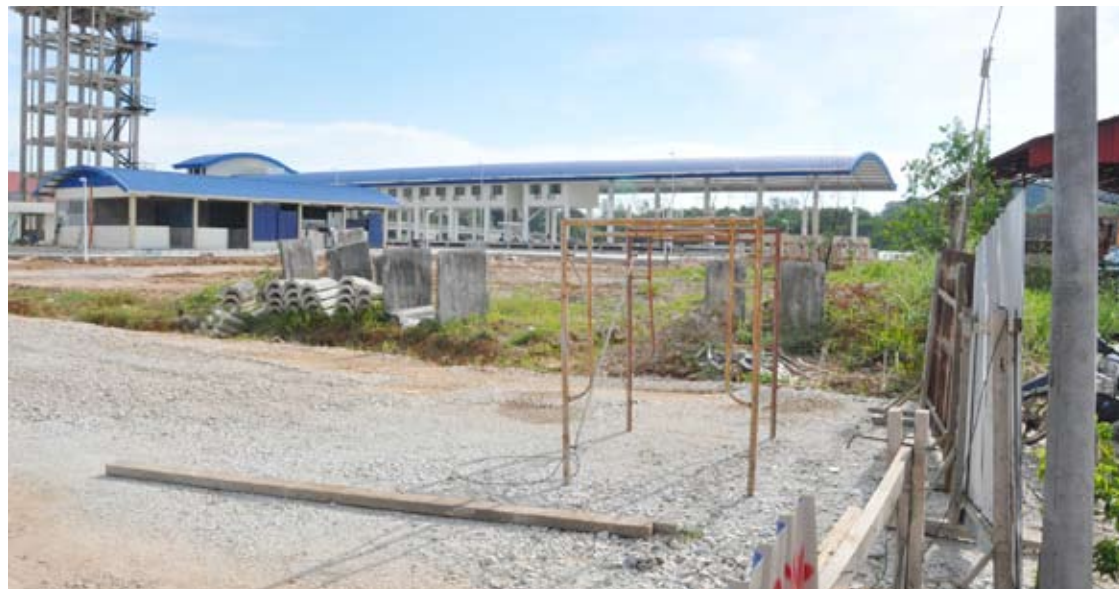
Jeti Lembaga Kemajuan Ikan Malaysia tidak rujuk Kerajaan Negeri