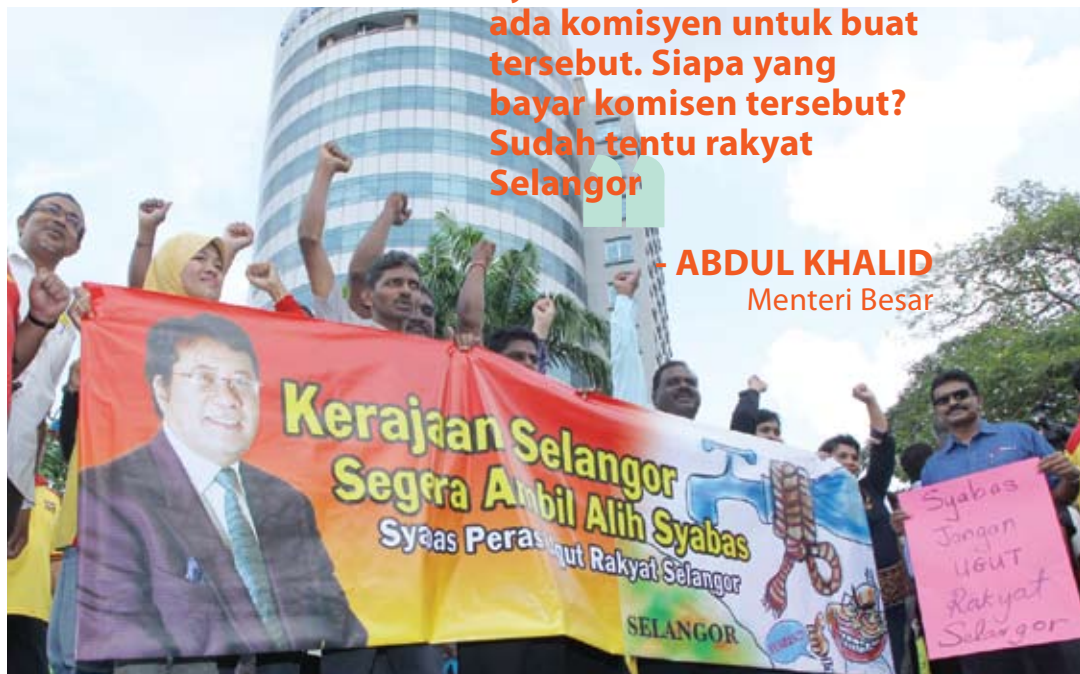
Kerajaan Negeri tidak akan sesekali bertolak ansur dengan sikap berdolak-dalik Syabas

itu pada 2009, 2011, 2012, dan 2014 dengan alasan sedang dalam proses menjalankan menstrukturkan semula pengambilan air.