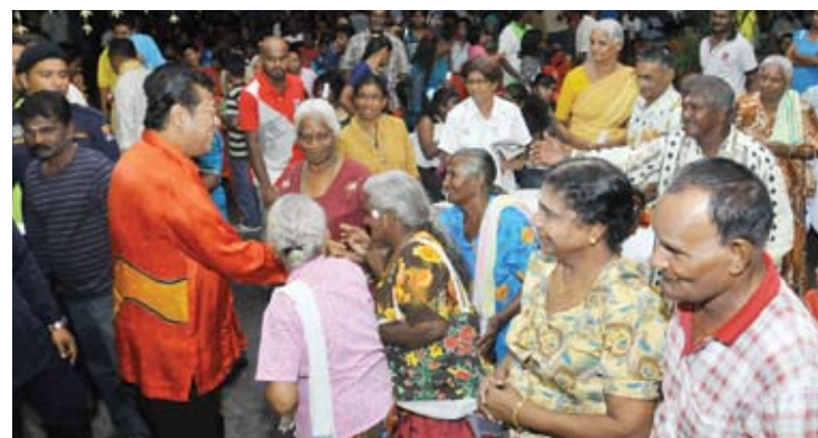
Bawah: Golongan warga emas turut tidak melepaskan peluang beramah mesra dengan Menteri Besar