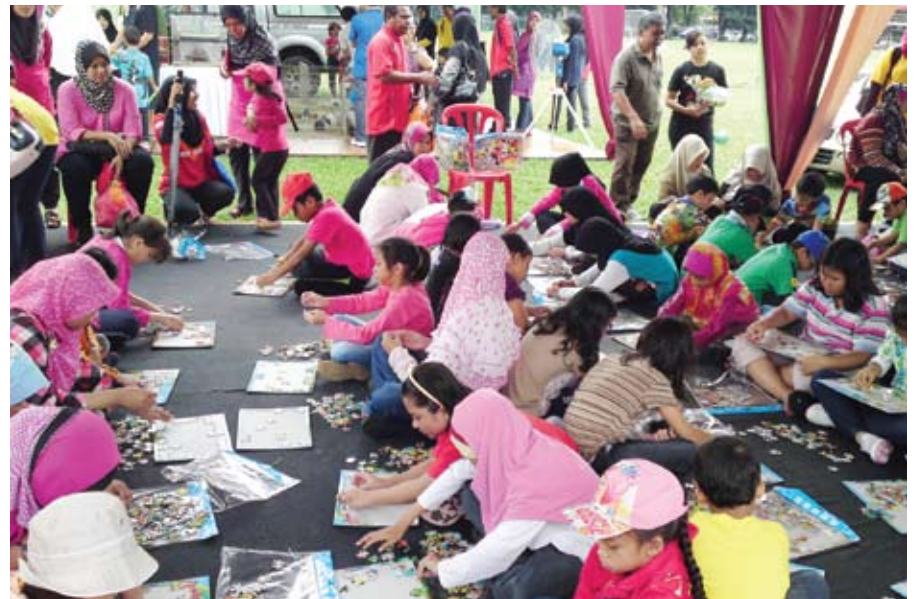
Kanak-kanak ini tekun menyiapkan 'puzzle' sewaktu Hari Keluarga PKNS

Turut hadir Exco Selangor, Teresa Kok dan Ahli-Ahli Lembaga PKNS serta kira-kira 2,000 warga kerja dan keluarga PKNS.