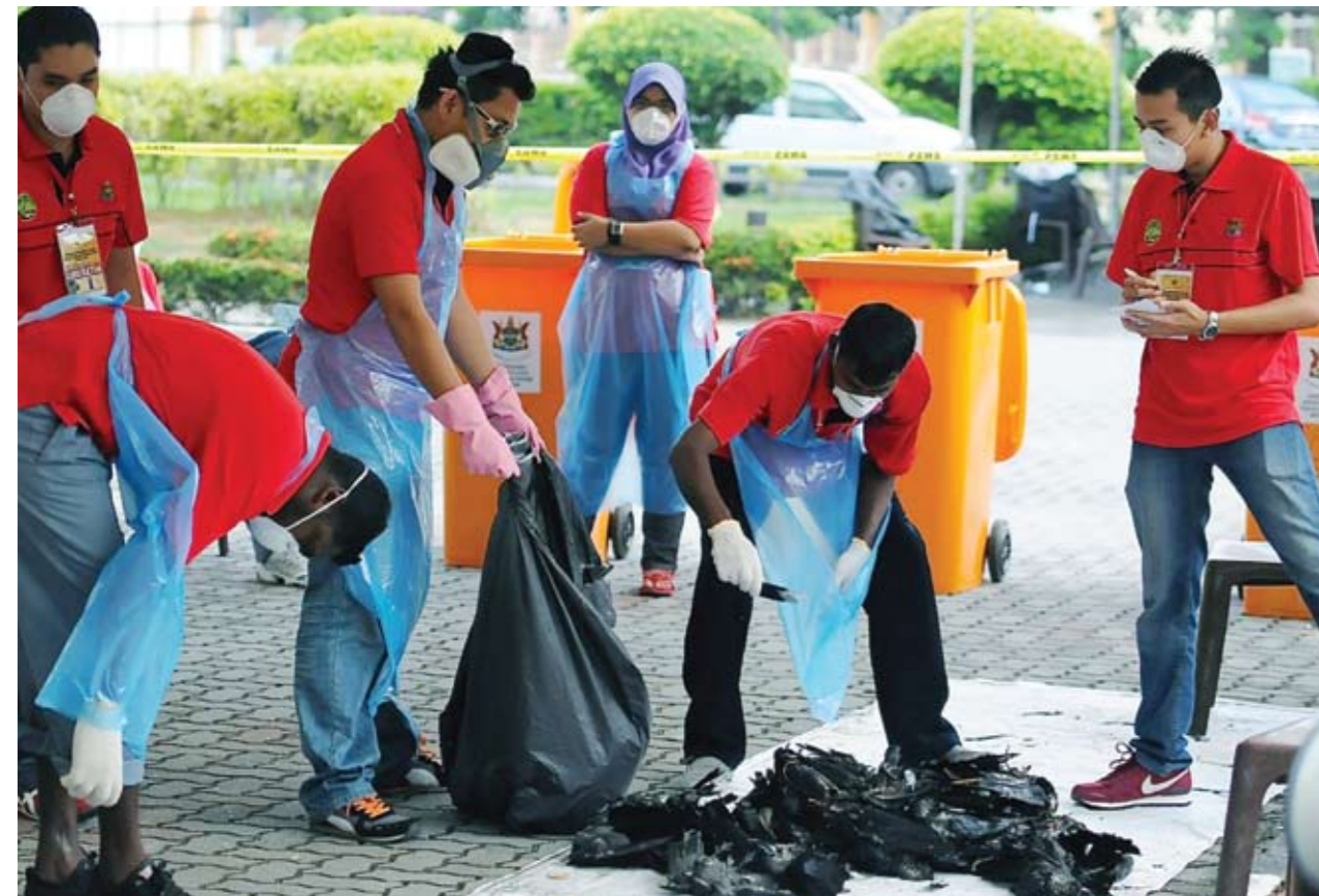
Kakitangan Jabatan Kesihatan sedang mengira gagak yang berjaya ditembak dalam Operas Menembak Gagak, anjuran Majlis Perbandaran Klang (MPK) yang disertai 54 kumpulan penembak. Sebanyak 6,784 gagak berjaya ditembak sekitar Klang