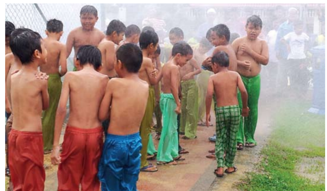
SEJUK.. kanak-kanak ini disiram dengan pili bomba sebelum dikhatankan pada Majlis Berkhatan Beramai-ramai di Taman Batu Tiga