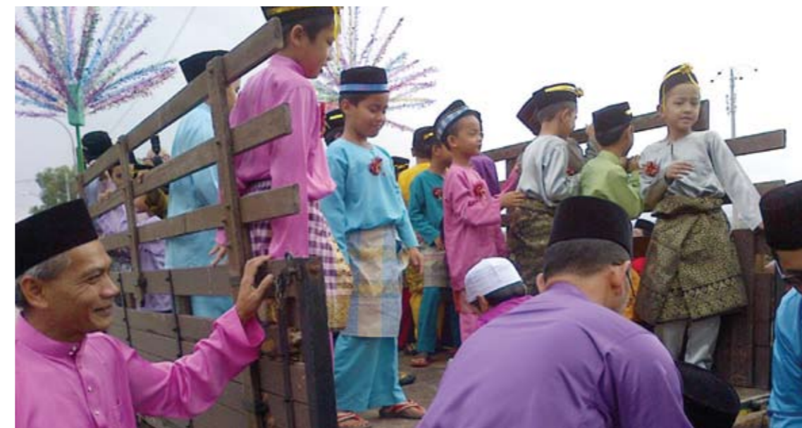
Kanak-kanak di Taman Sutera, Kajang ini dibawa berarak dengan menaiki lori sebelum dikhatankan pada Program Sunathon yang turut dihadiri Ahli Parlimen Serdang, Teo Nie Ching