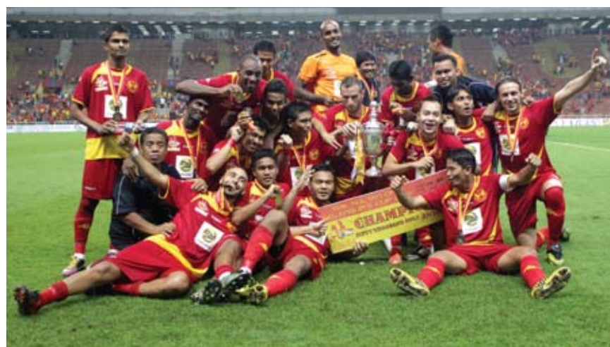
Pasukan bola sepak Selangor bagi musim 2013 bakal berubah wajah

lalu, pasukan Selangor tewas di peringkat separuh akhir kepada pasukan Kelantan.