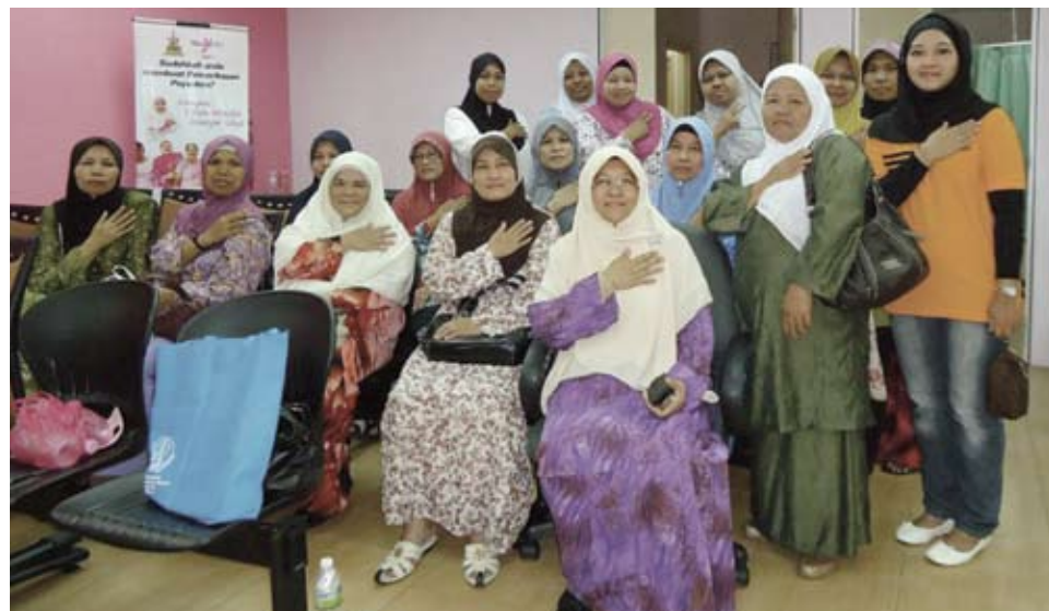
DEKAT DI HATI.... kesedaran tentang pentingnya menjaga kesihatan di kalangan wanita meningkat sejak Skim Kesihatan Wanita diperkenalkan