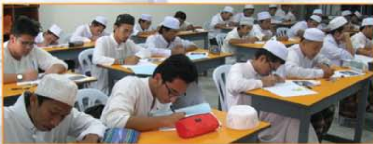
Pelajar Program Fast Track 2011 berada di dalam kelas

Program "Fast-Track" SPM Pelajar Tahfiz ini dijalankan di sebuah penempatan pelajar luar kampus milik UNISEL iaitu di Kota Puteri, Batu Arang. Ia boleh menempatkan sehingga 1000 orang pelajar dalam satu masa.