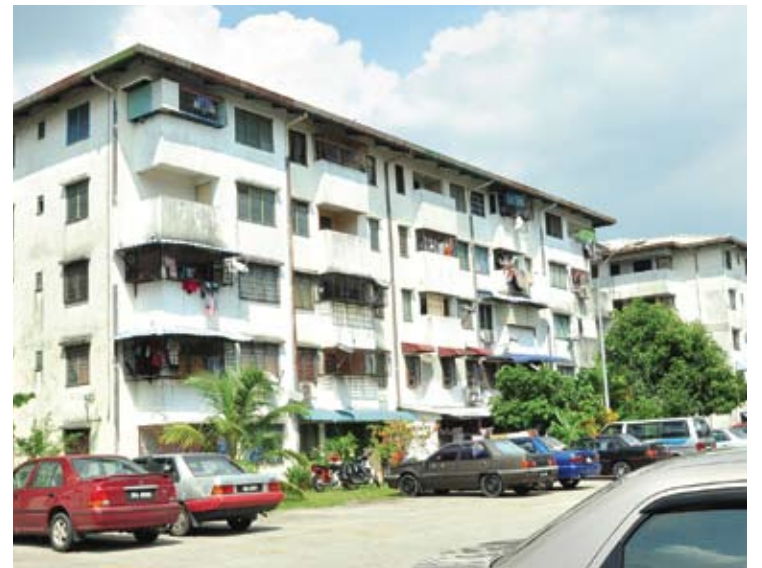
Pemotongan tetap diberikan walaupun permohonan individu

Exco Perumahan, Pengurusan Bangunan dan Setinggan