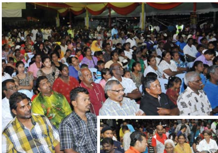
Kiri: Antara orang ramai yang hadir dalam program tersebut