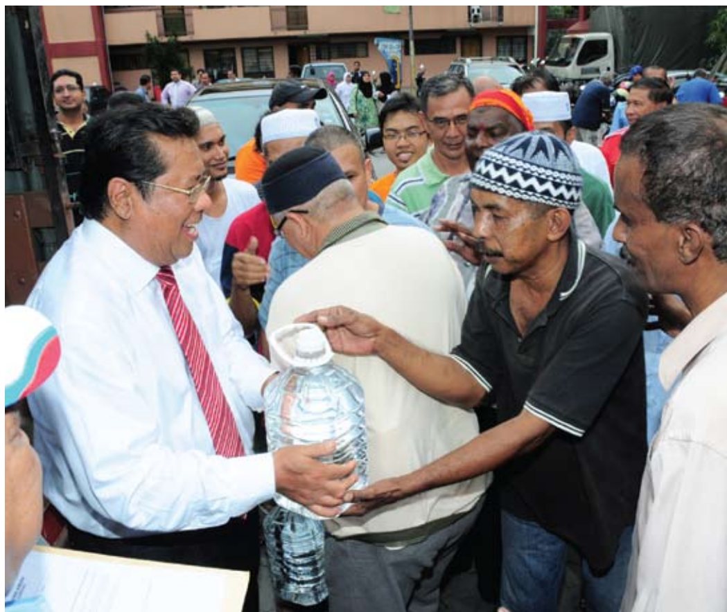
PRIHATIN... Menteri Besar turut sama menyerahkan botol air mineral kepada penduduk di rumah pangsa Sri Melaka

"Sepanjang tahun lalu hanya 18 hari sahaja pam ini beroperasi melebihi 200 juta liter sehari dengan kadar aliran purata pam-pam tersebut adalah 182,204 liter sehari," katanya.