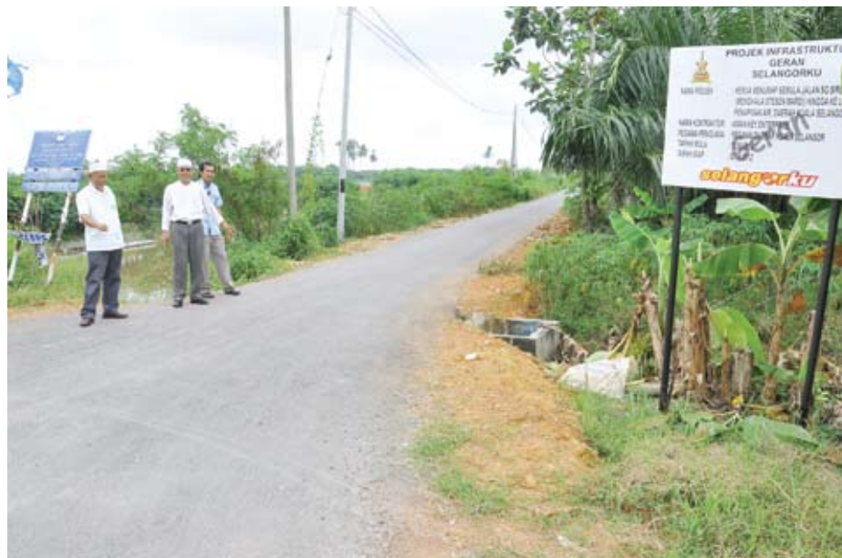
SELESA... Antara jalan yang dinaik taraf menggunakan peruntukan Geran Selangorku

Jalan ini juga sangat penting kepada penduduk di sekitar kerana merupakan laluan 'shortcut' menuju ke pekan