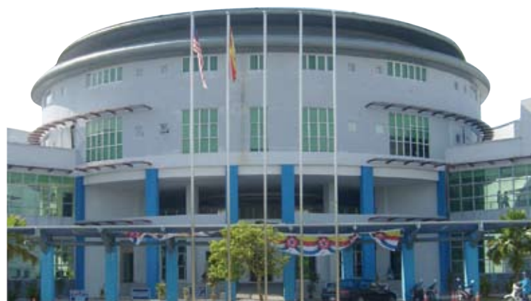
Kampus Induk Unisel di Bestari Jaya

Sebelum ini, kerajaan Selangor menyediakan peruntukan RM20 juta untuk kerja-kerja pembaikan asrama tersebut sekiranya JNSB enggan bertanggungjawab.