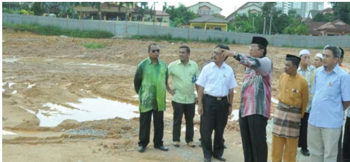
Menteri Besar ketika dibawa melawat tapak sekolah agama di Kampung Sungai Tangkas