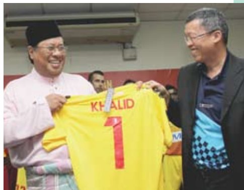
Menteri Besar turut menerima jersi daripada wakil penaja