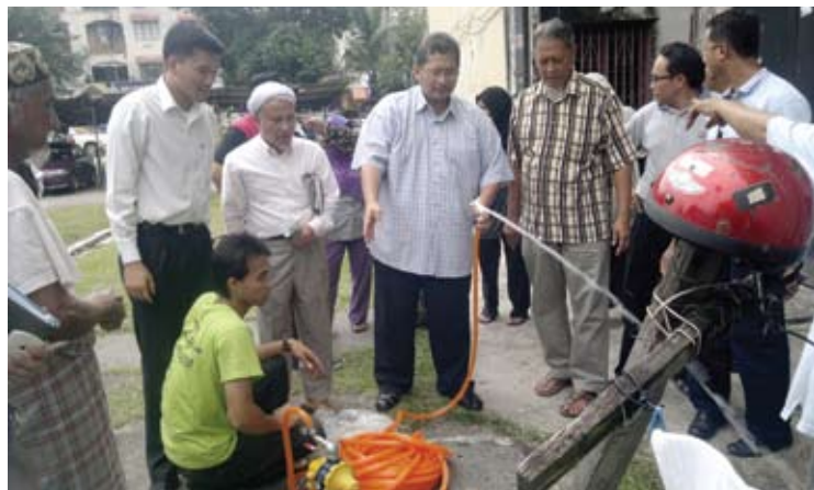
ATASI... Iskandar turun padang meninjau bilik gerakan pam air

Kira-kira 500,000 penduduk di Gombak, Ampang dan Cheras berhadapan gangguan bekalan air selama lebih 10 hari apabila rumah pam Wangsa Maju gagal berfungsi akibat tidak diselenggara Syabas.