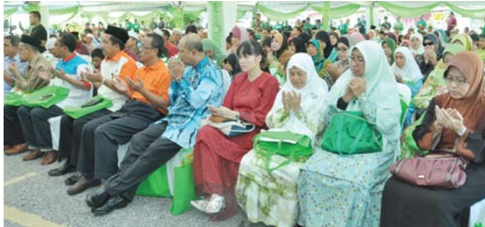
Ahli Parlimen Serdang, Teo Nie Ching (baju merah) bersama sebahagian daripada orang ramai yang hadir pada Majlis Mesra dan Kenduri Kampung