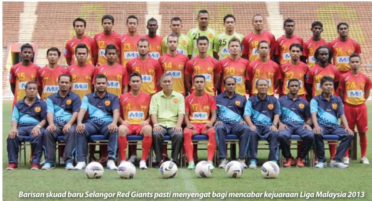
Barisan skuad baru Selangor Red Giants pasti menyengat bagi mencabar kejuaraan Liga Malaysia 2013