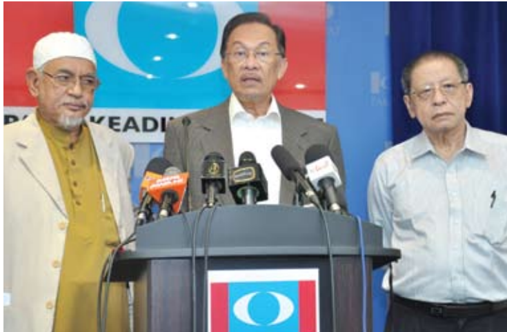
Pakatan Rakyat desak PM siasat pampasan RM207 juta pemberian kerajaan Jepun

PETALING JAYA - Pakatan Rakyat (PR) mendesak Datuk Seri Najib Razak menubuhkan satu suruhanjaya bebas bagi menyasat pampasan 'wang darah' berjumlah RM207 bilion daripada kerajaan Jepun kepada rakyat Malaysia.