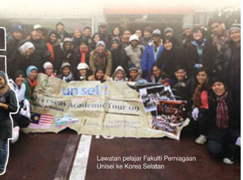
Lawatan pelajar Fakulti Perniagaan Unisel ke Korea Selatan