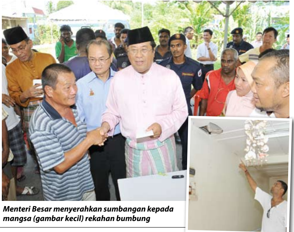
Menteri Besar menyerahkan sumbangan kepada mangsa (gambar kecil) rekahan bumbung

"Kemudian jiran pun beritahu dia juga nampak pasir ketika sedang menyapu," katanya yang menetap di sini hampir 20 tahun.