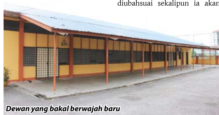
Dewan yang bakal berwajah baru

"Kedudukan di sebelah masjid juga amat sesuai untuk diadakan majlis berkaitan agama," akhiri Setiausaha Kerja Masjid Nurul Hidayah Kampung Pandan itu.