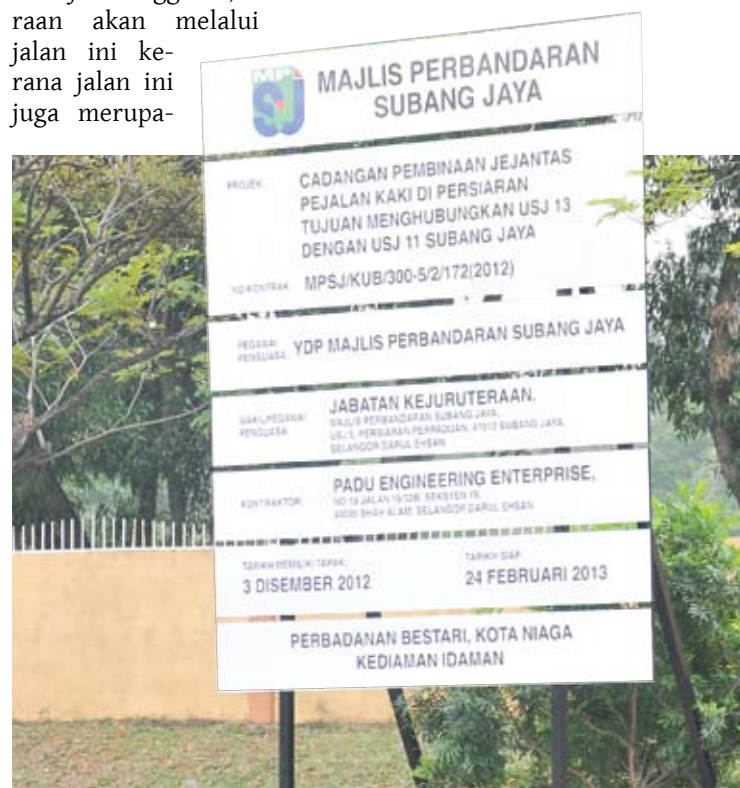
Papan kenyataan tentang cadangan membina jejantas

"Kita rasa gembira dengan kemudahan diberikan dan masalah dihadapi juga berjaya di atasi," katanya.