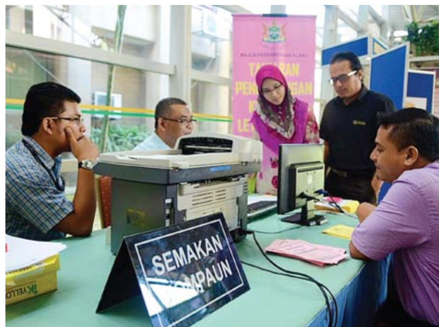
Orang ramai mengambil peluang mendapatkan kupon yang ditawarkan MPK

SHAH ALAM - Majlis Perbandaran Klang (MPK) membuat tawaran pengurangan kompaun letak kereta RM15.00 bagi setiap kompaun letak kereta bermula 1 Februari sehingga 28 Februari dan jumlahnya akan meningkat kepada RM30.00 bagi setiap kompaun bermula 1 Mac sehingga 31 Mac 2013.