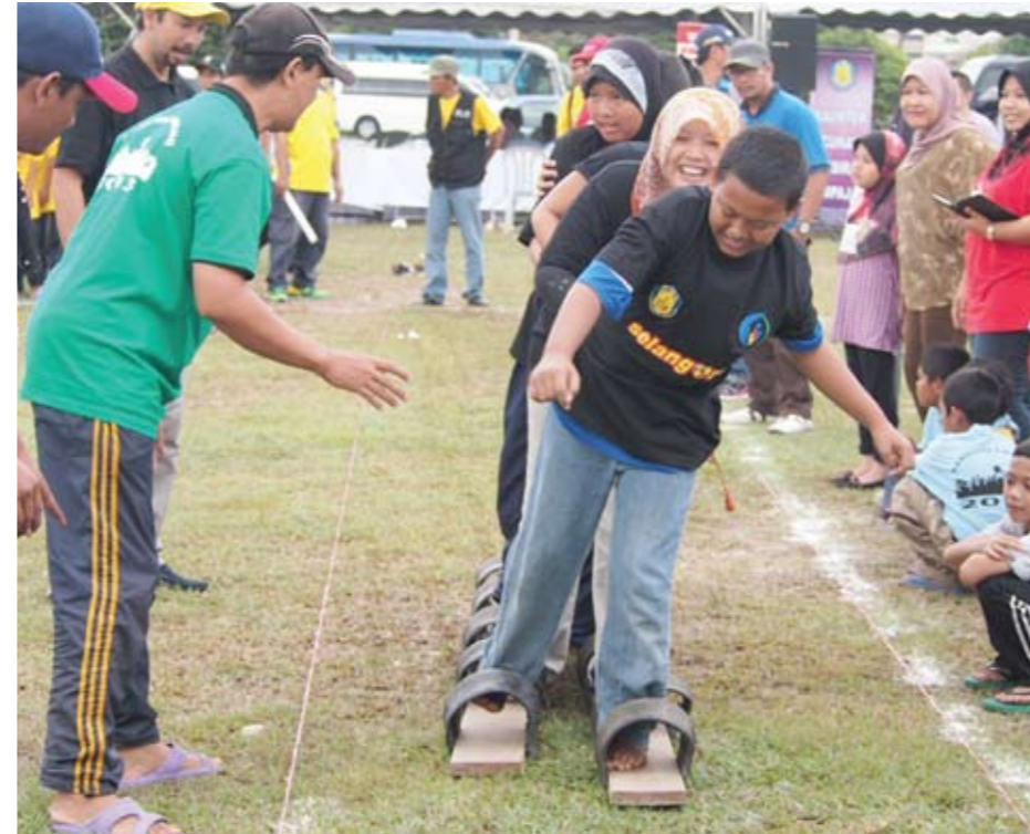
▶ PANTAS... kanak-kanak ini bersemangat menghayun langkah menggunakan kasut gergasi untuk menuju ke garisan penamat sewaktu Program Sukaneka Rakyat Ampang