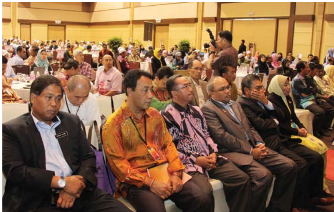
Sebahagian daripada penjawat awam dan peserta bengkel yang hadir

Bengkel sehari itu disertai kira-kira 500 peserta daripada PBT, Ketua Kampung, Ahli Jawatankuasa Kerja Penduduk dan pegawai PTGS.