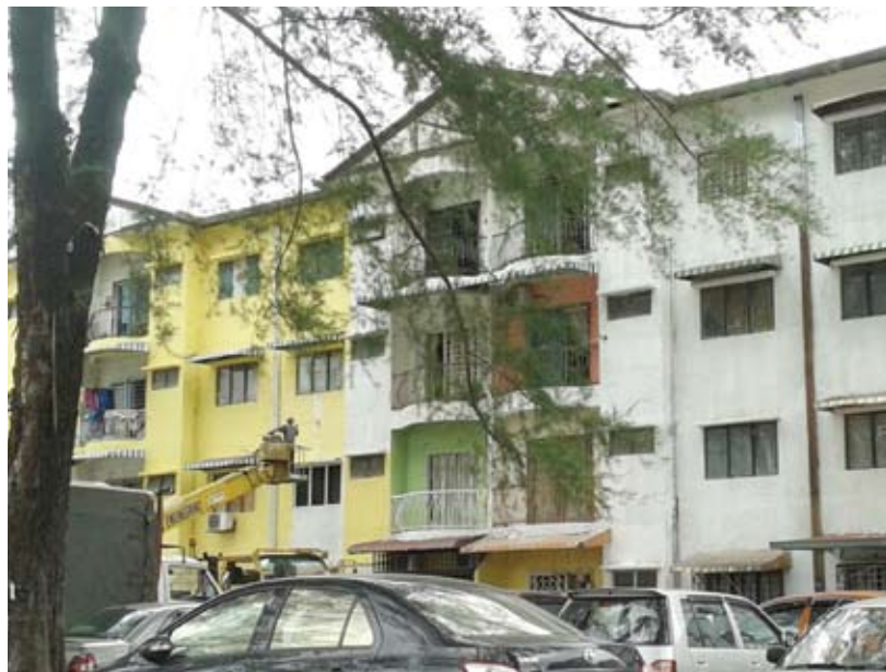
Rumah flat yang dicat tanpa persetujuan penduduk

PETALING JAYA - Pemimpin Umno-BN dibidas kerana melaksanakan kerja-kerja mengecat Rumah Flat di Medan Maju Jaya tanpa persetujuan Jawatankuasa Penduduk di situ.