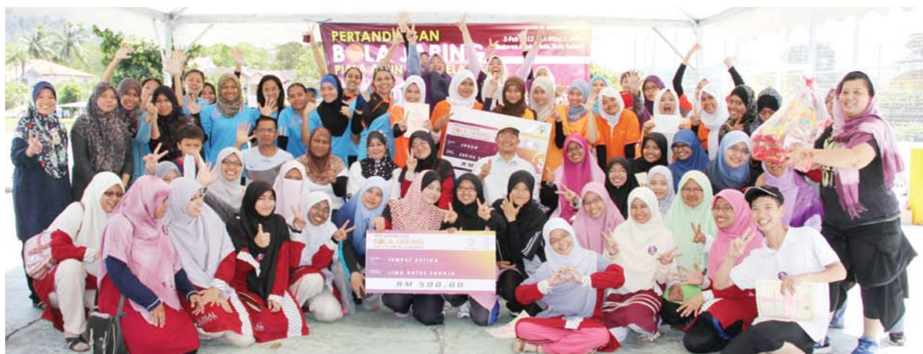
▶ Pusat Khidmat Masyarakat DUN Hulu Kelang dengan kerjasama Nisa Gombak, menganjurkan Pertandingan Bola Jaring Piala ADUN Hulu Kelang yang diadakan di Dataran Anak Muda, Jalan H1, Taman Melawati. Dalam pertandingan tersebut, Kumpulan Dodgers menjadi juara pertandingan