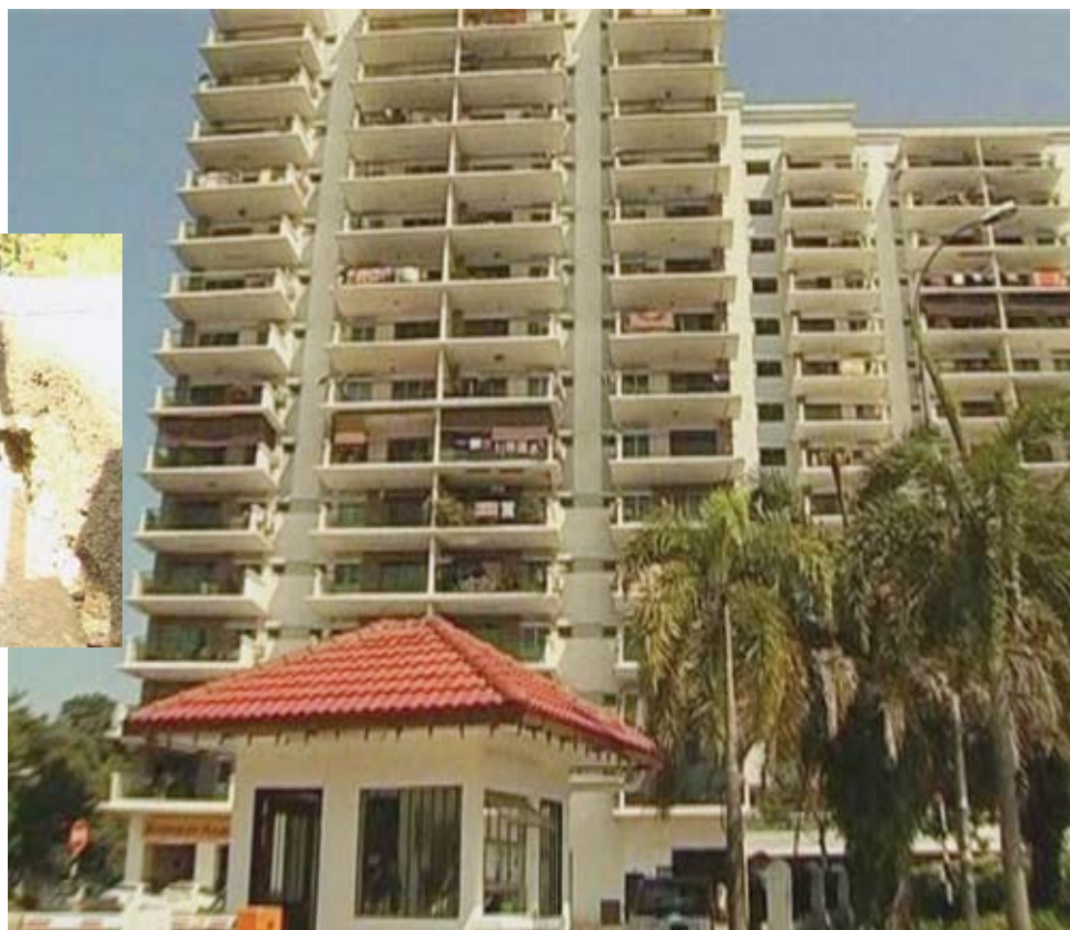
Rekahan serius di Pangsapuri Indahria terus menimbulkan kebimbangan penduduk Gambar kecil: Rekahan

terus mendiami pangsapuri tersebut hanya akan diputuskan oleh Datuk Bandar Shah Alam.