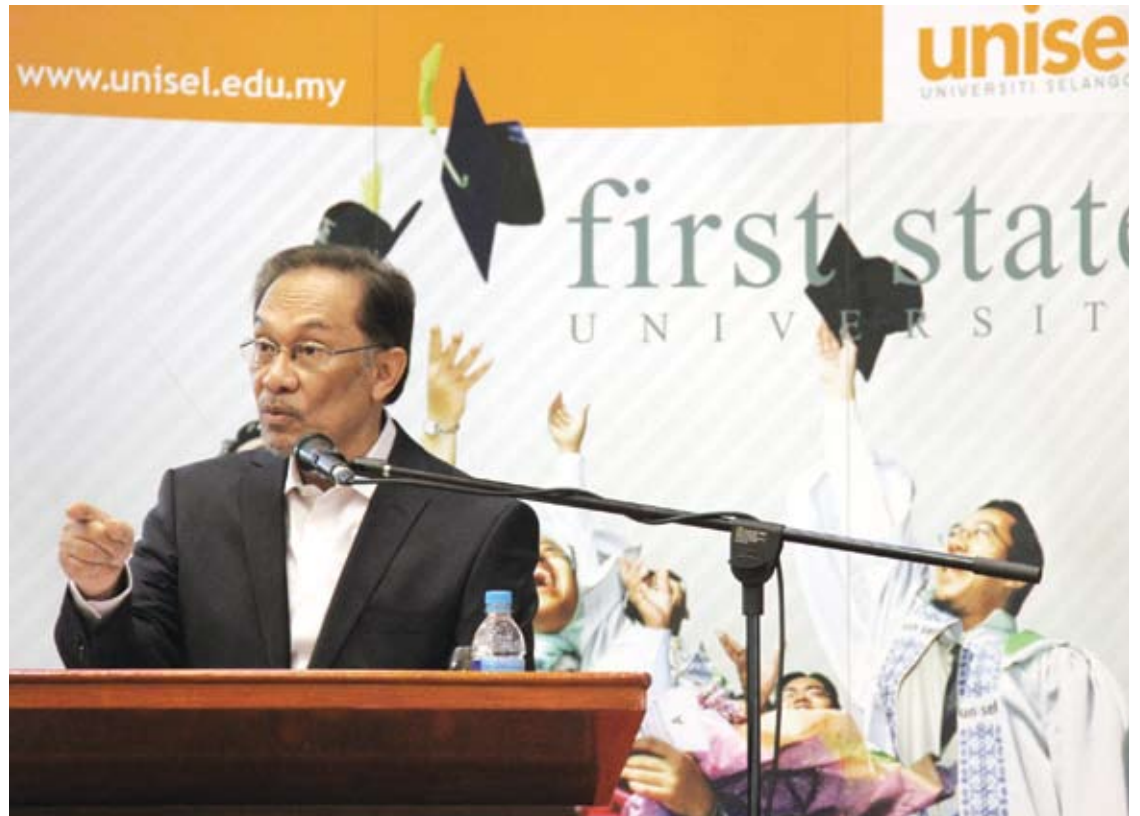
Datuk Seri Anwar Ibrahim menyampaikan ucapannya semasa Konvensyen Antarabangsa Pendidikan yang diadakan di Universiti Selangor

Dalam konvensyen yang dirasmikan Menteri Besar, Tan Sri Abdul Khalid Ibrahim itu, turut menampilkan pembentang kertas kerja dalam dan luar negara.