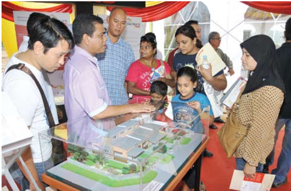
Wakil PKNS beri penerangan tentang ciri-ciri Rumah Mampu Milik kepada pengunjung