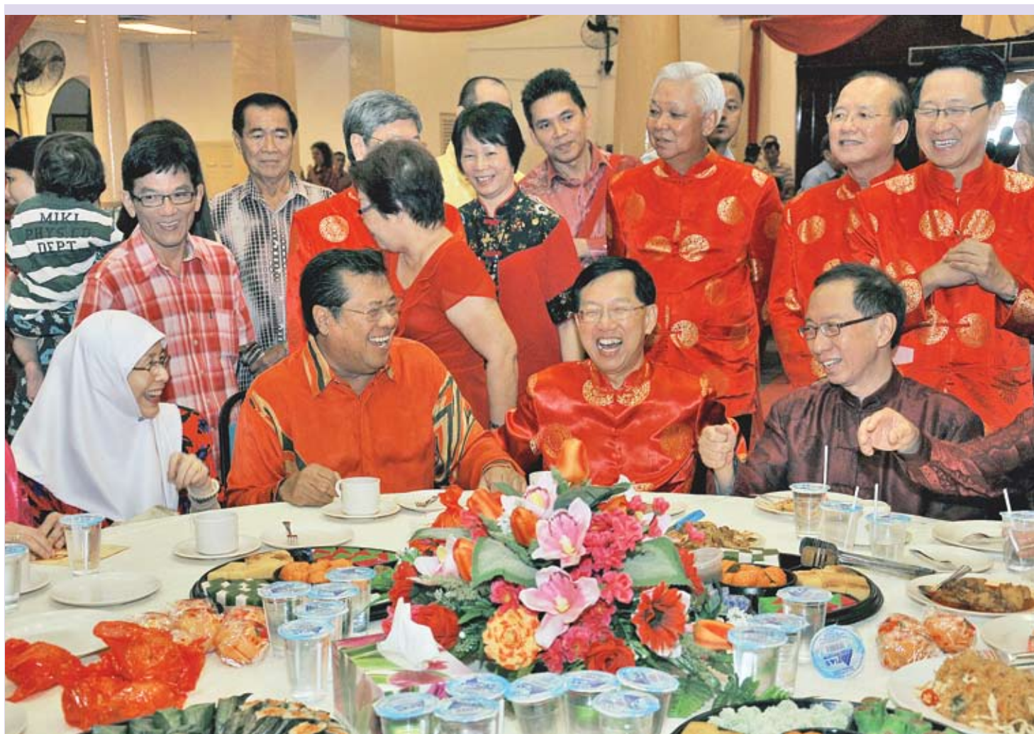
TOLERANSI... Menteri Besar, Tan Sri Abdul Khalid Ibrahim beramah mesra dengan pemimpin masyarakat Cina pada majlis Sambutan Tahun Baru Cina yang diadakan di Dewan Perhimpunan Cina Kuala Lumpur dan Selangor