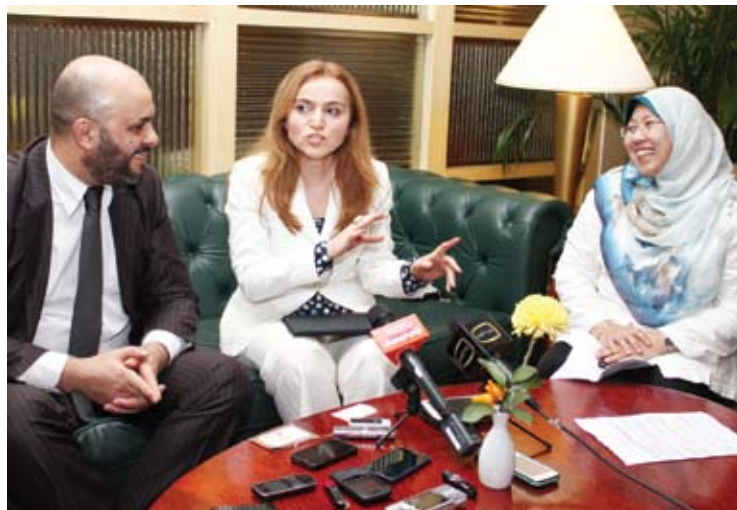
Kerajaan pusat digesa membenarkan pemantau antarabangsa dalam Pilihan Raya Umum ke-13

Difahamkan seramai lima anggota Tentera Laut Diraja Malaysia (TLDM) dan seorang anggota tentera darat bakal berhadapan tindakan berkeenaan.