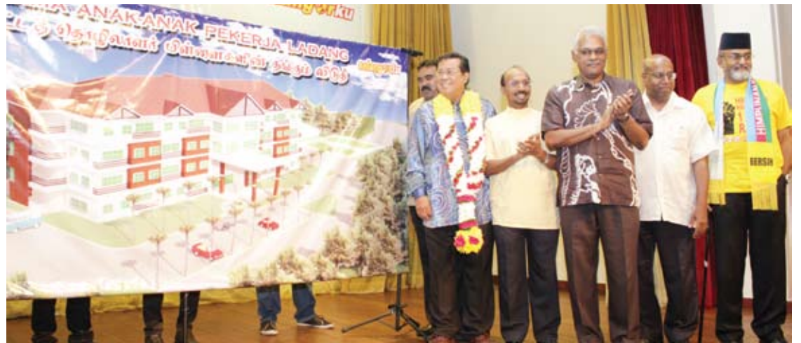
Menteri Besar melihat banner bangunan asrama yang bakal dibina

Tambahnya, Pakatan Rakyat (PR) benar-benar berhasrat untuk menolong masyarakat ladang agar berjaya dalam bidang pelajaran dan bebas dari-