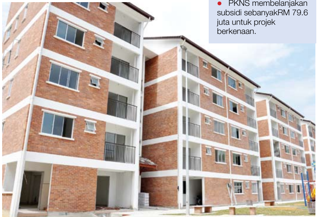
TERSERGAM...Rumah Mampu Milik Sungai Long yang akan siap tidak lama lagi