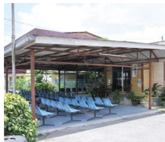
Ruang menunggu yang panas