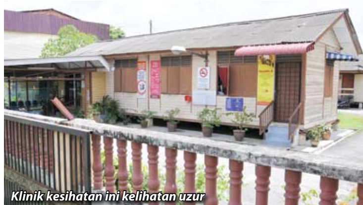
Klinik kesihatan ini kelihatan uzur