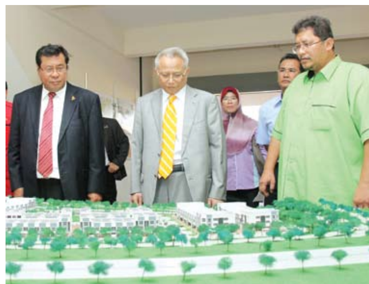
Menteri Besar melihat model Rumah Mampu Milik ke-4

projek ini adalah sebahagian daripada perancangan 20 tahun PKNS untuk membina sebanyak 31,000 unit RMM di negeri ini.