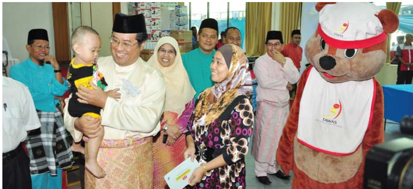
PRIHATIN... Kerajaan Negeri sentiasa menjaga kebajikan anak-anak Selangor sejak dari awal kelahiran

Sehingga Februari 2013 Kerajaan Negeri berjaya mencapai sasaran lebih 60,000 penyertaan rakyat Selangor dalam program ini.