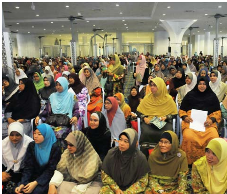
Peserta kursus memenuhi dewan Masjid Negeri Kiri: Menteri Besar membaca cenderahati yang diterima daripada Jais