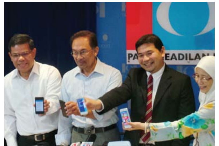
Pimpinan PKR sewaktu melancarkan sistem aplikasi gabungan telefon pintar (smartphone) sempena PRU-13

PETALING JAYA - PKR menggerakkan satu lagi 'senjata' terkininya sempena Pilihan Raya Umum Ke-13 (PRU13) dengan pelancaran sistem aplikasi gabungan telefon pintar (smartphone) dengan media sosial seperti Facebook dan Twitter.