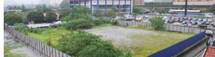
Tapak Datum Jelatek yang menjadi pertikaian orang luar

Sebaliknya penduduk Melayu yang menjual unit pangsapuri mereka kepada PKNS untuk projek itu menerima keuntungan berlipat kali ganda apabila dibayar RM300,000. Sebaliknya harga asal pangsapuri kos rendah mereka hanya sekitar RM20,000.