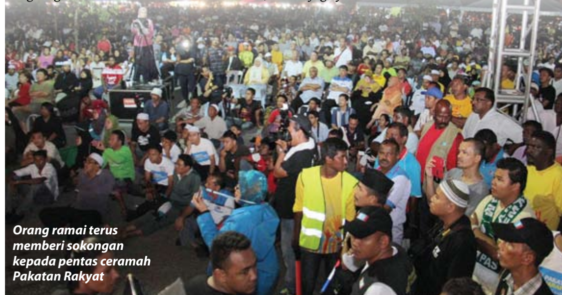
Orang ramai terus memberi sokongan kepada pentas ceramah Pakatan Rakyat

Sementara itu, Anwar berharap aplikasi ini dapat dimanfaatkan dan menjadi satu persaingan yang hebat dan adil dengan memberikan pilihan kepada rakyat untuk mendengar hujah dan menilai pandangan yang diberikan.