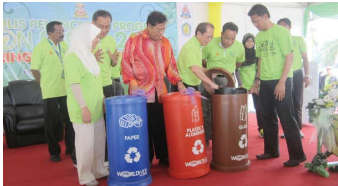
Menteri Besar menyerahkan tong sampah sumbangan Worldwide kepada PBT