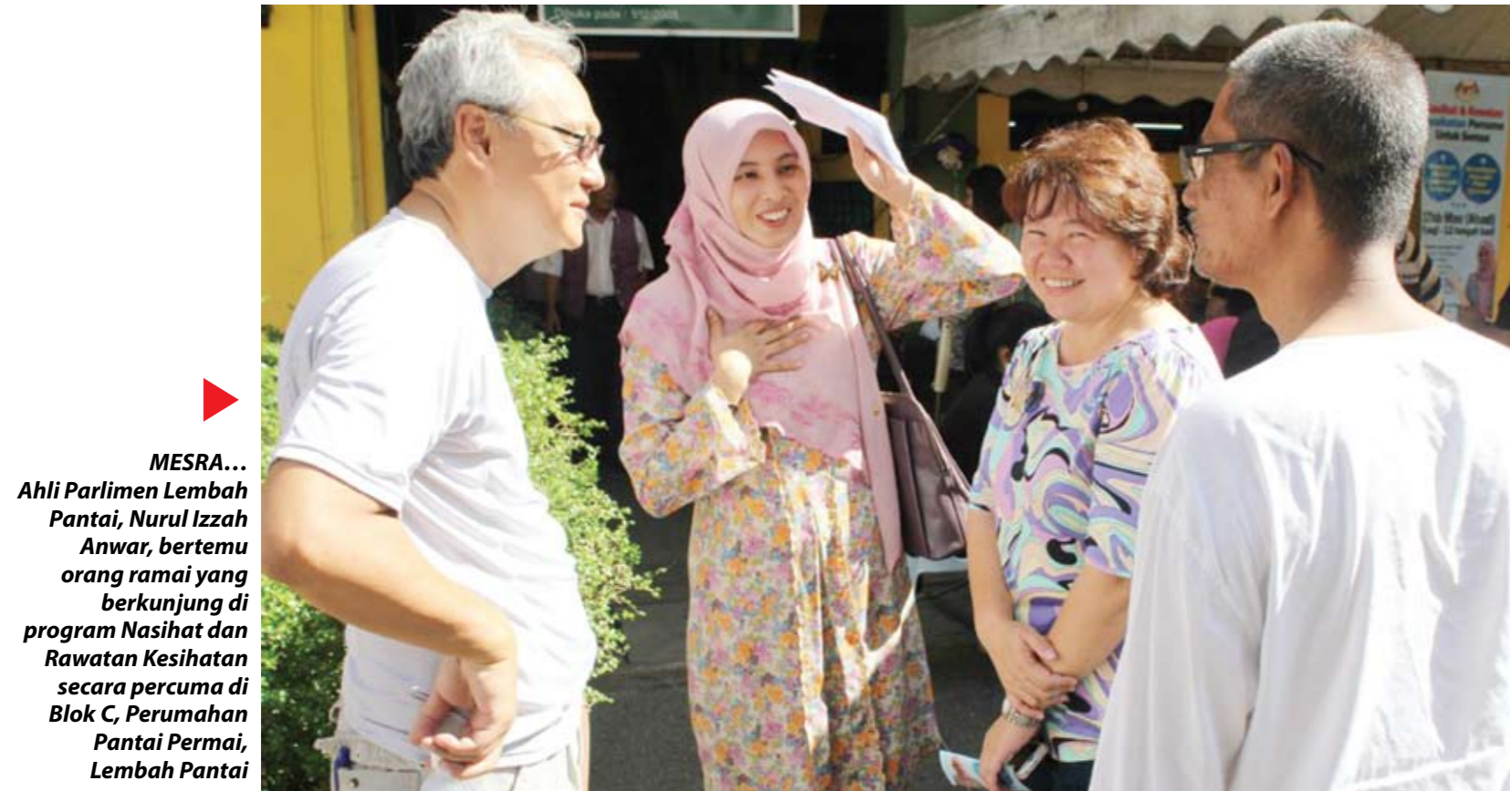
▶ MESRA... Ahli Parlimen Lembah Pantai, Nurul Izzah Anwar, bertemu orang ramai yang berkunjung di program Nasihat dan Rawatan Kesihatan secara percuma di Blok C, Perumahan Pantai Permai, Lembah Pantai