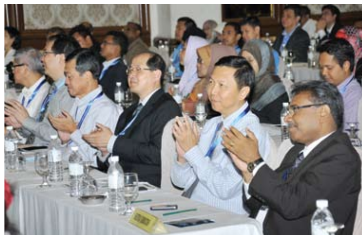
Peserta seminar puas hati dengan maklumat Rumah Mampu Milik

“Kita akan buka satu pangkalan data dan layak mendaftar online untuk makluman orang awam berkaitan konsep rumah mampu milik ini,” ujarnya lagi.