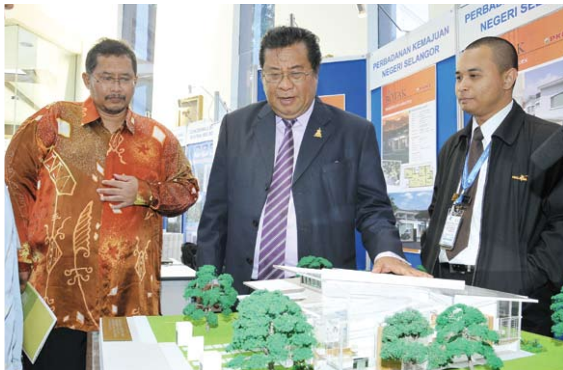
Menteri Besar melihat model rumah pasang siap yang mana tempoh pembinaannya lebih singkat