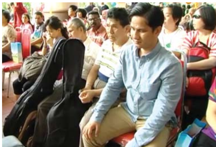
Kerajaan negeri akan memastikan golongan OKU turut mendapat faedah dari pembangunan ekonomi negeri