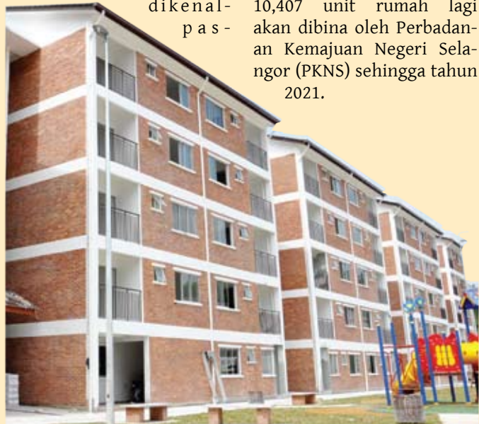
Rumah Mampu Milik hanya untuk golongan yang benar-benar layak bagi mengelak individu memiliki lebih daripada sebuah

Dianggarkan sebanyak 10,407 unit rumah lagi akan dibina oleh Perbadanan Kemajuan Negeri Selangor (PKNS) sehingga tahun 2021.