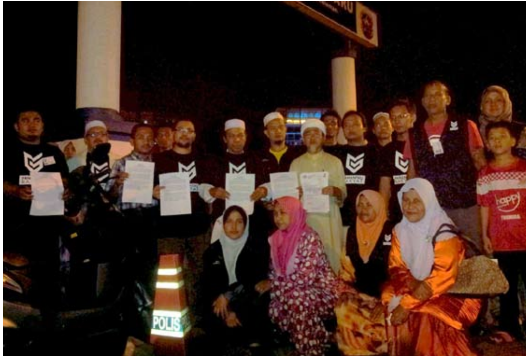
Aktivis pemantau pilihan raya Kelantan yang menunjukkan laporan polis terhadap salahlaku menggunakan jentera kerajaan dengan memburukkan Pakatan Rakyat

"Suatu yang amat menjijikkan dalam sistem demokrasi bilamana mereka yang terlibat mengendalikan pilihan raya umum terlibat langsung dengan kempen politik dan dipaksa mengundi parti tersebut," tegasnya.