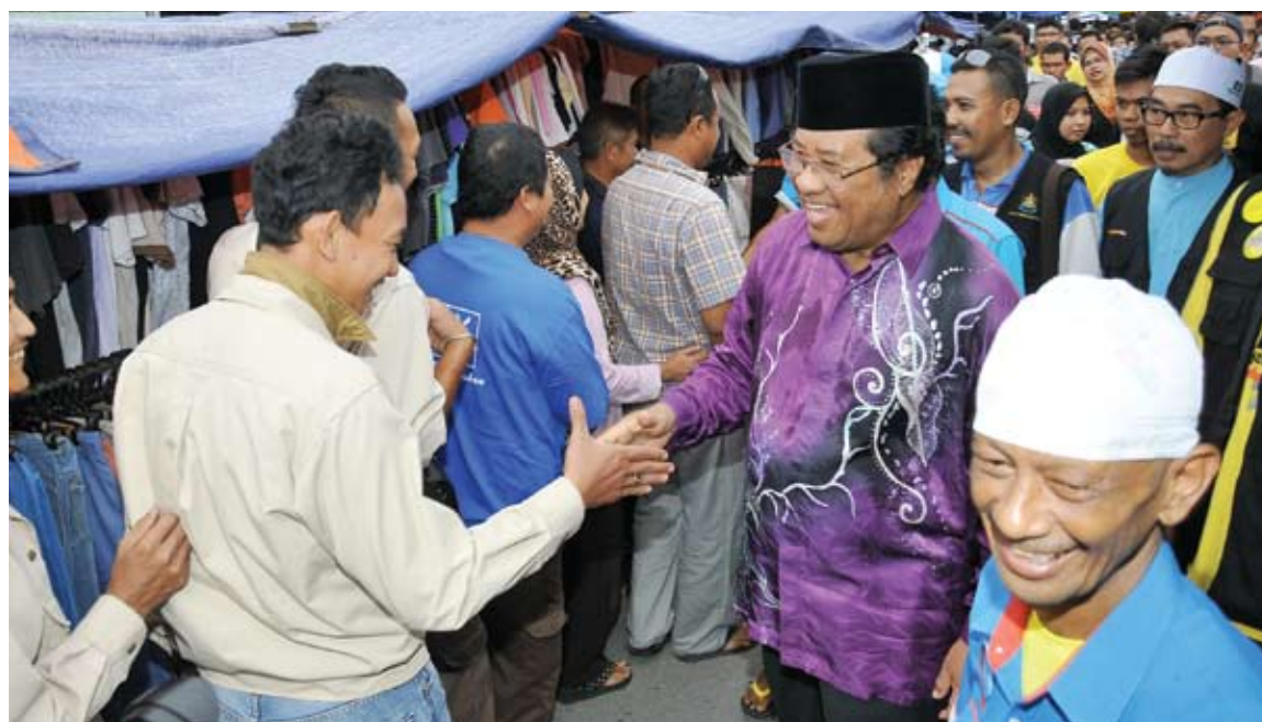
Bekas Menteri Besar Selangor, bertemu dan beramah mesra dengan pengunjung dan peniaga di pasar malam Pulau Indah

Jelasnya, inisiatif itu akan dilaksanakan berikutan beliau banyak menerima aduan berhubung masalah pengangkutan di kawasan itu.