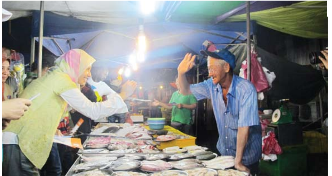
▲ Nurul Izzah, calon Parlimen Lembah Pantai, bersama para petugas, meninjau Pasar Malam Bangsar Baru dan bertanyakan permasalahan para penjaja di kawasan tersebut