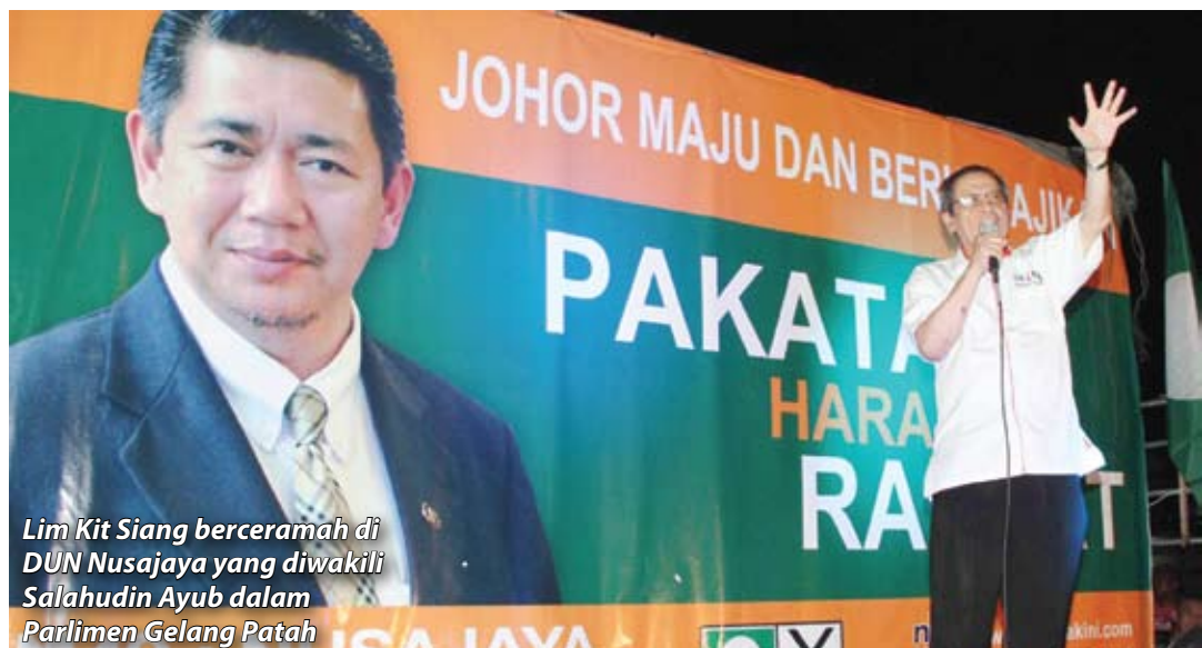
Lim Kit Siang berceramah di DUN Nusajaya yang diwakili Salahudin Ayub dalam Parlimen Gelang Patah

"Saya harap rakyat Malaysia, terutamanya orang Melayu, tidak mudah terpengaruh dengan fitnah dan pembohongan, sama ada yang disebarkan melalui internet atau melalui ceramah. Fitnah amat berbahaya kerana ia boleh menimbulkan ketegangan