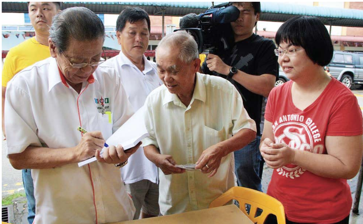
Kit Siang melayani pengundi warga emas di Gelang Patah

LIM KIT SIANG Calon Pakatan Rakyat Parlimen Gelang Patah