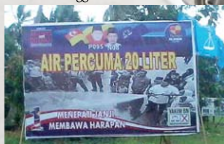
Melawat pengundi di kawasan Kampung Bagan Pasir, Tanjung Karang

Tinjauan semula ke billboard yang dipasang di tepi jalan utama Tanjung Karang ke Sabak Bernam itu telah ditanggalkan.