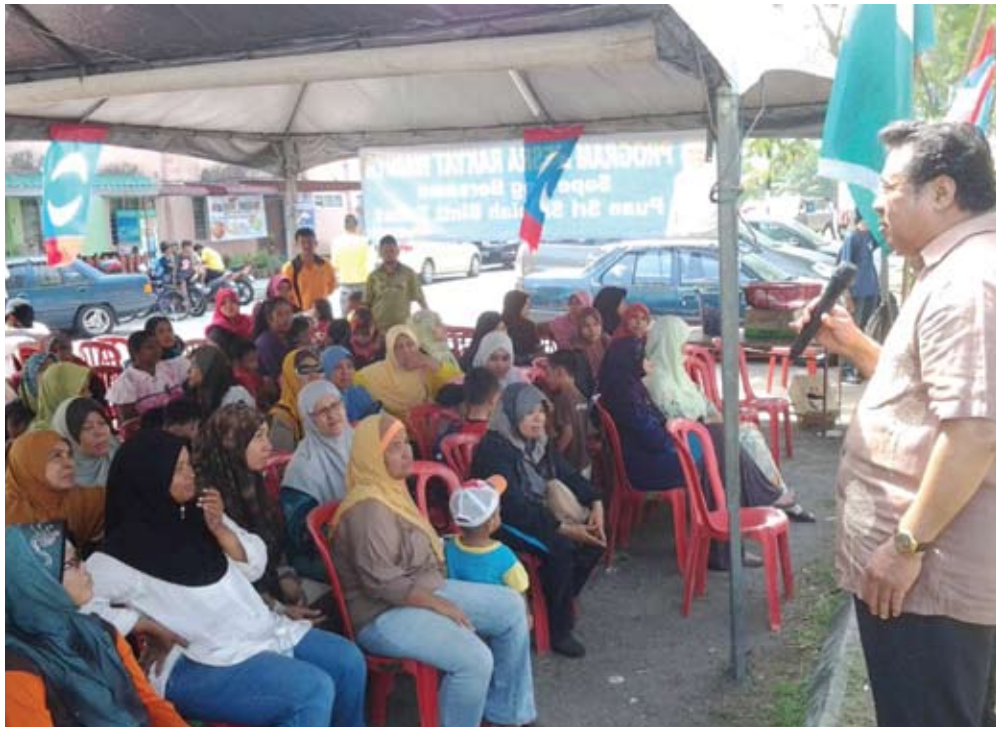
Menteri Besar meluangkan masa memberi penerangan pada Program Mesra Wanita Armada Putra di Pulau Indah

SHAH ALAM - Tindakan Perdana Menteri, Datuk Seri Najib Razak yang sering mengeluarkan kenyataan berbeza-beza mengikut masa dan kumpulan masyarakat dalam siri kempen pilihan raya, tidak ubah seperti 'sesumpah politik'.