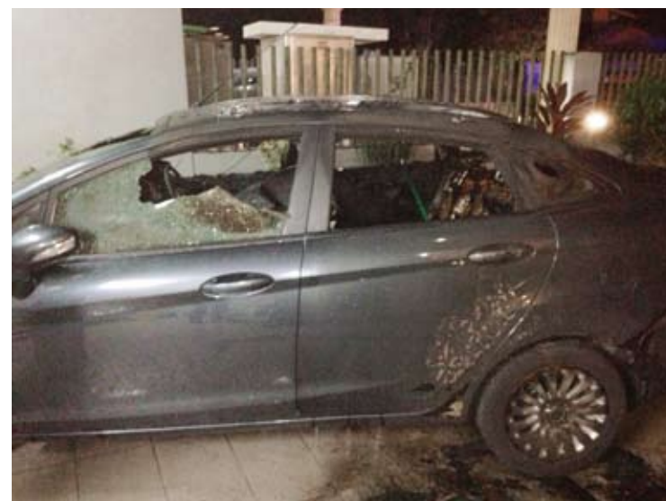
Keadaan kereta milik Sangheta yang diparkir di halaman rumah musnah terbakar

"Tindakan ganas ini menjadikan keluarga saya trauma. Tetapi walaupun berlaku kejadian ini, ia tidak akan membakar semangat kami untuk memperjuangkan dasar-dasar Pakatan Rakyat (PR)," katanya.