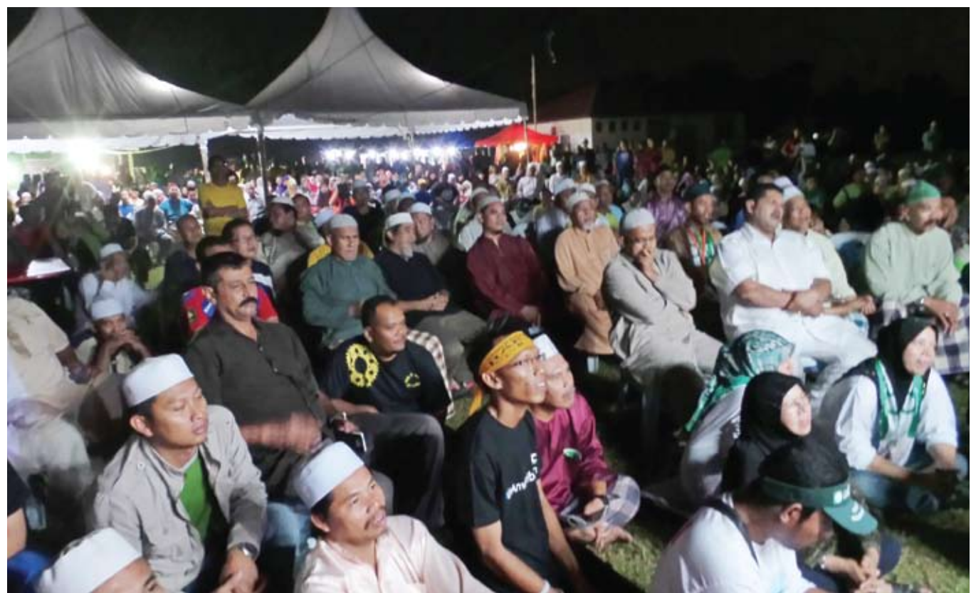
Orang ramai memenuhi Padang Bola Sepak Bukit Kuching, Hilir Jeram, Kuala Selangor bagi mendengar amanat Mat Taib