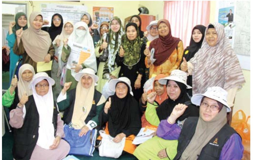
▲ BERSEMANGAT... perayu-perayu undi wanita Hulu Kelang berganding bahu menjalankan tugas mereka menyakinkan pengundi-pengundi bagi membantu kemenangan Pakatan Rakyat di DUN tersebut, seterusnya menawan Putrajaya