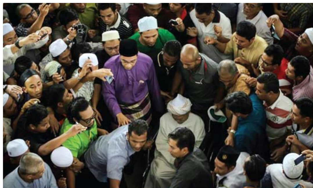
Para jemaah di Masjid Besi, Putrajaya mengerumuni Mursyidul Am PAS, Datuk Nik Abdul Aziz Nik Mat

Dalam pilihan raya kali ini, Tok Guru Nik Aziz memper tahankan kerusinya di Chem-paka, Pengkalan Chepa.