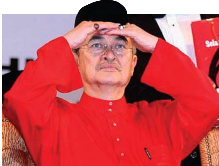
Islam Hadhari berkubur bersama-sama karier politik Pak Lah

Islam Hadhari adalah slogan Pak Lah ketika menjadi Perdana Menteri sebelum ditukarkan kepada 1Malaysia di bawah Najib setelah beliau