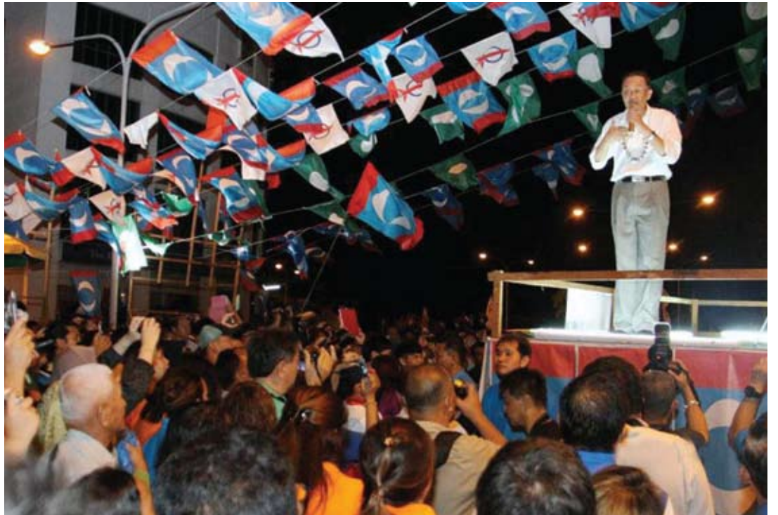
Ribuan rakyat hadir mendengar ceramah Anwar di Miri, Sarawak

Dilaporkan pada 25 April lalu SPR berkata penghantaran logistik seperti peti undi dan peralatan lain adalah bagi memenuhi keperluan pusat pengundian untuk memastikan pelancaran hari pengundian nanti.