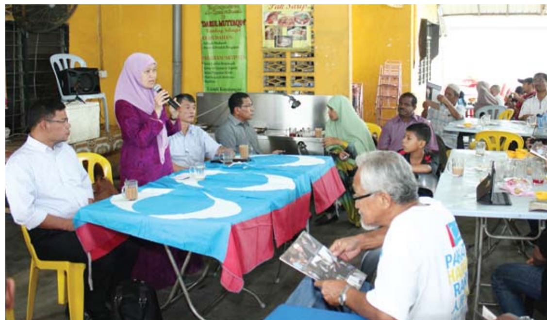
Tengku Maraziyah, sewaktu program ceramah kelompok di DUN Kuang

"Selangor akan kekal bersama PR dan kita juga akan mengambil alih pentadbiran negara selepas 5 Mei ini," ujarnya yakin.