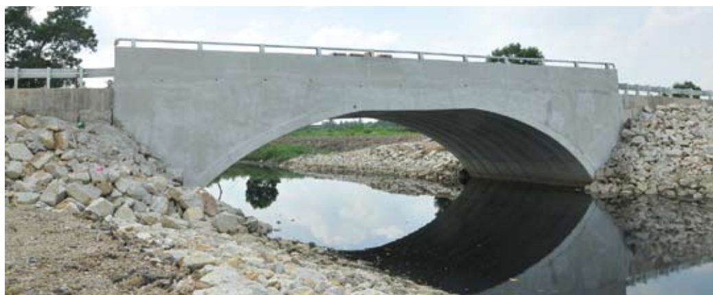
Jambatan Kampung Delek yang sudah siap dibina.