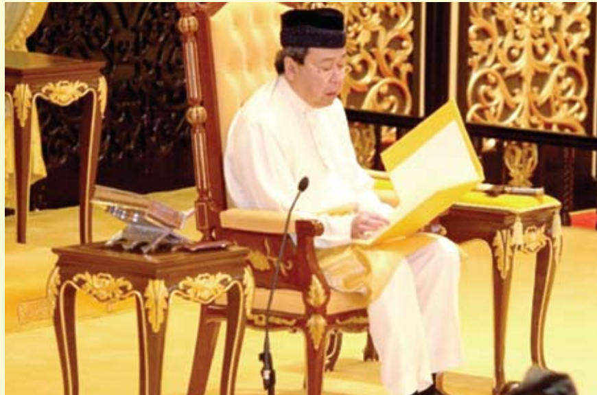
Sultan Selangor bertitah ketika menyampaikan watikah pelantikan Exco Kerajaan Negeri Selangor

"Setiap tanggungjawab yang bakal dipikul hendaklah dikendalikan secara