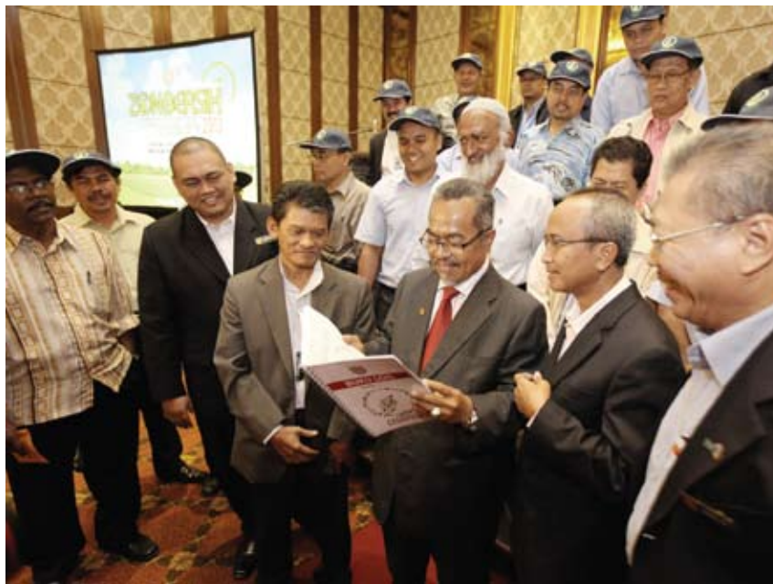
Datuk Bandar bersama Ketua Parcel MBSA dan Ketua-ketua Parcel Komuniti sedang meneliti buku log untuk mencatat aktiviti parcel

"Dalam tempoh lima bulan, dari Jun hingga Oktober tahun ini, kita akan menggembeling segala usaha dan tenaga daripada masyarakat dan MBSA untuk memastikan Shah Alam sentiasa bersih, indah, mampan, sejahtera dan menimbulkan kegembiraan kepada penduduk," katanya