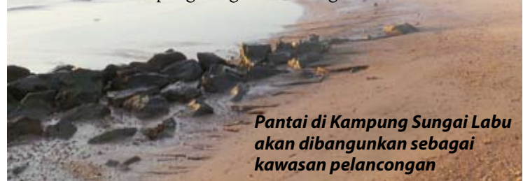
Pantai di Kampung Sungai Labu akan dibangunkan sebagai kawasan pelancongan

Katanya, ia berharap produk dari kawasan Sekinchan seperti pembuatan makanan ringan, kuih, kerepek dan hasil laut dapat dipasarkan di peringkat yang lebih luas lagi dalam dan luar negara.