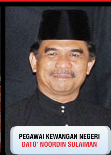
PEGAWAI KEWANGAN NEGERI DATO' NOORDIN SULAIMAN