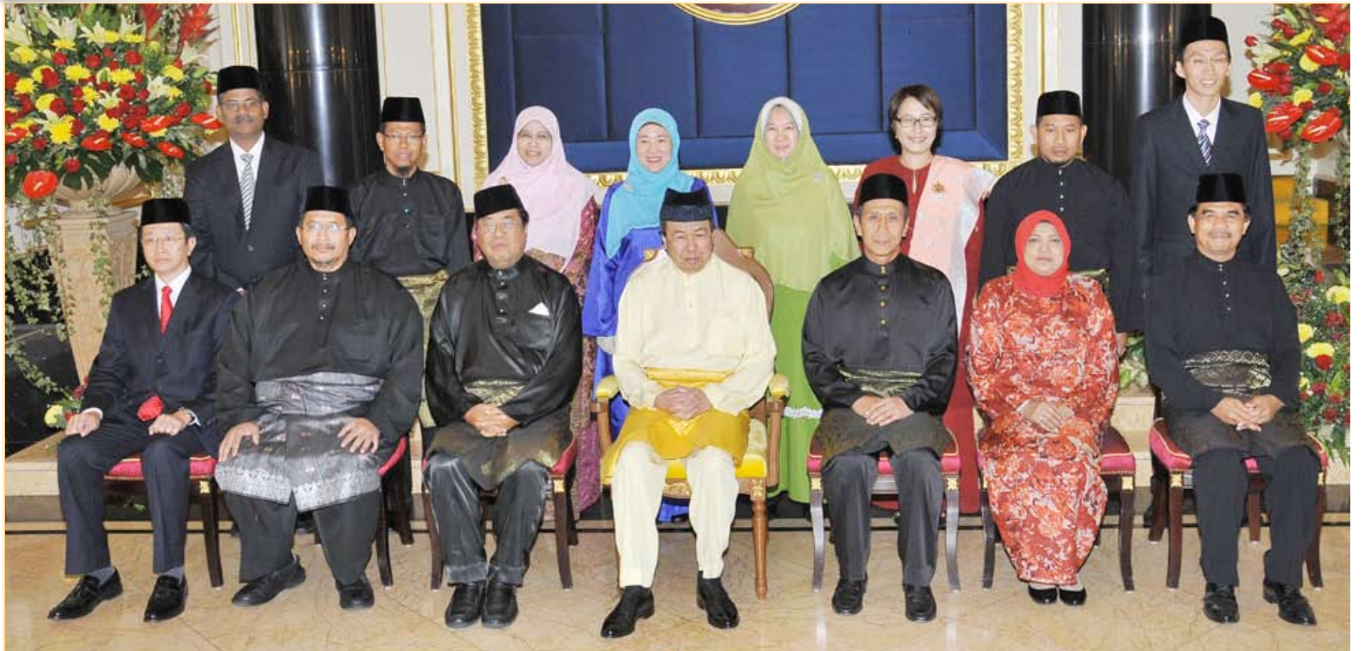
MENERUSKAN KECEMERLANGAN... DYMM Sultan Selangor, Sultan Sharafuddin Idris Shah, berkenan bergambar dengan barisan baru Ahli Majlis Mesyuarat Kerajaan Negeri Selangor 2013, selepas selesai mengangkat sumpah jawatan di Istana Alam Shah, Klang.

Abdul Khalid: Saya jaga wang rakyat muka 4&5