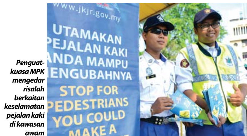
Penguatkuasa MPK mengedarkan risalah berkaitan keselamatan pejalan kaki di kawasan awam

Dalam program itu, ketiga-tiga agensi yang terlibat mengedarkan risalah berkaitan keselamatan pejalan kaki yang disediakan JKJR dalam usaha memastikan pejalan kaki sentiasa diutamakan dan diberi perhatian selak.