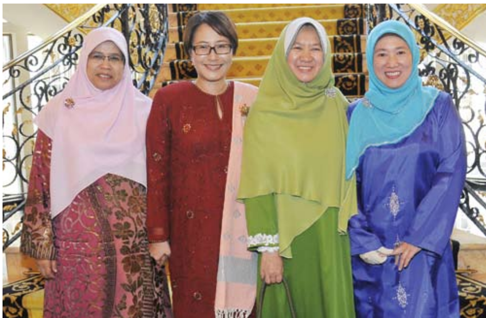
Gandingan mantap Exco Wanita baru dan lama, bakal mencorak kepimpinan masa depan Kerajaan Negeri Selangor