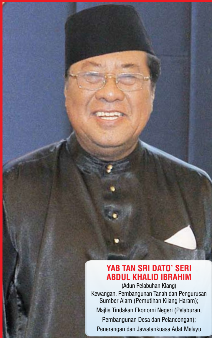
YAB TAN SRI DATO' SERI ABDUL KHALID IBRAHIM (Adun Pelabuhan Klang) Kewangan, Pembangunan Tanah dan Pengurusan Sumber Alam (Pemutihan Kilang Haram); Majlis Tindakan Ekonomi Negeri (Pelaburan, Pembangunan Desa dan Pelancongan); Penerangan dan Jawatankuasa Adat Melayu