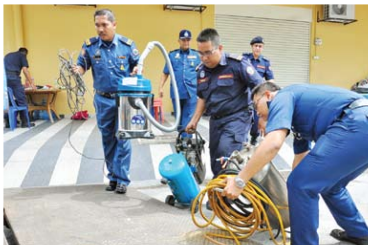
Peralatan seperti pembersih vakum turut dirampas dalam operasi

“Sistem perairan mengikut prosedur yang ditetapkan, iaitu tidak boleh mengalirkan air keluar ke jalan raya, manakala lantai dan dinding dibina daripada jubin,” katanya kepada media selepas operasi membabitkan 38 anggota penguatkuasa MPSJ dan imigresen.