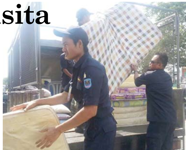
Sebahagian barang yang dirampas, diangkut ke dalam lori

Menurutnya, MPK tidak akan berkompromi terhadap mana-mana pihak yang ingkar kepada undang-undang dan majlis sentiasa mengalu-alukan sebarang maklumat daripada orang awam bagi tujuan pencegahan.