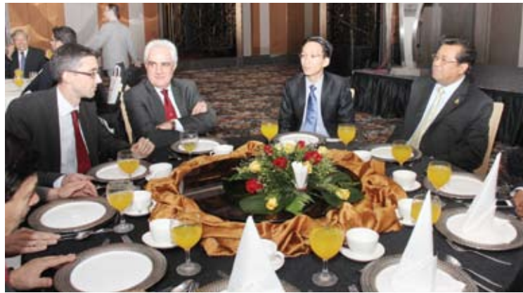
Menteri Besar berbincang bersama diplomat dan delegasi dari dewan perniagaan asing

SSIC ditubuhkan untuk menjana ekonomi Negeri Selangor