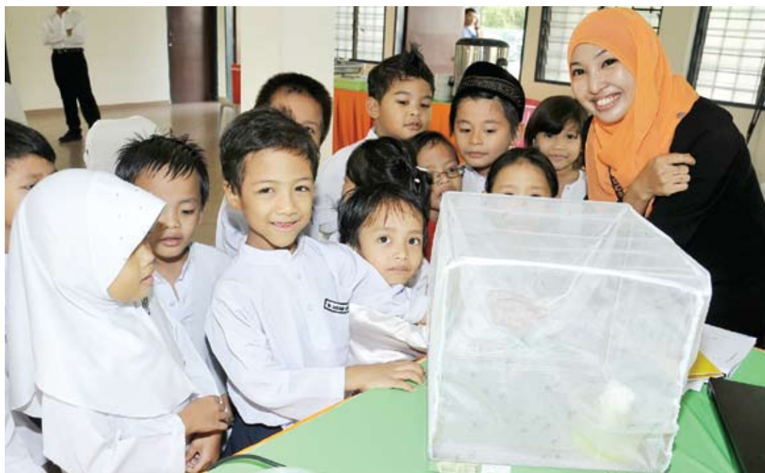
Kanak-kanak Tadika KEMAS Nurul Ehsan, melihat nyamuk TOXO yang dipamerkan di Pangsapuri Sri Tanjung