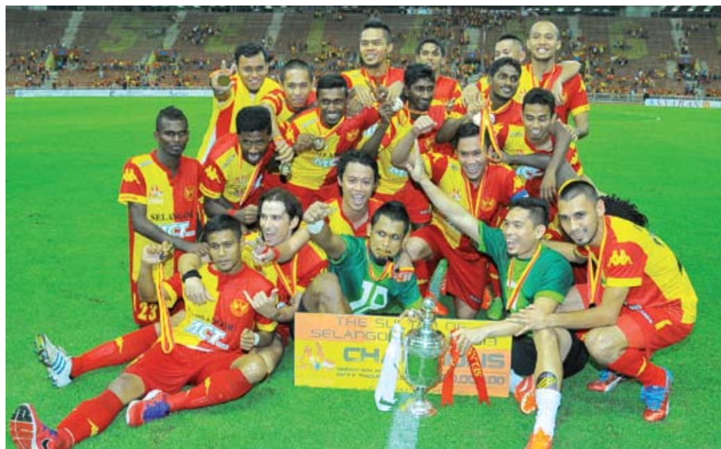
Pasukan Pilihan Selangor mencatatkan kejuaraan kali keenam selepas memenangnya pada 2001, 2003, 2005, 2008 dan 2012