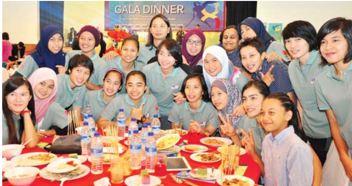
Pemain hoki wanita kebangsaan diraikan pada Majlis Makan Malam Kejohanan Hoki Wanita Asia

SHAH ALAM - Majlis Sukan Negeri Selangor (MSN) perlu mengaktifkan peranan Majlis Sukan Daerah (MSD) jika mahu mengembalikan kegemilangan sukan termasuk hoki di negeri ini.