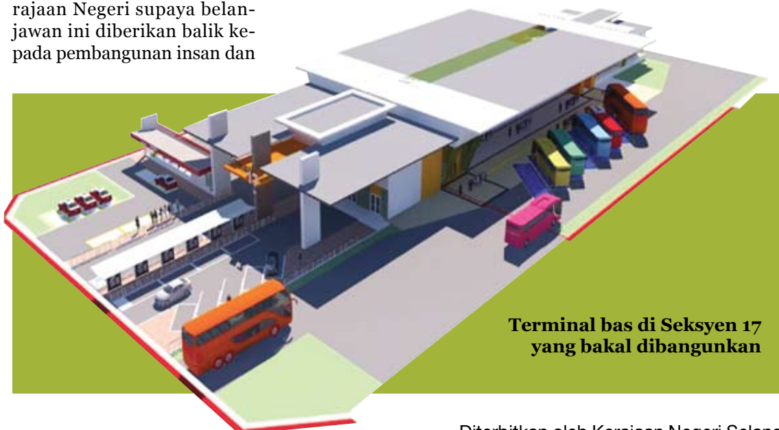
Terminal bus di Seksyen 17 yang bakal dibangunkan

Beliau berkata, MBSA juga merancang menubuhkan sebuah Dewan Banquet bertaraf antarabangsa di kawasan Seksyen 13 pada masa depan dengan anggaran kos RM27 juta.