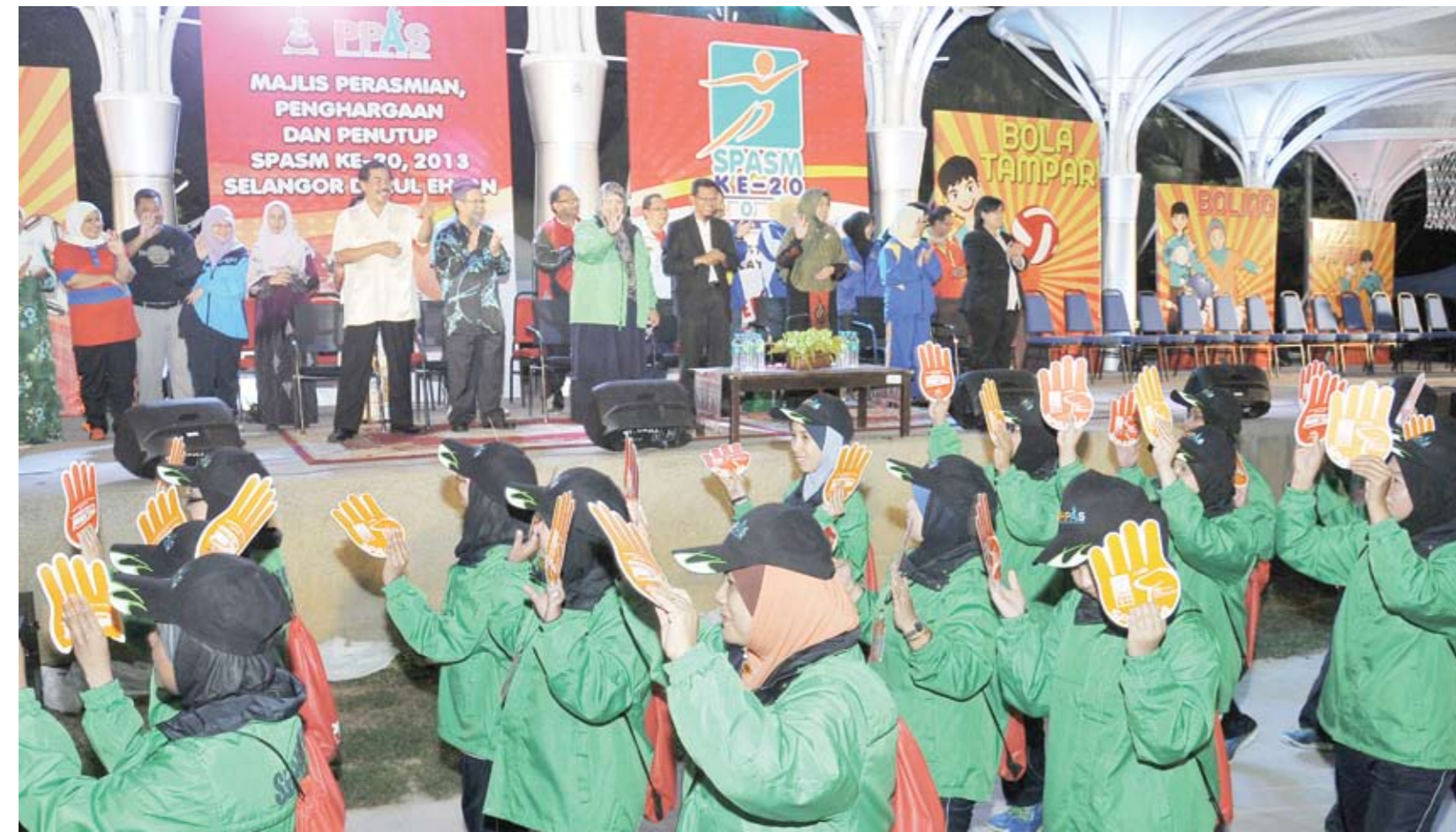
▲ KONTIJEN Negeri Selangor melambaikan tangan kepada tetamu jemputan pada Majlis Perasmian, Penghargaan dan Penutup Sukan Perpustakaan Awam Se Malaysia di Dataran Kemerdekaan Shah Alam