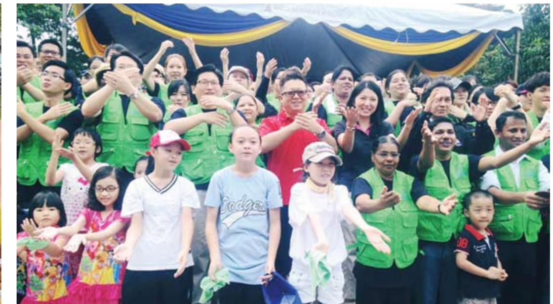
▲ ADUN Damansara Utama, Yeo Bee Yin bersama peserta yang mengambil bahagian dalam program gotong-royong kebersihan di kawasan SS2 Komersial di DUN beliau