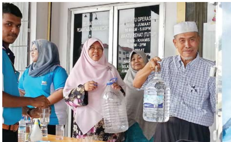
Mesin air nano hidrogen percuma untuk kemudahan penduduk

“Khasiat yang ada bukan sekadar renciah untuk penyediaan makanan, malah ia mempunyai pelbagai khasiat bagi mengubati pelbagai jenis penya-