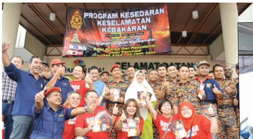
Di Program Kesedaran Keselamatan Kebakaran Pasaraya Matahari, Taman Dato Haron