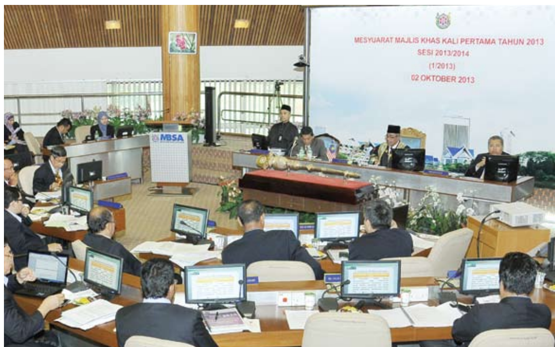
Belanjawan 2014 MBSA, memberi banyak manfaat kepada penduduk Shah Alam