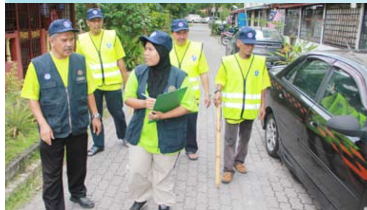
Pasukan Keselamatan Kejiranan (PKKPJ) KRT Flat PKNS Taman Dato Harun

Untuk maklumat lanjut, sila layari laman web www.mbpj.gov.my