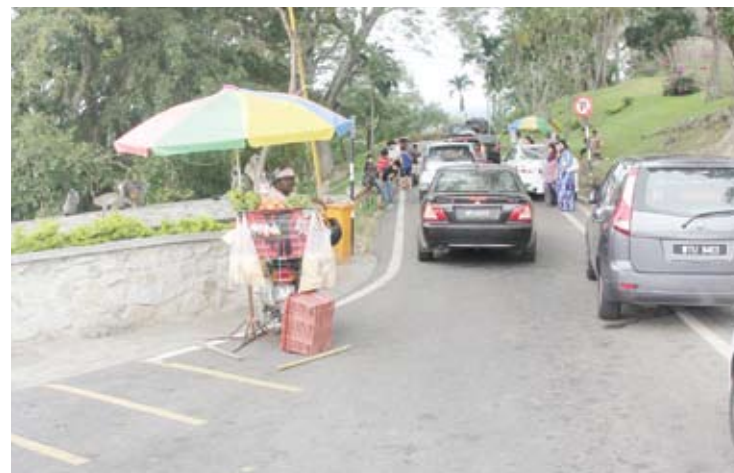
Kawasan puncak bukit yang cerun menyukarkan kerja-kerja pembinaan

"MDKS akan tambah bilangan papan petunjuk arah yang mencukupi untuk kemudahan pengunjung dan mengalu-alukan pendapat orang ramai bagi memastikan pusat pelancongan di sini mesra pengunjung," katanya.