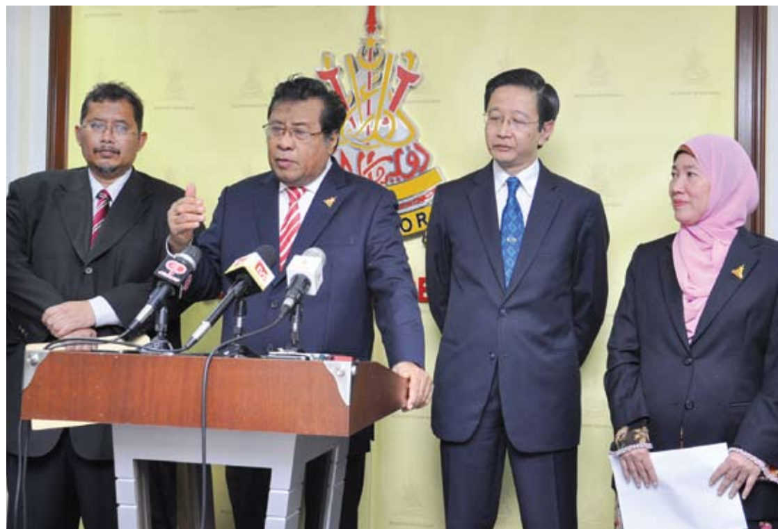
Menteri Besar sewaktu sidang media bersama barisan Exco Kerajaan Negeri