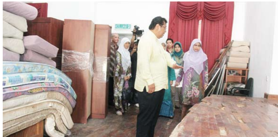
Menteri Besar meninjau keadaan dewan dan 'barang peninggalan' Balkis yang masih dalam perintah mahkamah

SHAH ALAM - Kerajaan Negeri berusaha mencari jalan terbaik untuk mengambil alih dana Badan Amal dan Kebajikan isteri-isteri wakil rakyat Selangor (Balkis) sebanyak kira-kira RM10 juta kepada Kerajaan Negeri.