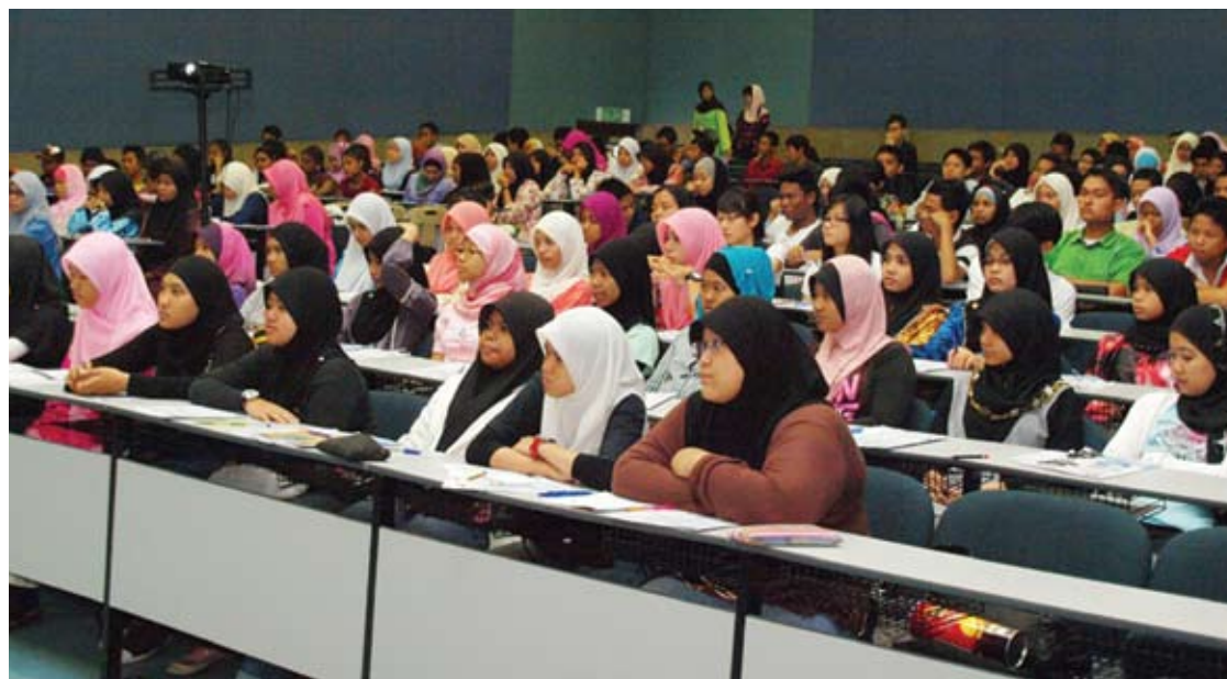
Pelajar PTRS berpeluang mengikuti tuisyen percuma tanpa perlu bebaskan keluarga