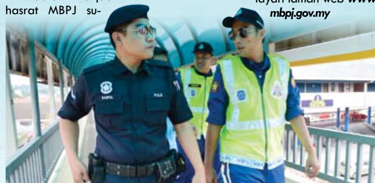
Pasukan Rondaan Keselamatan bersama PDRM