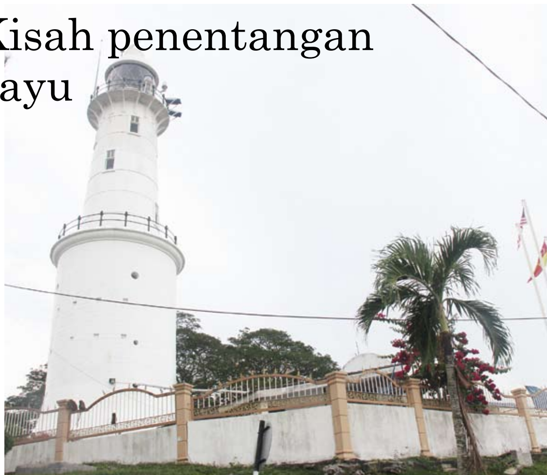
Rumah api-api yang menjadi penanda arah nelayan dan kapal-kapal yang melalui perairan Selat Melaka

pengunjung boleh melawati Masjid Kuala Selangor, Taman Alam, pangkalan nelayan Permatang dan jeti istirehat Kuala Selangor.