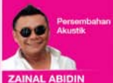
Persembahan Akustik ZAINAL ABIDIN