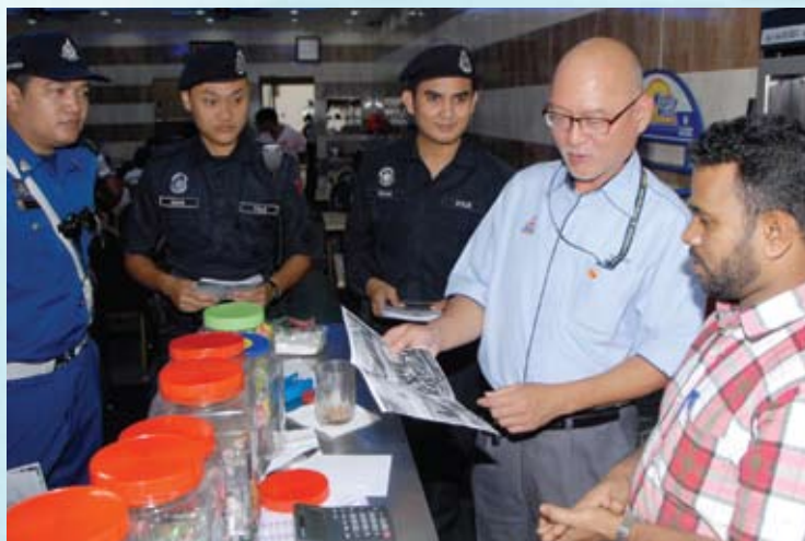
Edaran risalah kepada penduduk Petaling Jaya

"Mulai Januari 2014, kita akan mempersiapkan anggota penguat kuasa MBPJ dari segi pertambahan bilangan anggota dan kelengkapan seperti penyembur lada