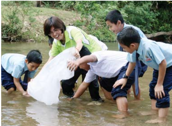
Pelajar ini gembira bila diberi peluang melepaskan benih ikan lampam di Sungai Kerling