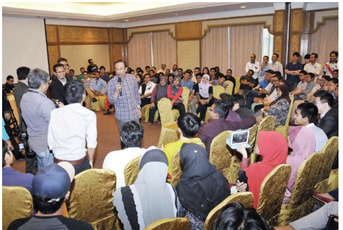
Lebih 200 anak muda tekun mendengar ucapan Anwar sewaktu Program Dialog Anak Muda Bersama Anwar Ibrahim

Lebih 200 orang menyertai program sehari itu.