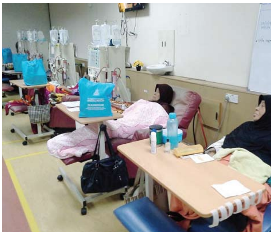
Pesakit buah pinggang sedang mendapatkan rawatan dialisis

"Kita bercadang untuk wujudkan PDR di kawasan lain kerana empat PDR sedia ada hanya berada di kawasan Lembah Klang," katanya.