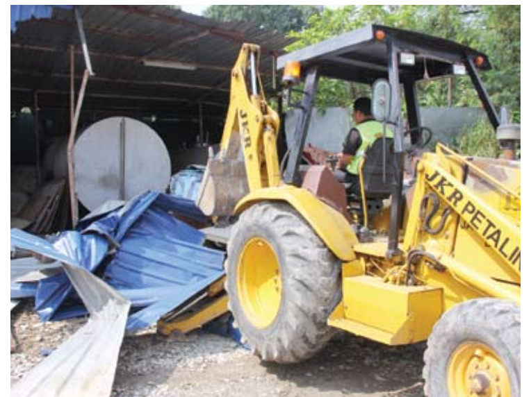
Tangki yang dipercayai digunakan menyimpan diesel

Menteri Besar, Tan Sri Abdul Khalid Ibrahim sebelum ini berkata Kerajaan Negeri akan memantau rizab sungai dengan lebih ketat, selepas pencemaran minyak yang serius di Sungai Gong, Ogos tahun lepas.