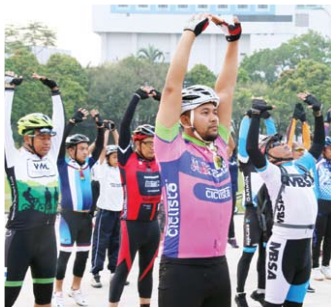
Peserta melakukan regangan terlebih dahulu sebelum memulakan kayuhan

SHAH ALAM - Selaras dengan usaha berterusan Majlis Bandaraya Shah Alam (MBSA) untuk melahirkan warga kota yang sihat dan cergas, seramai 50 orang terlibat dalam Program Berbasikal Kayuhan Santai Shah Alam.