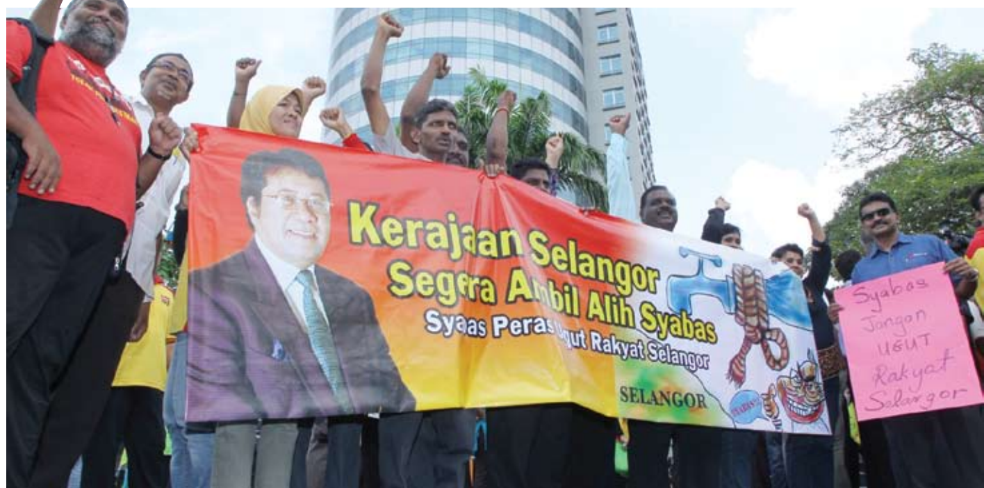
Kerajaan Negeri sudah bersedia walau apapun bentuk syarat-syarat yang akan dikenakan oleh Kerajaan Pusat

Kerajaan Negeri sebelum ini membuat tawaran kepada empat syarikat konsesi, Syabas, Abbas, Splash dan Puncak Niaga sebanyak RM 9.65 bilion bagi mengambil semula pengurusan air di Selangor.