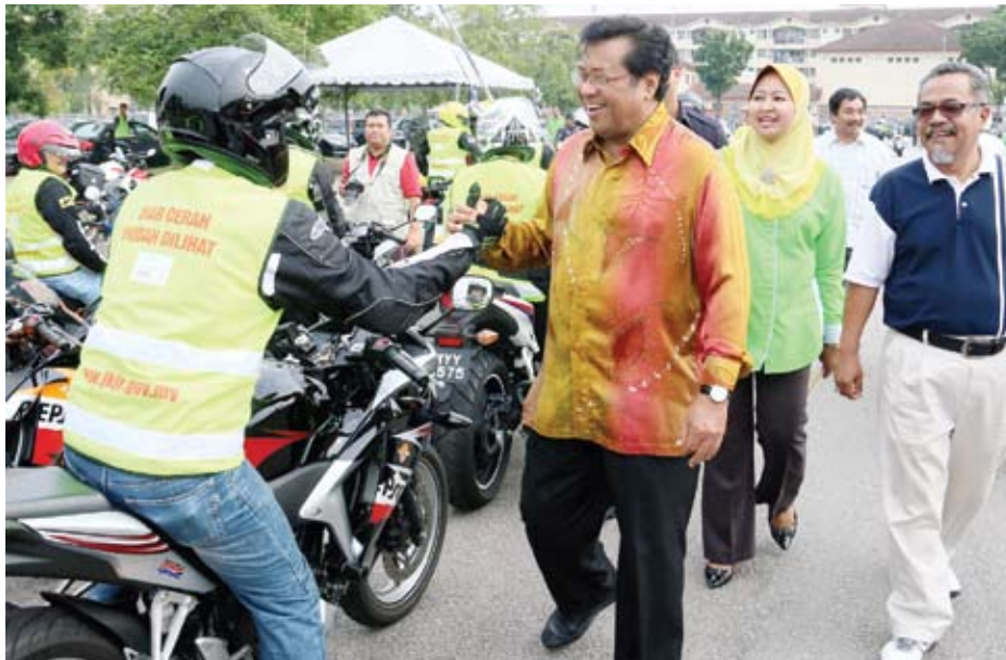
Menteri Besar, bersalaman dengan penunggang motosikal sewaktu merasmikan Kempen Keselamatan Jalan Raya sempena Tahun Baru Cina di Stadium Shah Alam