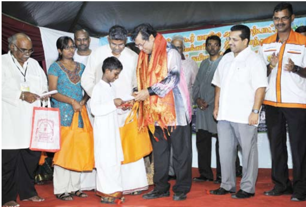
▲ Kanak-kanak ini menerima cenderahati daripada Menteri Besar, Tan Sri Abdul Khalid Ibrahim, sempena sambutan Pesta Ponggal Tamar Thirunal, Peringkat Negeri Selangor yang dipekarangan Padang Chetty, Klang