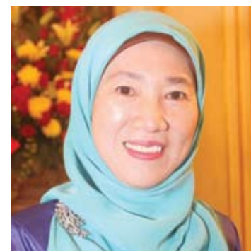
●达罗雅（卫生、企业、科学及创新事务）

希望全体人民在马年能朝向更团结及和谐的目标前进，与民联携手打造更美好雪州，也恭祝雪州华裔在马年行大运。