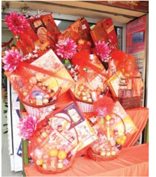
▲礼篮行情显得慢热。