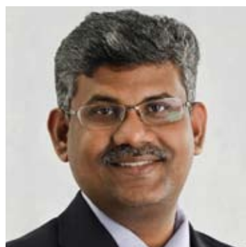
●甘纳峇迪劳（园丘工人、贫穷及关爱事务）

祝愿全体雪州华裔人民新年快乐，希望各族及宗教信仰者今后更团结一致，互相谅解和尊重，打造更和谐的社会。