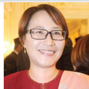
●黄洁冰（旅游、环境及消费人事务）

希望雪州各族人民在马年能更以更和谐融洽的精神，为雪州发展和各族权益注入新动力，包括妇女发展，也恭祝雪州华裔人民新年快乐。