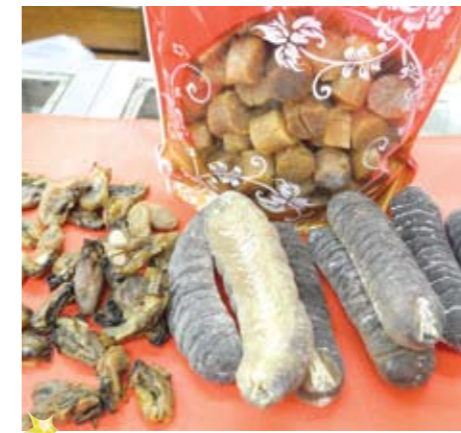
▲海参、干贝与螺豉的价格保持一般水平。