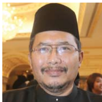
●伊斯甘达（房屋、建筑管理及城市发展事务）

祝愿雪州人民在迎接马年时，能如骏马般充满干劲和活力，达到更卓越成就。民联将秉持过去5年来的执政成就，继续努力往前冲，为民服务。