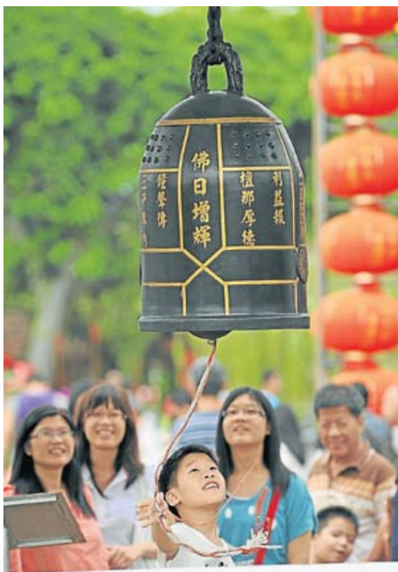
▲ “敲一敲平安钟，愿我诸事如意吉祥。”