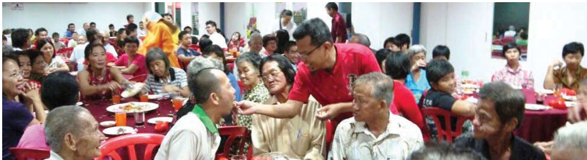
▼ 尤努斯出席新春活动时喂长者品尝年菜。