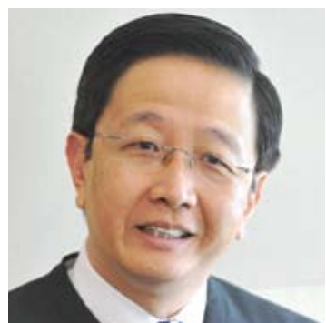
●拿督邓章钦（地方政府及研究事务）

祝愿雪州人民在迎接马年时，能如骏马般充满干劲和活力，达到更卓越成就。民联将秉持过去5年来的执政成就，继续努力往前冲，为民服务。