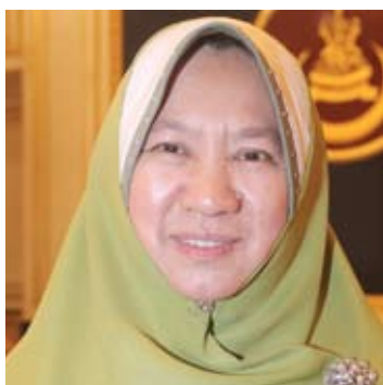
●哈丽玛（教育及人文发展事务）

祝愿全体华裔人民在马年如马只充满斗志，朝梦想前进，并希望全民作好准备迎接充满经济挑战的新一年。