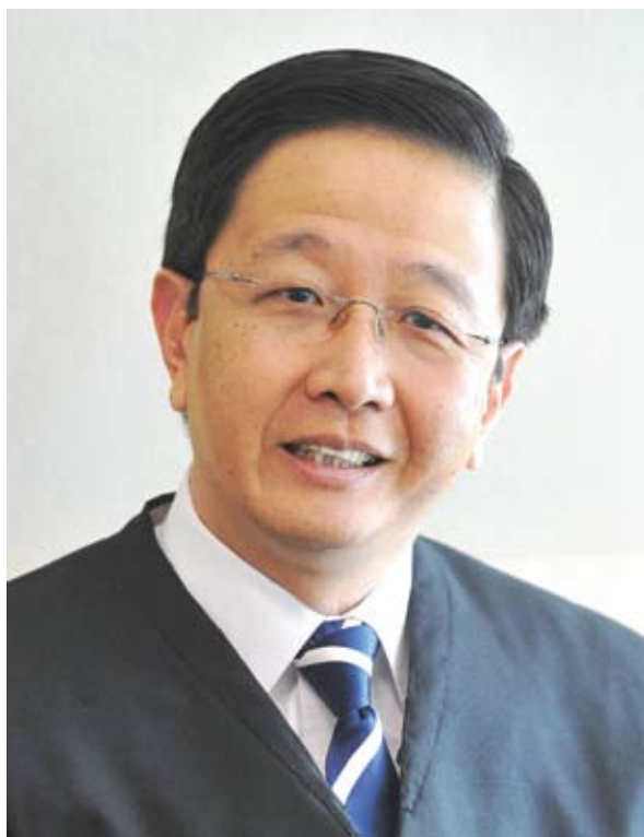
▲邓章钦在晚宴上宣布雪州政府委任独立机构，每6个月为8个市议会评分。

(巴生讯)雪兰莪州高级行政议员拿督邓章钦宣布，州政府已委任独立调查机构从今年起，每6个月进行一次民调为8个市议会评分，进一步提升地方政府的服务效率。