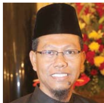
●尤努斯（青年、体育、基本和公共设施）

在迎接马年到来，希望全体雪州人民和华民以更大勇气和斗志，面对接踵而来的经济挑战，与州政府共度时艰。