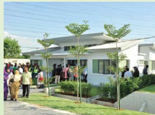
▲ 武吉波达购屋申请期限获得延长，购屋者受促保持冷静。

至今，约100名居民以现金购买相关房屋，另100人成功获得银行的房贷申请，其余购屋者仍在处理贷款事宜。