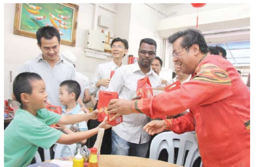
▲卡立（右）沿户走动派发小礼包给民众，图中孩童接到礼包笑开怀。

民联执政雪州后推出多项“还富于民”政策，其中一项为乐龄亲善基金，凡登记者可在“走，一起去