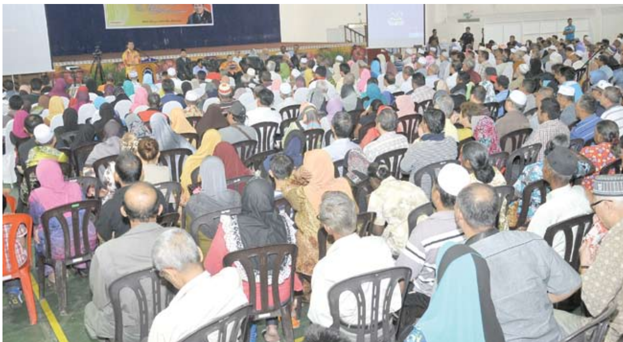
▲ 卡立在对会会上与居民商讨房屋计划搁置问题。