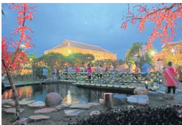
▲ 绚丽夺目的花灯，为东禅寺增添新春气氛。