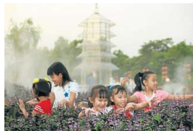
▲ 孩童们在东禅寺的花丛间体会佛法之美。