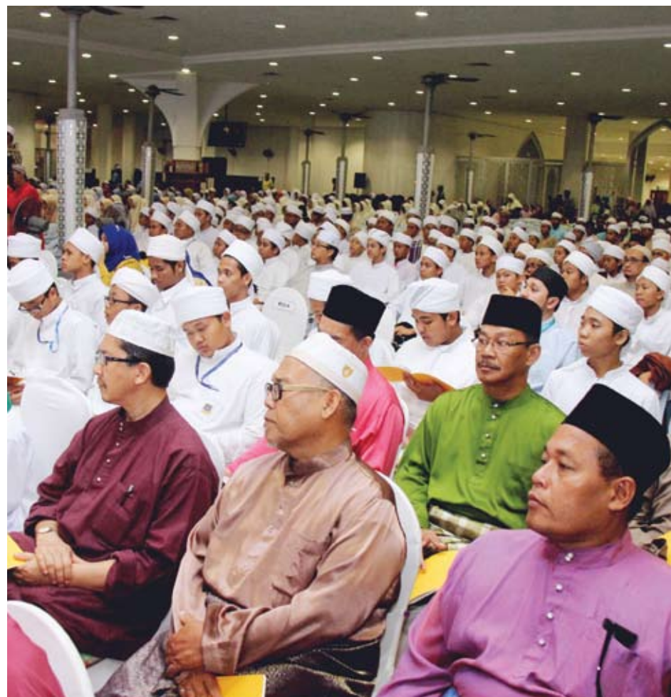
Orang ramai hadir memenuhi dewan Masjid Negeri di Shah Alam