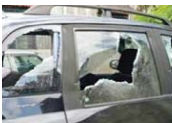
Kereta Ahmad Fauzi yang dipecahkan

Hal itu berikutan beberapa siri jenayah yang dilaporkan sebelum