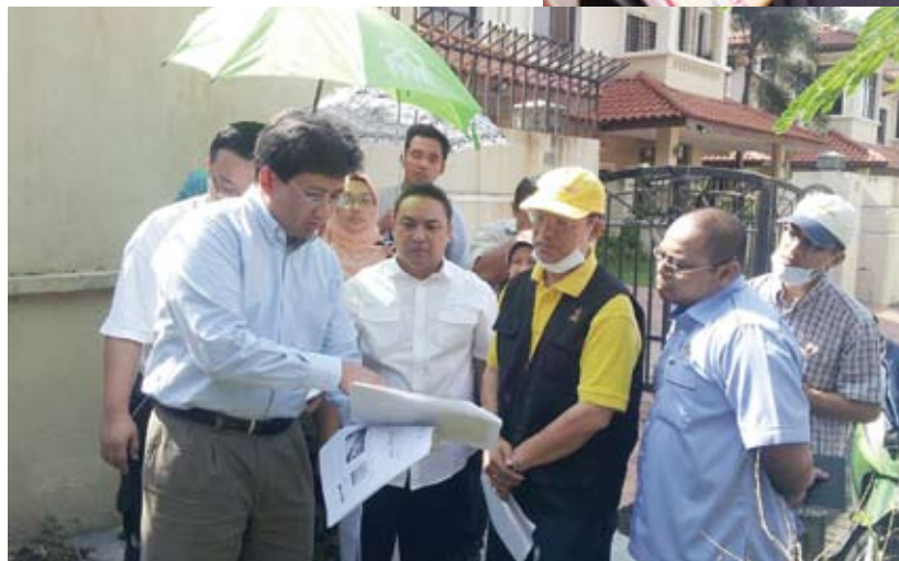
Bersama penduduk meninjau pembangunan di kawasan Kemensah Heights yang membimbangkan

“Saya berharap Kerajaan Negeri turut membantu dalam isu ini selain pemaju. Proposal saya ialah kawasan itu dimajukan dengan penduduk terbabit diberi kemudahan mengikut nilai subsidi diterima pemaju dan ia bukan memindahkan mereka,” katanya.