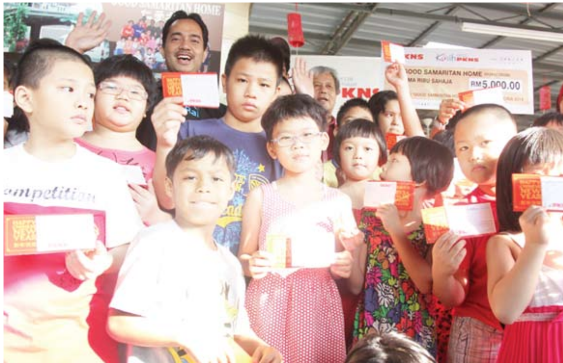
Kanak-kanak Good Samaritan Home, gembira menunjukkan ang pau yang mereka terima