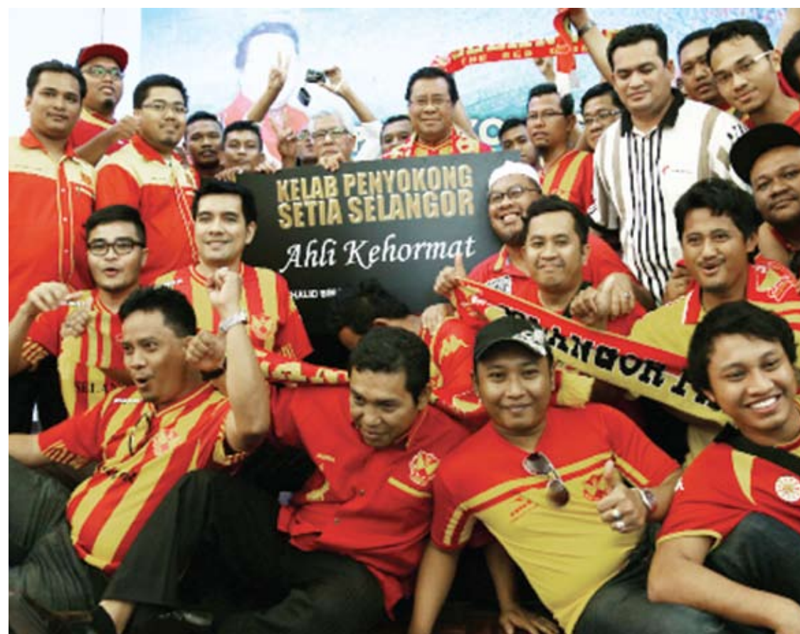
Menteri Besar bersama penyokong 'Red Giant' sewaktu Program Ramah Mesra Bersama Penyokong Bola Sepak Selangor

SHAH ALAM - Bagi merencanakan lagi arena sukan bola sepak dan memperkasa pembangunan kelab bola sepak Selangor, Kerajaan Negeri sedang mengkaji usaha untuk menerbitkan pemberian saham kepada penyokong setia.