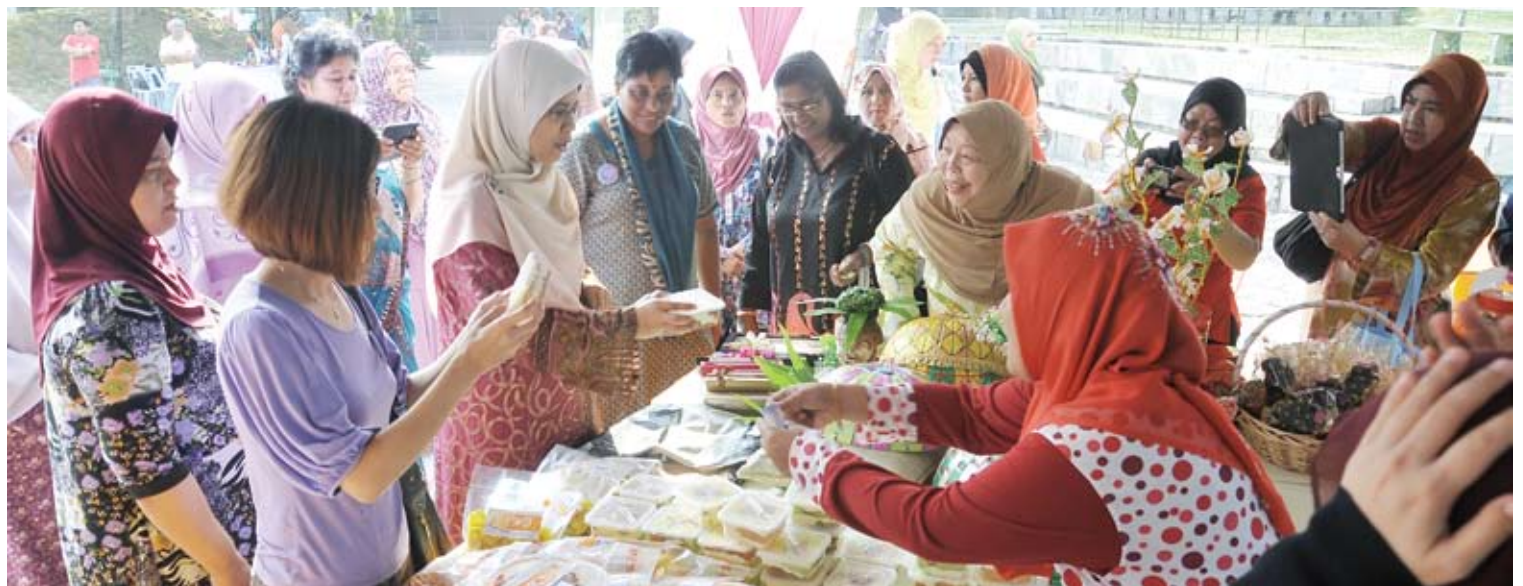
Usahawan IKS turut diberi peluang menjual barangan yang dihasilkan

Katanya, rakyat juga kini lebih bijak menilai erti demokrasi dan ketelusan serta utuh memelihara keamanan walaupun berbeza fahaman agama serta kaum.