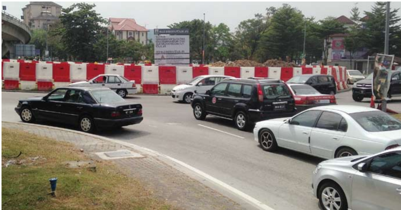
Jalan Othman sedang dinaik taraf dan dijangka siap Ogos ini