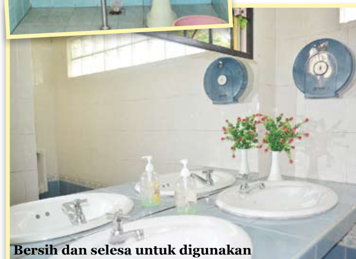
Bersih dan selesa untuk digunakan