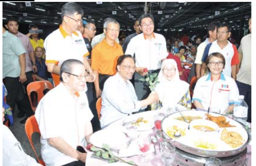
Anwar menghulurkan bunga kepada Wan Azizah sambil diperhatikan pimpinan Pakatan yang lain

Saya mengajak semua pengundi terutama di Kajang untuk bersama saya memberi mesej yang kuat dan menyeluruh. Dalam perhitungan tanah yang tidak rata, saya kira kemenangan itu yang saya cari, doakan yang lebih penting untuk dapat majoriti besar