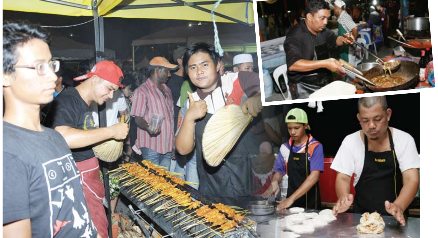
Kajang terus menjadi tumpuan orang ramai dengan pelbagai masakan daripada peserta Mimbar