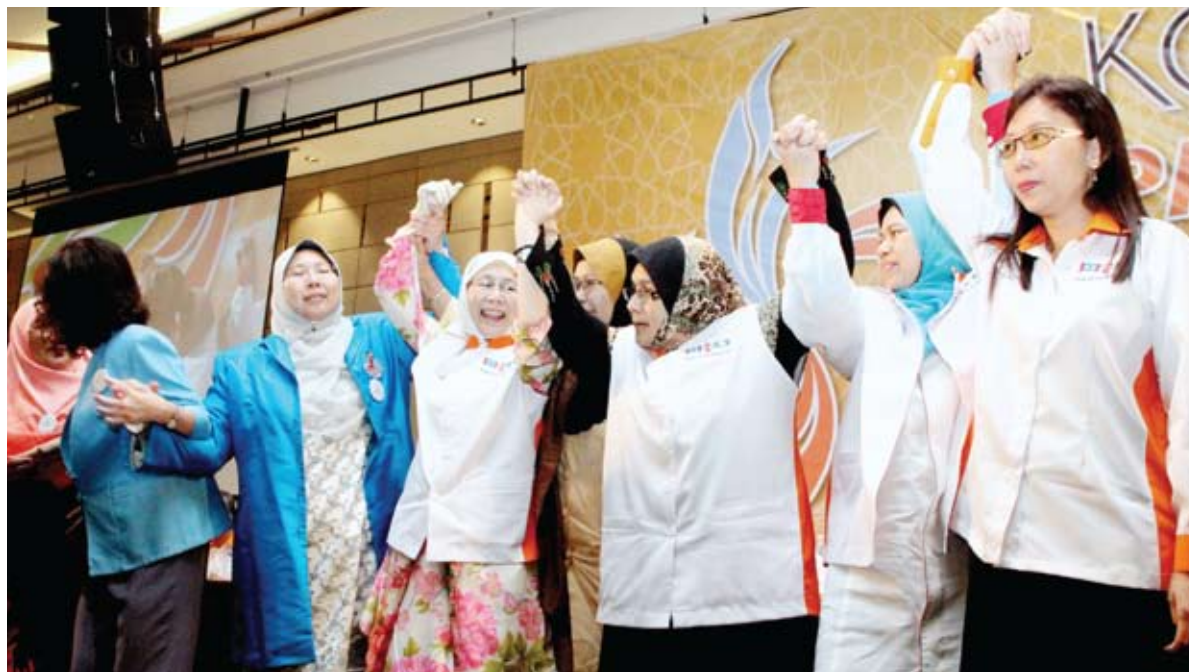
Wanita Pakatan menyokong sebulat suara pencalonan Wan Azizah di Kajang