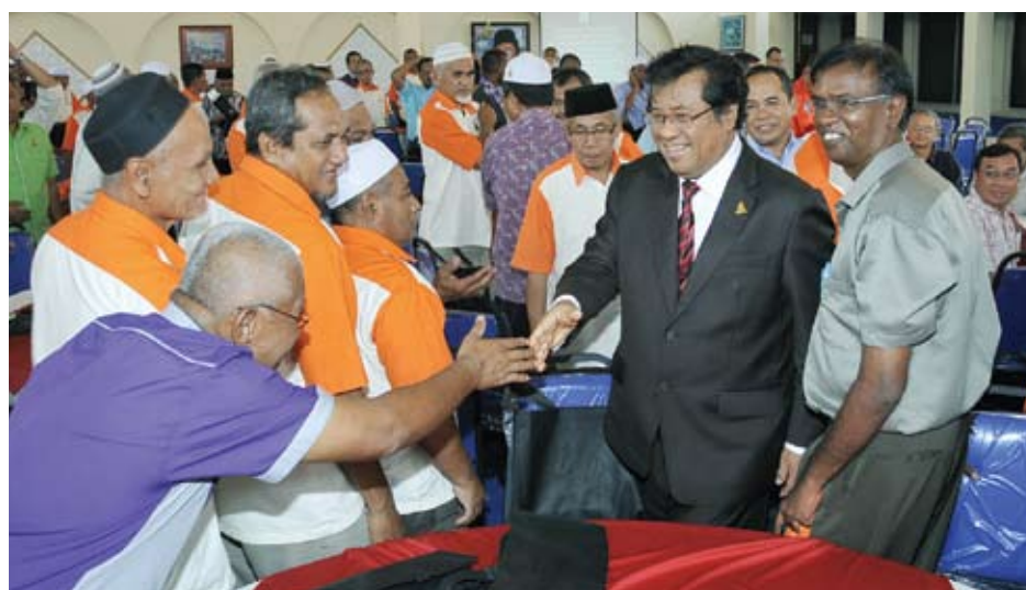
Menteri Besar bersalaman dengan ketua kampung yang hadir

“Bila lulus nanti, mereka ini akan ditempatkan di pangsapuri Selangor yang memerlukan tenaga kerja dengan pendapatan tidak kurang RM1,500 sebulan. Kita harap usaha ini boleh melahirkan tenaga kerja mahir yang laku di mana sahaja,” katanya, di pertemuan bersama Ketua Kampung seluruh Selangor di kediamannya baru-baru ini.