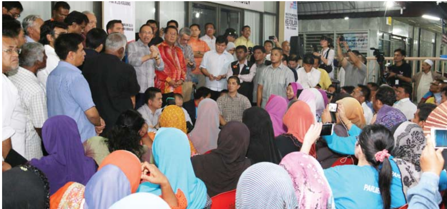
Anwar berucap di hadapan ribuan penyokong di bilik gerakan utama PKR di Kajang, selepas Mahkamah Rayuan menjatuhkan hukuman bersalah terhadapnya