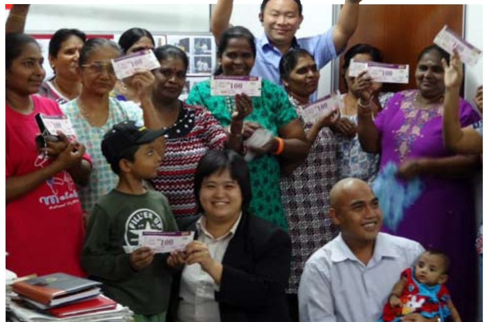
Bersama penerima baucar Jom Shopping sempena perayaan Deepavali

“Jom Shopping SMUE contohnya disukai peserta kerana mereka dapat turut serta dalam aktiviti itu dan dapat hasilnya secara terus, terutama di musim perayaan.