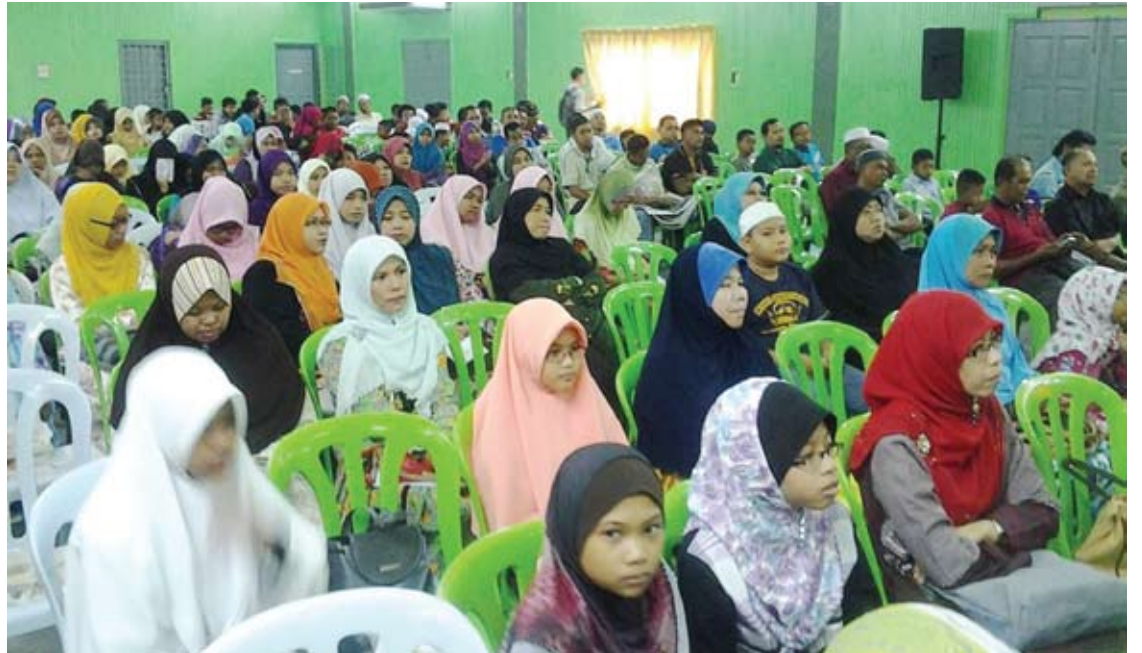
Sebahagian daripada ibu bapa dan pelajar PTRS yang hadir pada Majlis Pelancaran PTRS dan motivasi keibu bapaan anjuran Koordinator Pembangunan Modal Insan

"Oleh itu, sebagai ibu bapa kita perlu tahu bagaimana peranan ibu bapa membantu anak mencapai yang terbaik menggunakan peluang sedia ada," katanya.