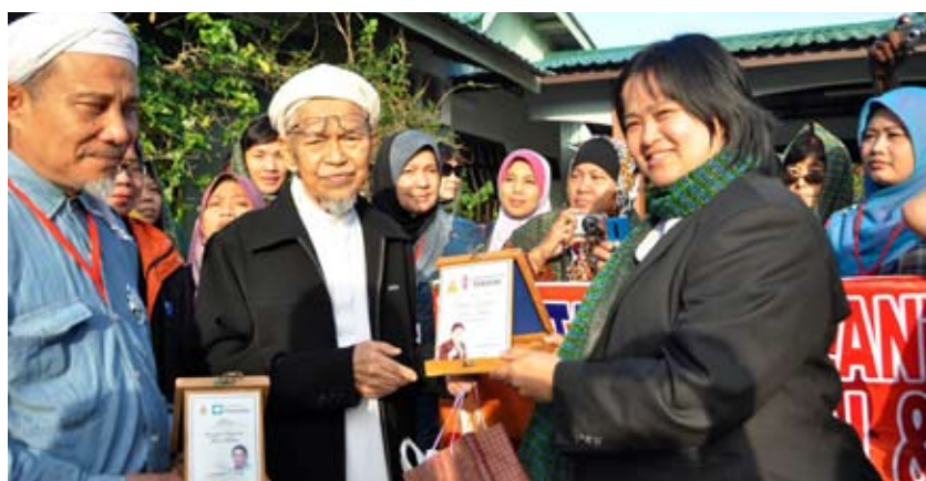
Berjumpa Mursyidul Am PAS, Datuk Nik Aziz Nik Mat, sewaktu berkunjung ke Kelantan