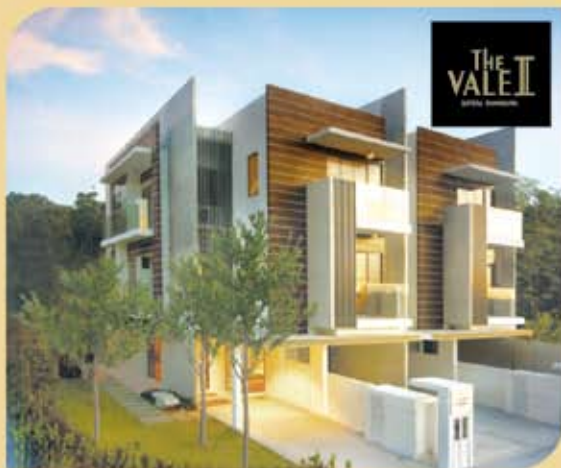
Fasa 1 habis jualan, The Vale II kini dibuka untuk pendaftaran.

TEMPAT : B-G-28, Block Bougainvillea, 10 Boulevard, Lebuhraya SPRINT, PJU 6A, 47400 Petaling Jaya, Selangor. GPS: 3° 7.998', 101° 36.884'