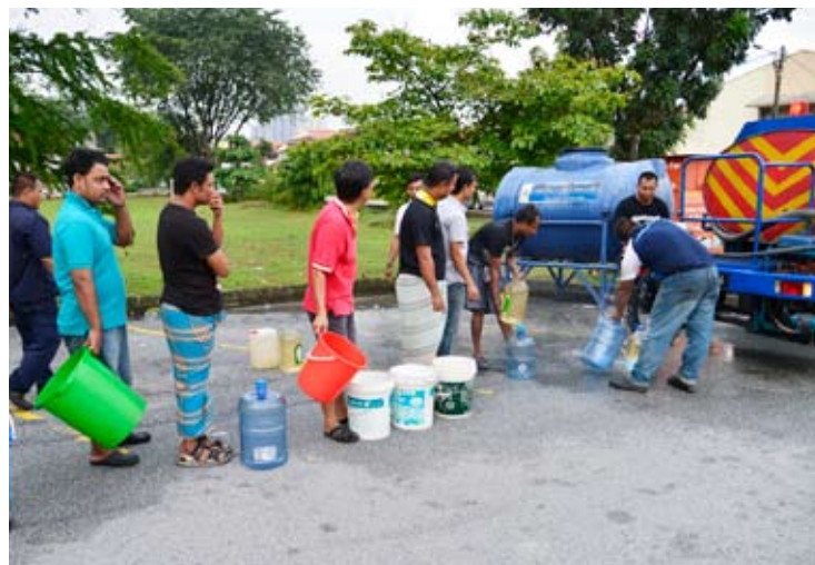
Pengambilalihan konsesi mampu mengatasi krisis air di Selangor

projek akan dilakukan serentak, iaitu penyusunan semula pengambilalihan operasi air daripada konsesi,” katanya di sidang media seusai lawatan ke Majlis Perbandaran Kajang, (MPKj) baru-baru ini.