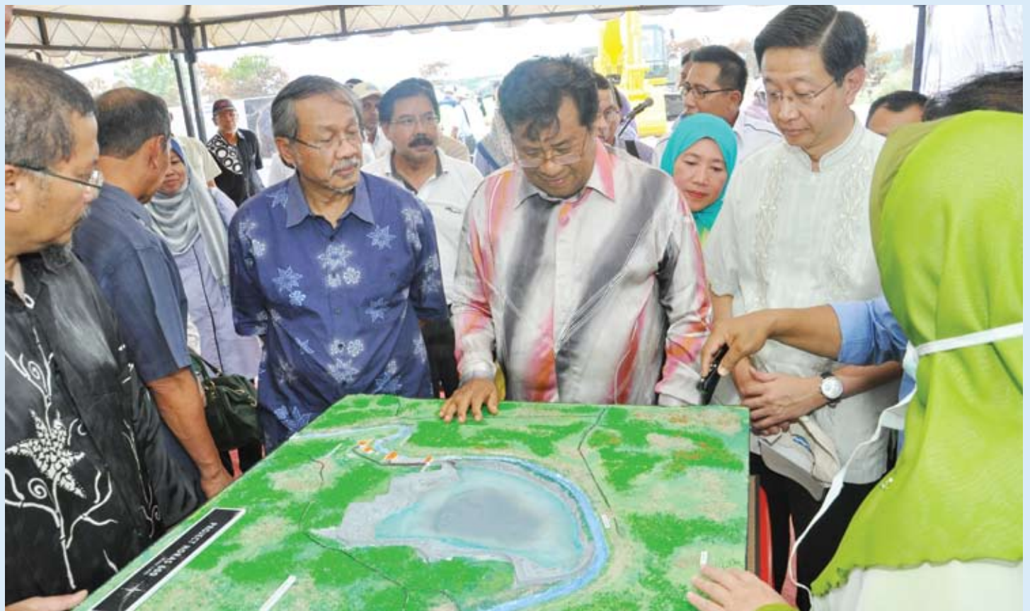
Menteri Besar, Tan Sri Abdul Khalid Ibrahim, bersama pimpinan Kerajaan Negeri melihat model HORAS di majlis pecah tanah projek itu

Kajian dijalankan Unisel itu meliputi responden daripada Melayu (65.4 peratus), Cina (18.8 peratus) dan India (14 peratus).