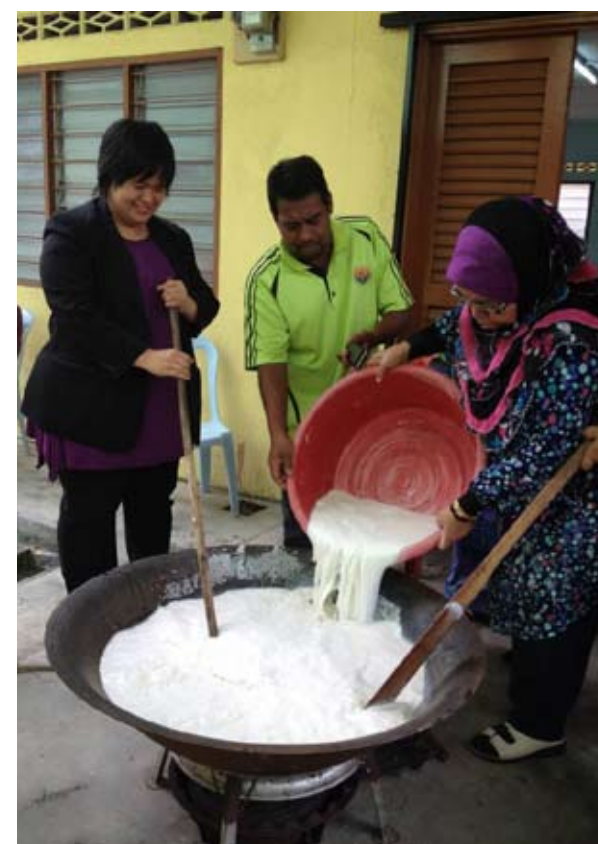
Persediaan dan edaran bubur lambuk di Kampung Cheras Baru

“Itu janji saya bila terpilih sebagai Adun di sini kerana dalam kempen pilihan raya lalu barisan pembangkang (BN) memberikan gambaran yang salah mengenai perkara ini kepada umum,” katanya.