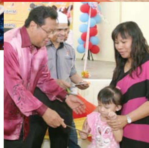
◀80名雪州初生婴儿基金会员与雪州大臣卡立一起庆生, 场面热闹。