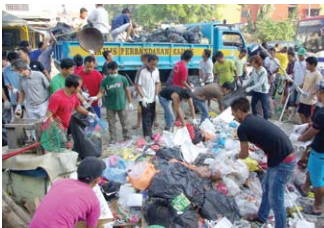
▲居民们踊跃参与爱兰镇商业中心大扫除，还商业区干净的环境。

(加影讯) 杜顺大区州议员拉查里服务中心联合加影市议员曾开俊服务中心和金花园商店联合管理机构，在蕉赖黄金花园爱兰镇商业中心举行大扫除，以唤醒商家对环境卫生的觉醒。