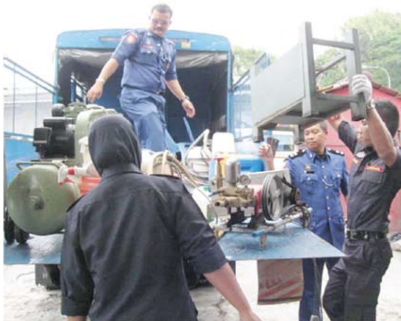
▲ 执法官员在取缔行动中充公非法洗车中心的器材。