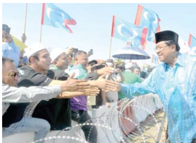
▲雪兰莪州务大臣丹斯里卡立到场时，与热情的支持者握手。