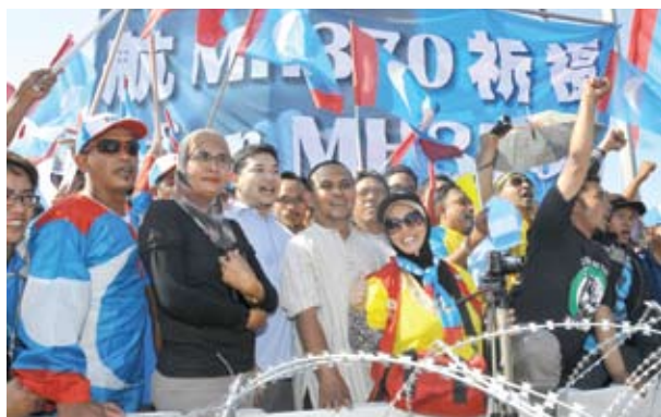
▲民联支持者在提名站外支持旺阿兹莎。

在13届全国大选中，李景杰在六角战中得票1万9571票，以6824张多数票击退国阵候选人李万行（1万2747票）、大马伊斯兰教人民阵线候选人，以及3名独立候选人。