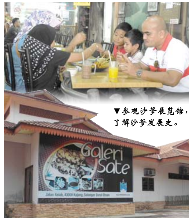
▼参观沙爹展览馆，了解沙爹发展史。