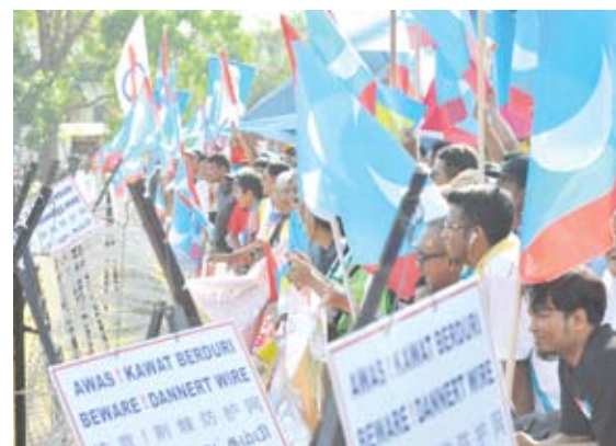
▲民联支持者在提名现场的防线外摇旗呐喊，支持旺阿兹莎提名竞选。