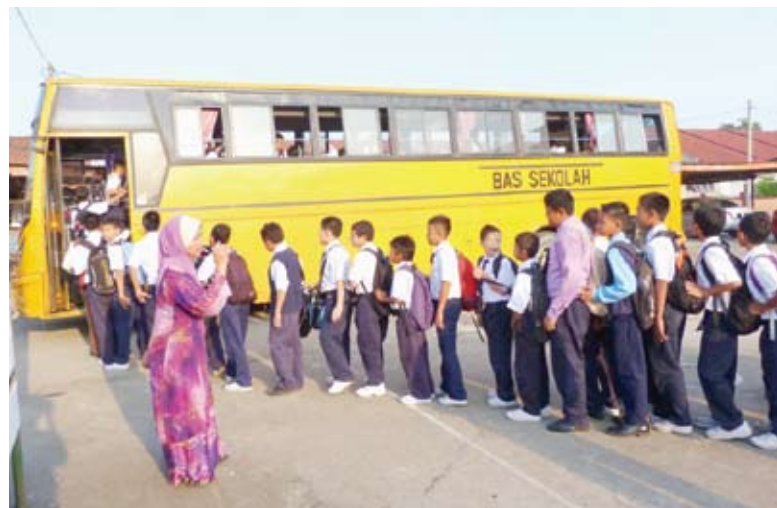
▲ 雪州政府为乡区学生提供巴士费补贴的优惠。

他说，就职后的青年每月薪金至少1500令吉，技职学校将根据澳洲水平发出毕业证书。