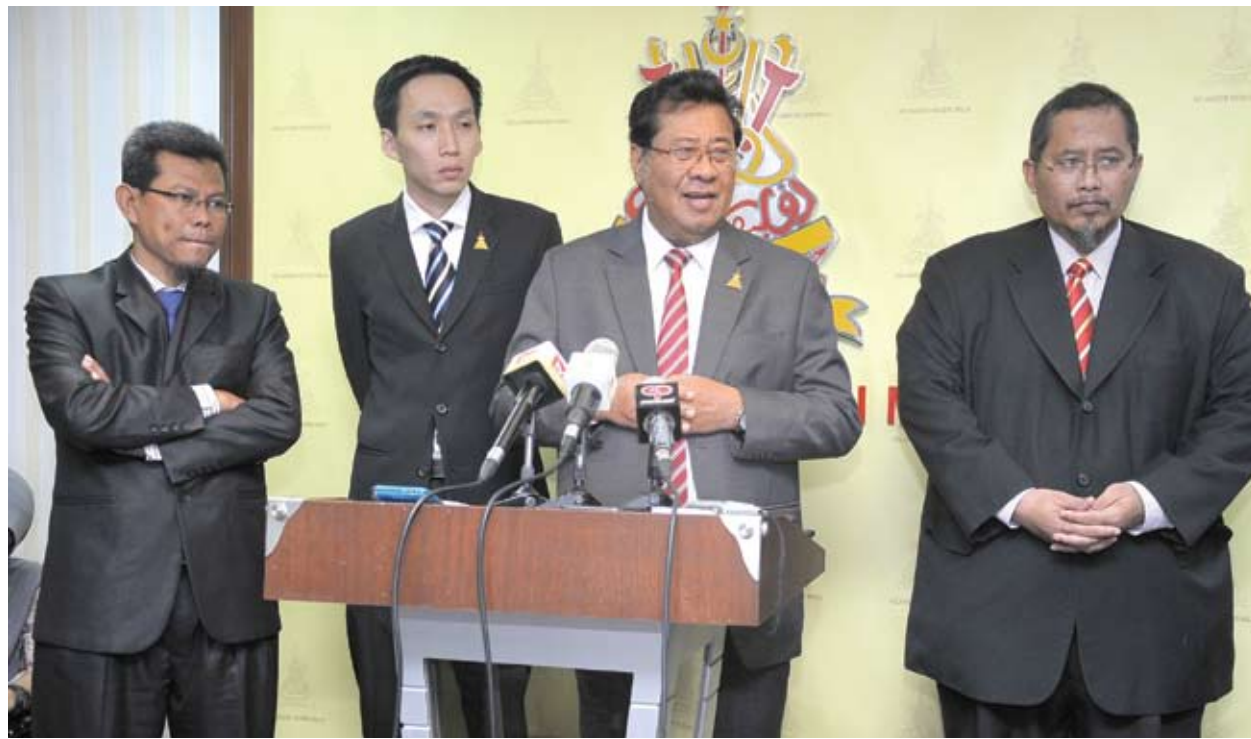
▲卡立(右2)向雪州人民保证水费在未来三年内不起价。

“为人民在重组水务工业上的利益，我们期待雪州和联政府之间，能有积极及有利的合作。”