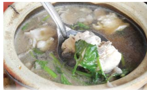
▲热乎乎的辣汤，让人喝得很过瘾。