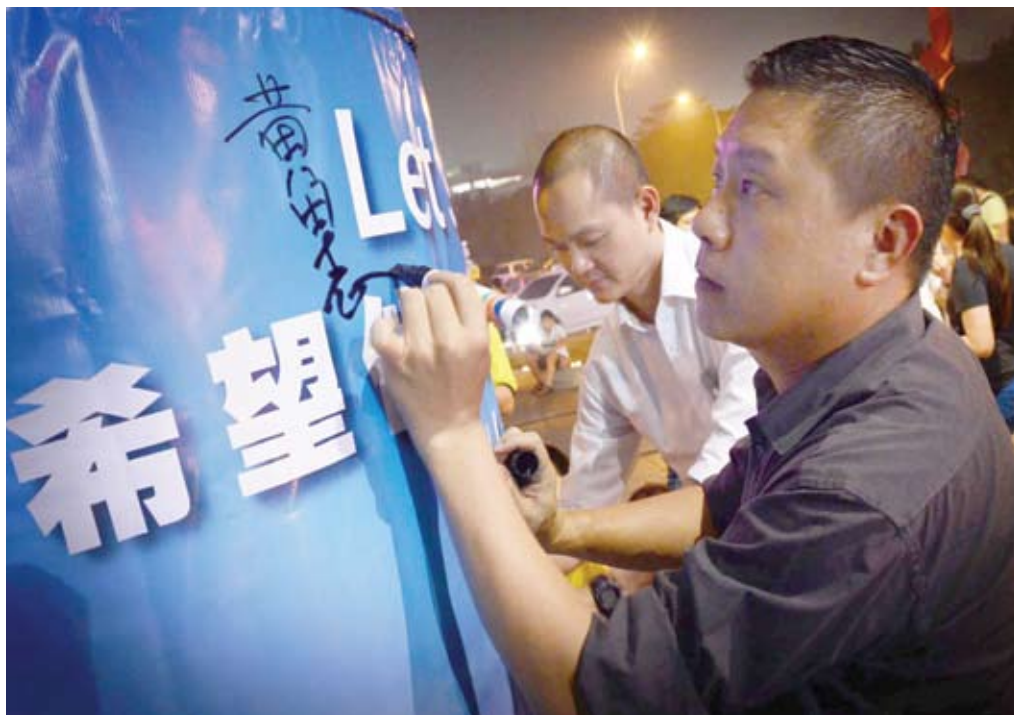
政府也必须清楚交代针对搜救工作的立场，以及今后会采取的步骤，以安定相关家属的情绪。