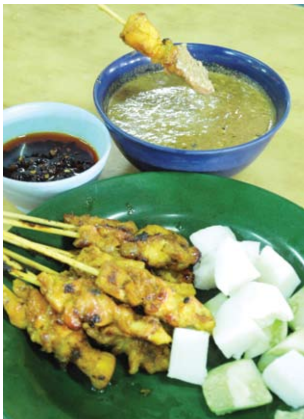
▲沙爹蘸上花生酱及辣椒酱，吃起来别有滋味。

业者也不断推陈出新，提供更多种类沙爹供顾客选择，计有鸡肉、牛肉、羊肉、鱼肉、鹿肉等。