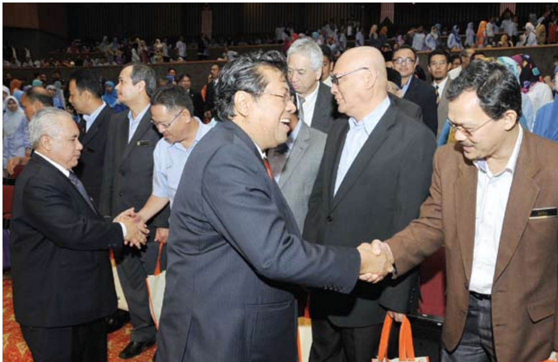
Menteri Besar beramah mesra dengan kakitangan Kerajaan Negeri di Majlis Perhimpunan Bulanan Jabatan - Jabatan Kerajaan Negeri Selangor 2014