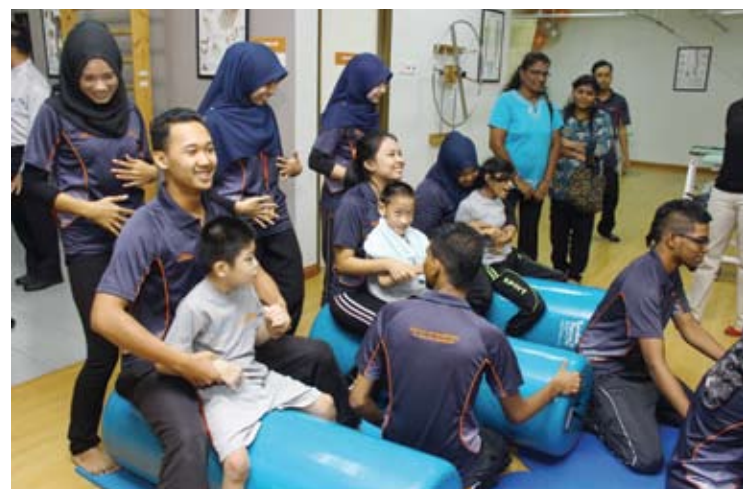
Pelajar fisioterapi menunjuk kaedah rawatan yang diajar

Dengan perasmian pusat berkenaan, Unisel kini mampu bersaing dalam industri kospus sains kesihatan yang kini semakin mendapat permintaan yang tinggi.