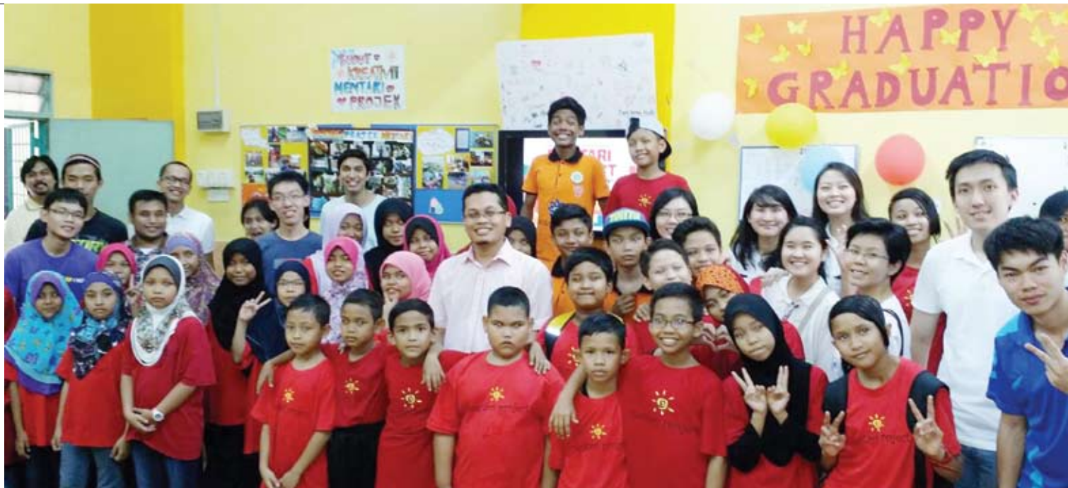
Nik Nazmi (tengah) bersama pelajar-pelajar di Majlis Graduasi pertama Projek Mentari di Blok 8 Desa Mentari