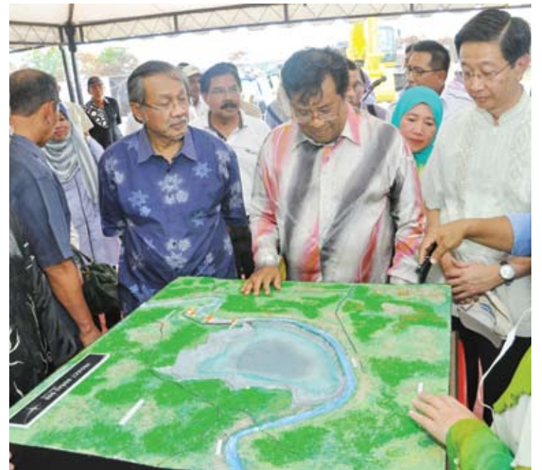
Menteri Besar dan pimpinan Kerajaan Negeri sewaktu pelancaran Projek Horas

“Dalam rundingan itu kita mesti tentukan penyusunan semula sudah dipersetujui dan saya rasa menteri air setiap masa memanggil dan berbincang untuk menentukan pelaksanaan itu dibuat dengan tepat dan rapi,” katanya.