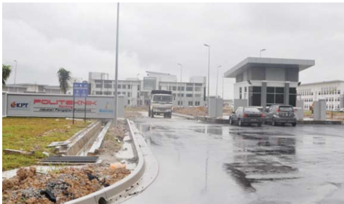
Politeknik Banting antara projek yang lewat siap gara-gara kelemahan bayaran kepada kontraktor terlibat

"Sudah tiba masanya untuk Kerajaan Pusat mengkaji semula perkara ini dalam memastikan rakyat tidak lagi menjadi mangsa," katanya.