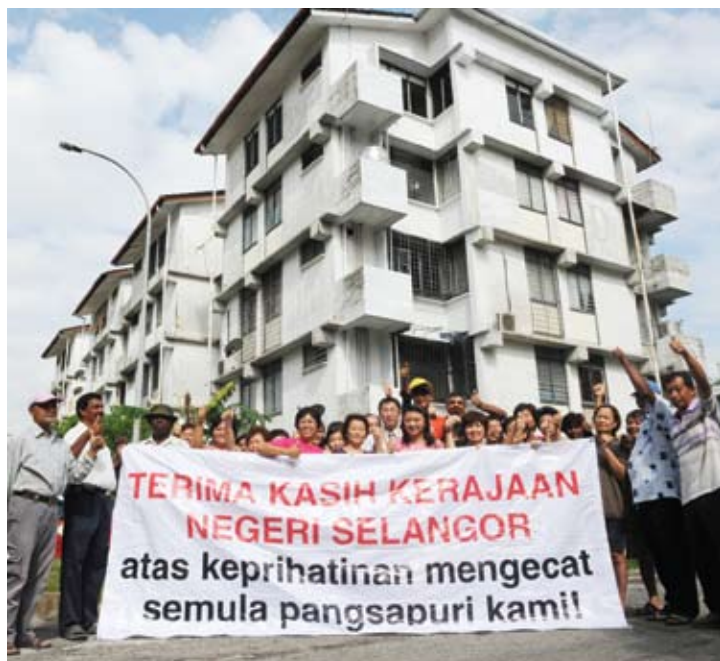
Skim Ceria memberi manfaat kepada 104 pangsapuri sekitar Selangor

SATU tabung khas perlu diwujudkan untuk membaik pulih dan menaik taraf kemudahan lif pangsapuri.