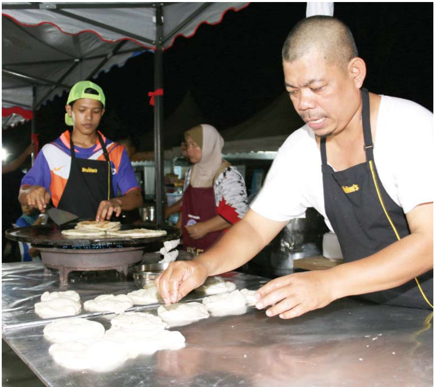
▲雪州城市微型贷款协助生活在城市的小贩上扩展生意。

“参与者3人为一组,她们可自行寻找合作伙伴,因此每人承担3000令吉的贷款,每月分期付款缴还。”