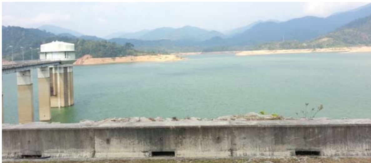
▲雪州将持续配水措施截至各水坝的水位回升至理想水平。