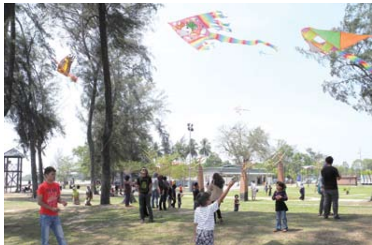
▲摩立海滩适合一家大小进行户外活动。