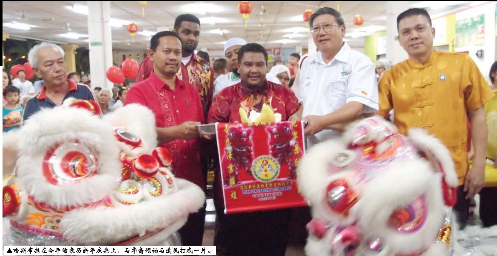
▲哈斯布拉在今年的农历新年庆典上，与华裔领袖与选民打成一片。

“至于妇女的问题也不容忽视，中心通过妇女能力中心（PWB）鼓励妇女走出厨房，如今共100名妇女通过该平台学习一技之长，经验共享。”