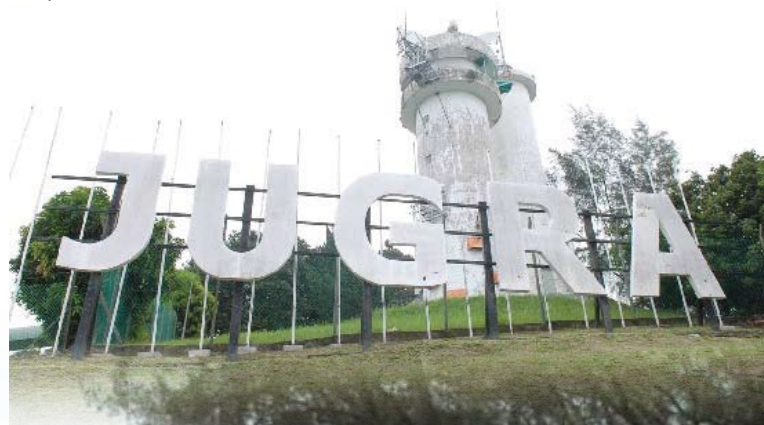
▼朱格拉山灯塔，吸引游客拍照留念。