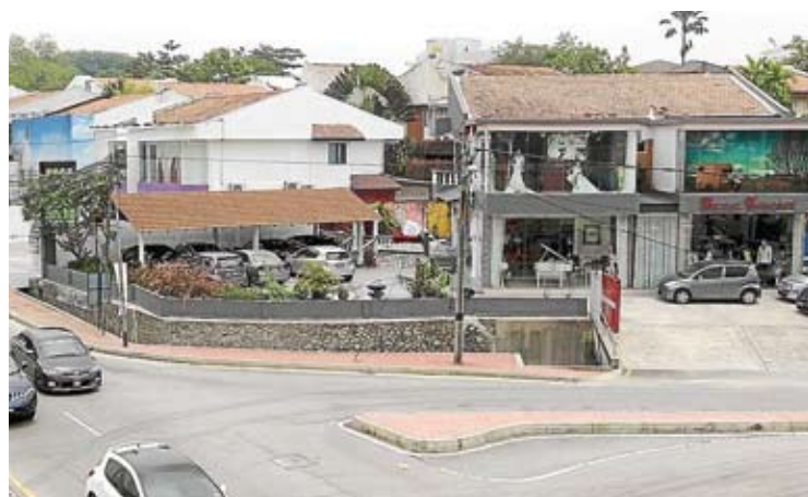
▲八打灵再也市政厅批准灵市一些旧区的住家单位转换为商业用途。