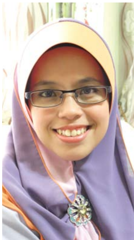
▲艾珂玛：积极助城市贫穷家庭提高收入。