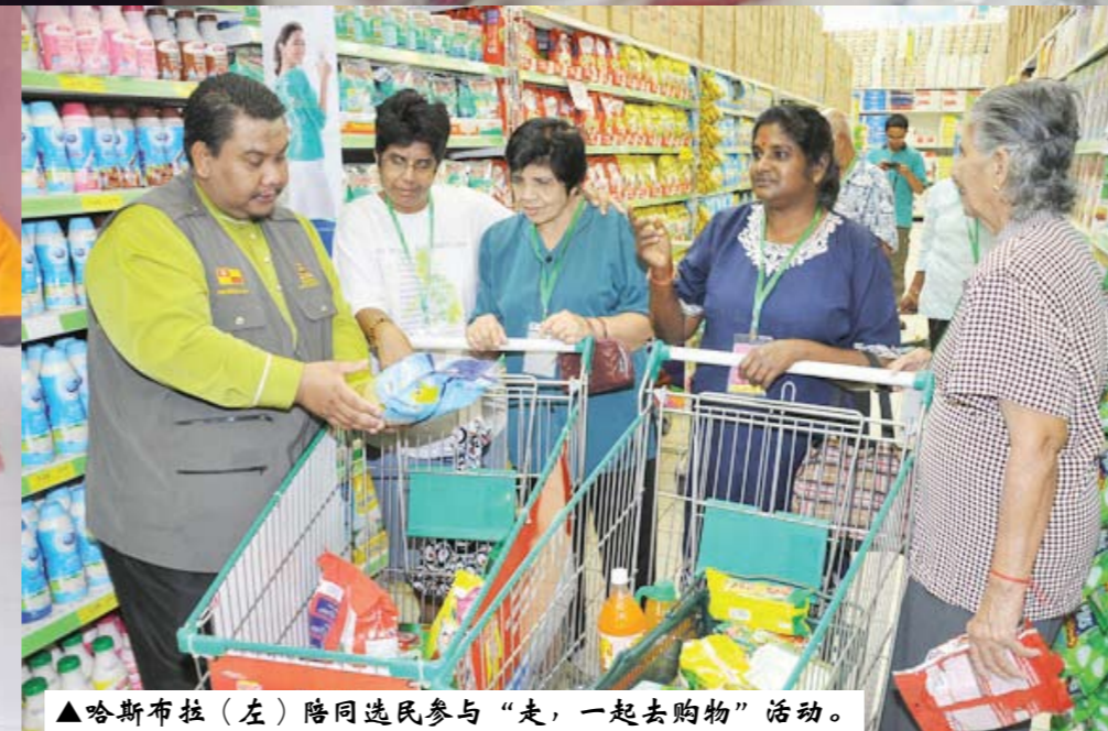
▲哈斯布拉（左）陪同选民参与“走，一起去购物”活动。