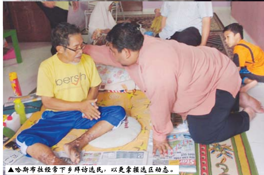
▲哈斯布拉经常下乡拜访选民，以更掌握选区动态。