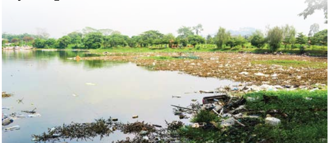
Taman Rekreasi Tasik Seri Aman yang menjadi pertikaian banyak pihak

PUCHONG - Majlis Perbandaran Subang Jaya (MPSJ) mendapati nama-nama pemilik di beberapa lot tanah dalam Taman Rekreasi Tasik Seri Aman bertukar nama.