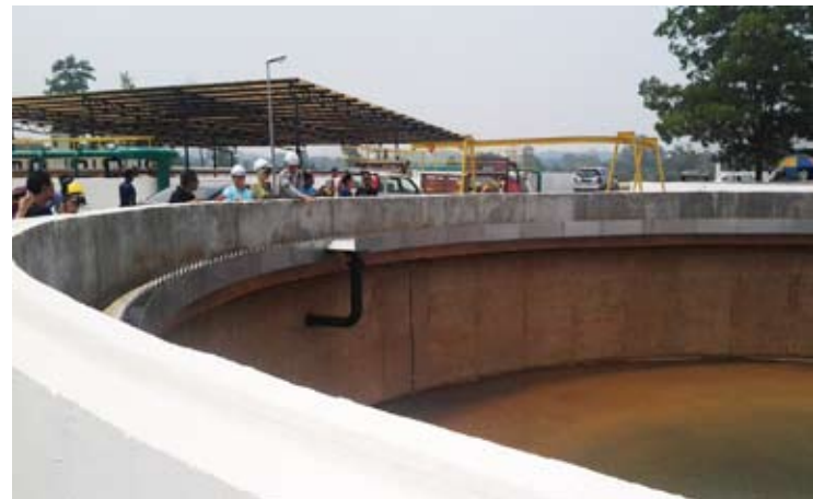
Loji rawatan kumbahan yang sedang dibaik pulih