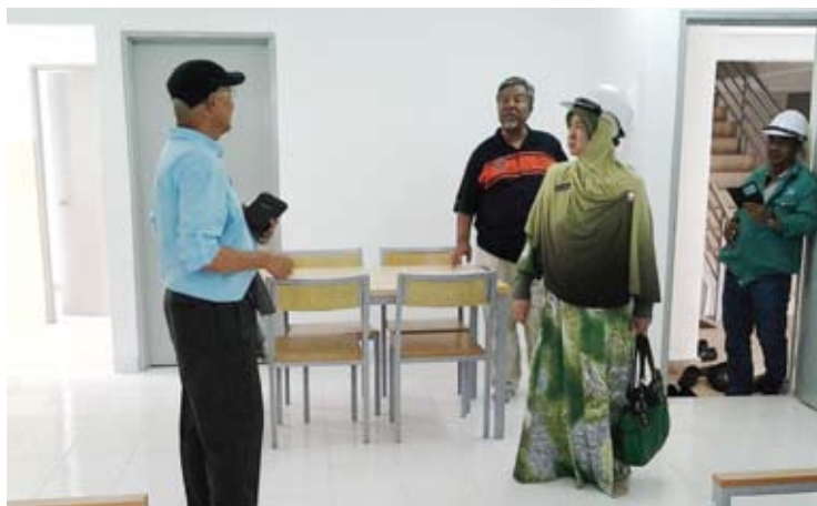
Meninjau asrama yang bakal menempatkan pelajar

“Sejak dibina sembilan tahun dahulu, memang STP ini tidak sempurna, ibarat gajah putih sahaja, ada tetapi tidak boleh berfungsi langsung. Sepatutnya ini tidak berlaku. Apapun kita sudah baik pulih,” katanya lagi.