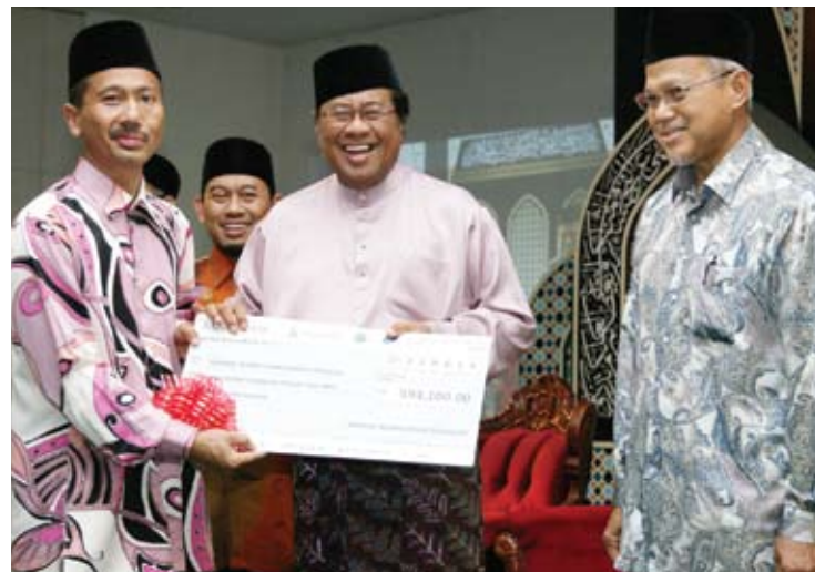
Sumbangan bernilai RM2.38 juta diagihkan kepada surau dan masjid di Selangor

Allahyarham menghembuskan nafas terakhir pada usia 39 tahun di IJN akibat komplikasi jantung selepas enam hari dimasukkan ke institut itu.