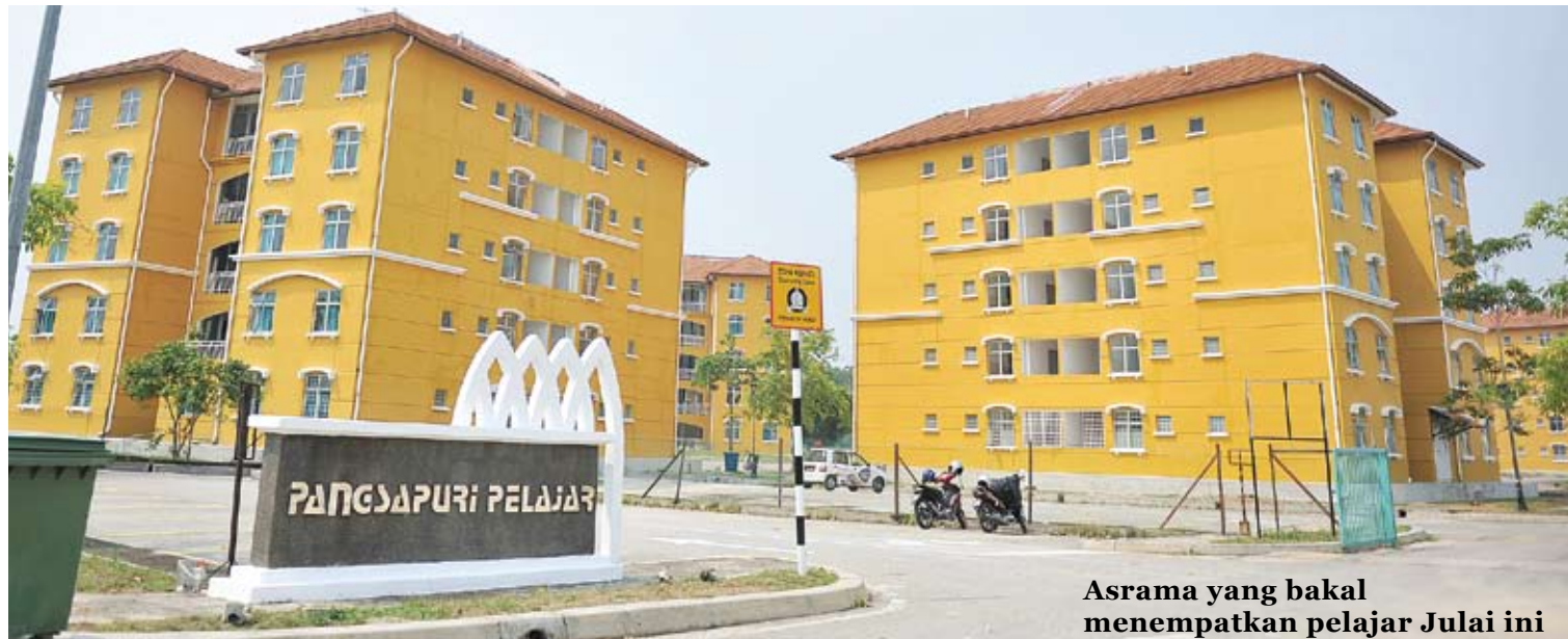
Asrama yang bakal menempatkan pelajar Julai ini

“Kita juga tidak boleh naikan tinggi, Kerajaan Negeri tidak benarkan,” katanya lagi.