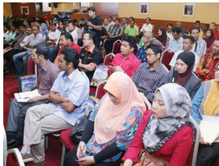
Antara peserta yang hadir ke majlis perasmian kursus perdana Skim Seroja

Manakala tenaga kerja bidan wanita dan pegawai kebajikan pula akan diselesaikan dalam dua tahun ini.