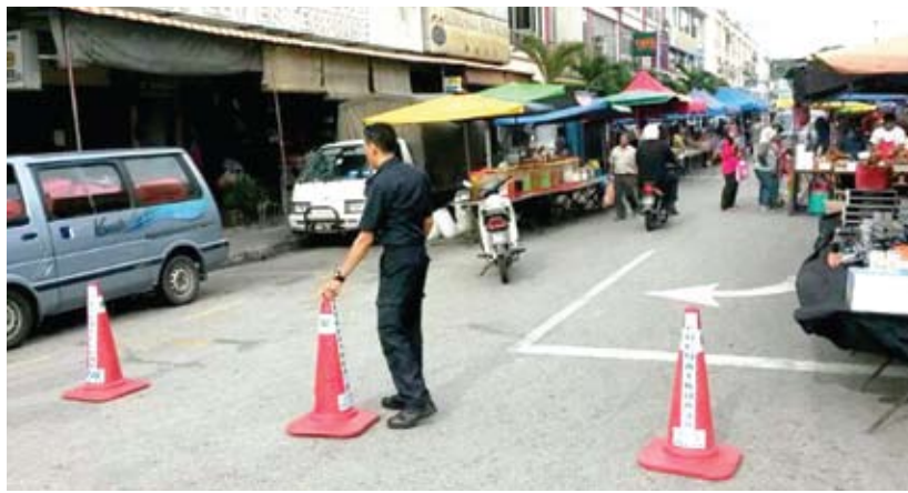
Kon diletakkan di sempadan tapak bagi mengelakkan peniaga berniaga di luar petak

pagi dan malam di bawah wilayah MPK berkembang pesat kerana diurus secara berkesan.