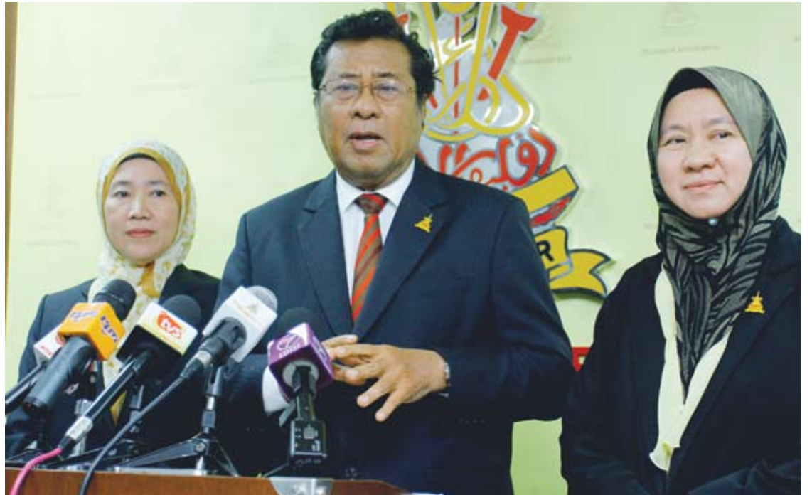
Menteri Besar sewaktu sidang media selepas Mesyuarat Exco Kerajaan Negeri

Majlis itu diadakan di peringkat pihak berkuasa tempatan bagi mendapatkan pandangan orang ramai dan dijadikan panduan kepada Kerajaan Negeri menyiapkan Belanjawan 2015.