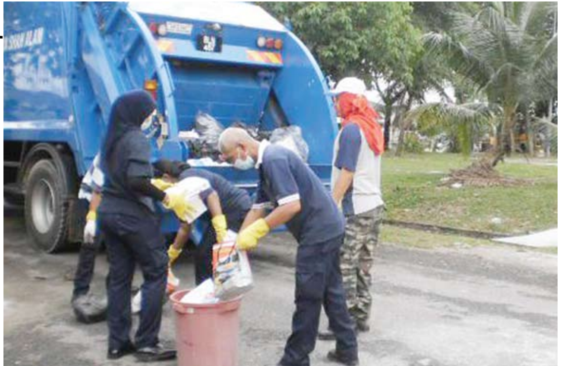
Menambah baik sistem sedia ada bagi memastika Shah Alam bersih dan selesa diduduki

MBSA mempunyai enam buah kompektor dan dijangka bertambah lagi dua menjelang hujung tahun ini bagi melancarkan kerja pengurusan sisa pepejal dan pembersihan awam.