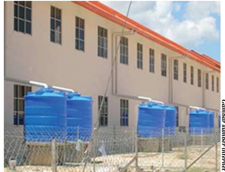
Gambar sumber internet

jumlah RM1.16 juta dan kapasiti simpanan air 2.3 juta gelen pada satu-satu masa, ia mengurangkan bil air di One Utama sehingga RM30,000 sebu-