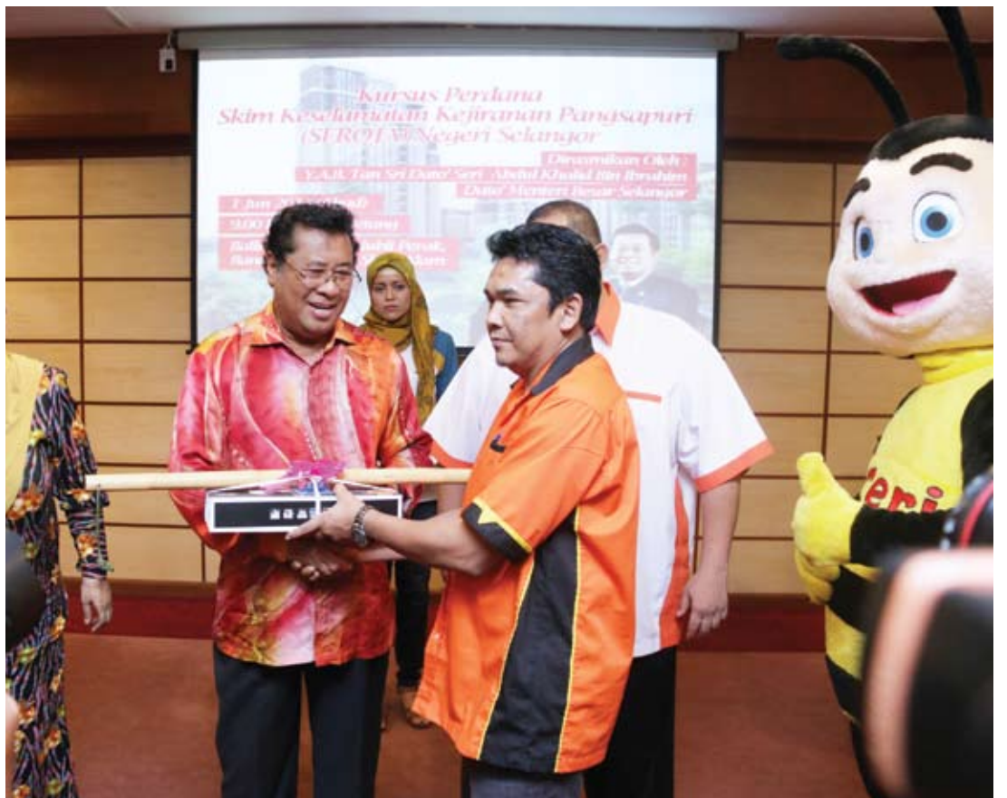
Menteri Besar, menyampaikan peralatan keselamatan kepada wakil pangsapuri

Tel : 03-5523 4856 Faks : 03-5523 5856 Emel: newsselangorkini@gmail.com