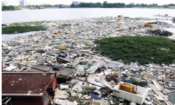
Keadaan sampah sarap yang menjijikkan pandangan