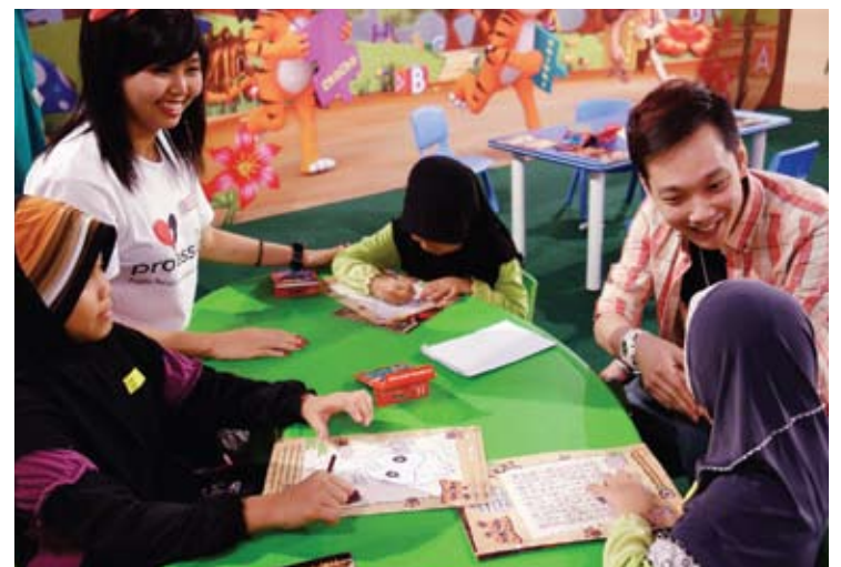
Pelajar proPassion beramah mesra dengan kanak-kanak Rumah Amal Suci Rohani

Kumpulan proPassion juga berjaya mengumpulkan dana hasil sumbangan orang ramai sejumlah RM6,500 untuk disalurkan kepada kedua-dua rumah amal itu.