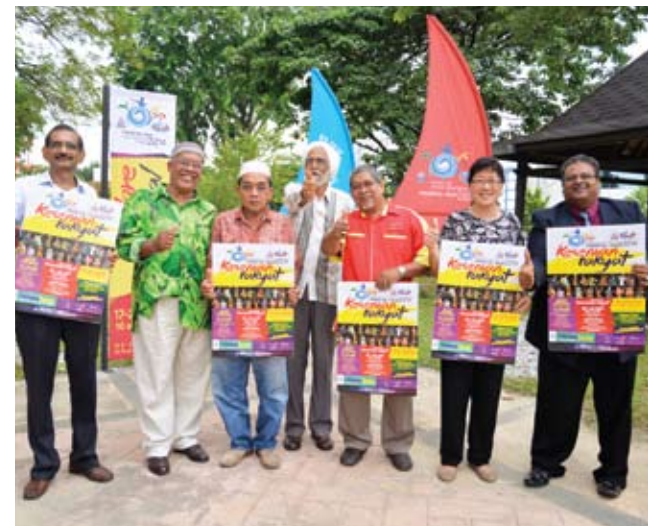
Penduduk juga turut membantu mempromosikan festival ini