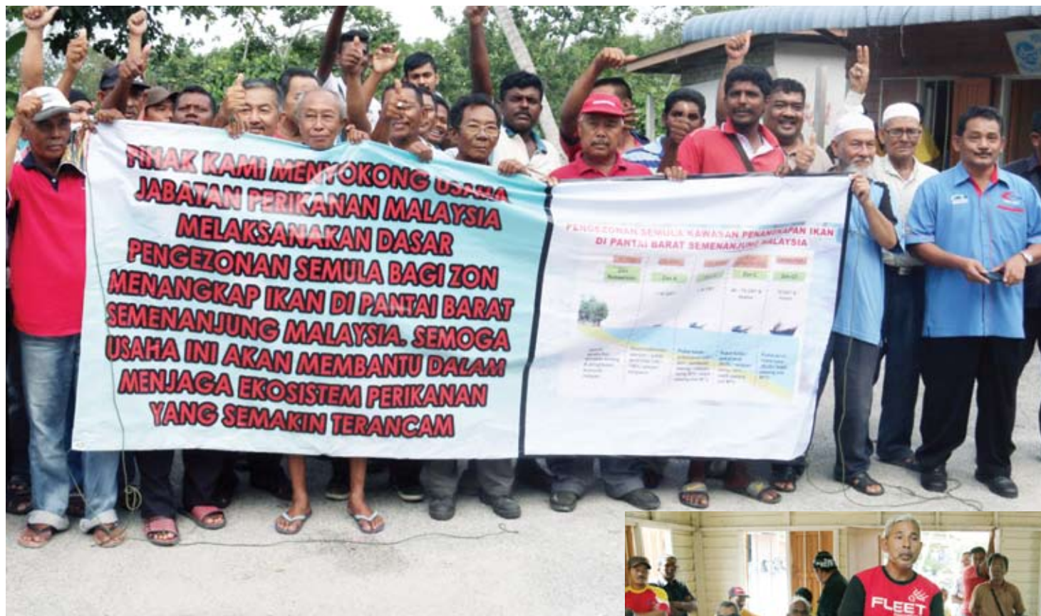
Nelayan lahirkan sokongan atas pengezonan semula kawasan penangkapan ikan. Kanan: Nelayan turut diberi peluang kemukakan pertanyaan

Melalui pengezonan ini, nelayan pukut tunda tidak lagi dibenarkan memasuki kawasan zon