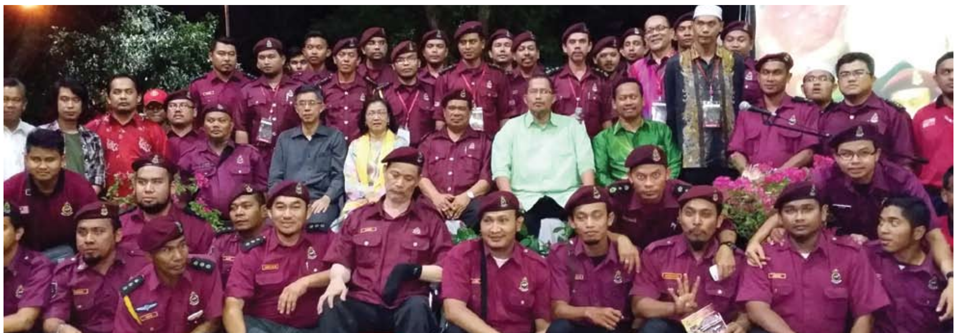
▲ Pimpinan Pakatan Rakyat bersama Pasukan Unit Amal Malaysia pada Majlis makan malam sempena Pelancaran Tabung Amal Malaysia di Petaling Jaya