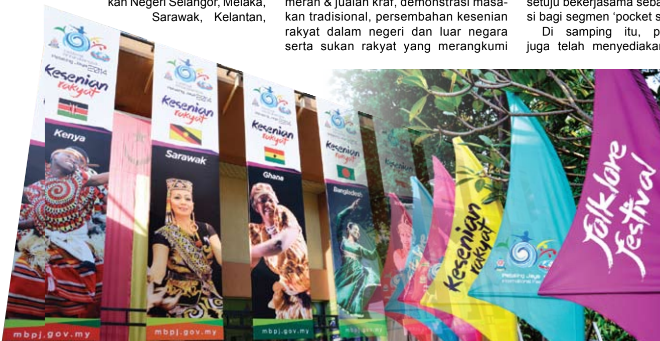
Bunting berwarna warni menghiasi Pusat Bandar Seksyen 52, Petaling Jaya

Sebarang pertanyaan dan maklumat lanjut orang ramai boleh menghubungi ditalian 03-7956 3544 sambungan 261/262/358 . Atau layari laman web petalingjayafair.mbpj.gov.my