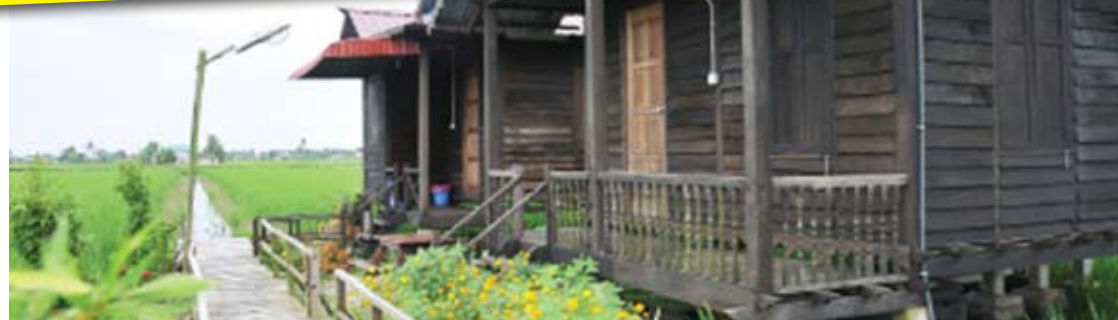
Industri rumah inap (homestay) antara tarikan pelancongan di Selangor

adalah usaha masyarakat tempatan sendiri.