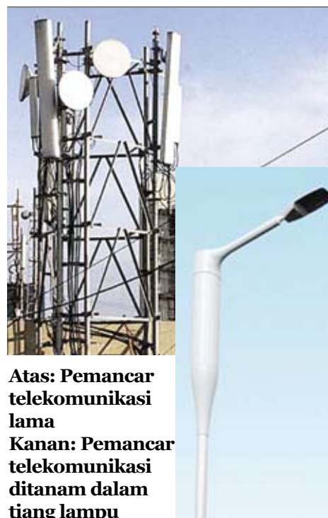
Atas: Pemancar telekomunikasi lama Kanan: Pemancar telekomunikasi ditanam dalam tiang lampu