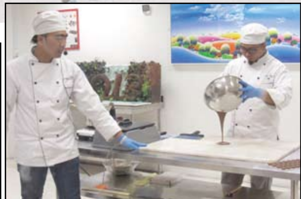
▲厨师向访客讲解及示范巧克力的制作过程。 ▲巧克力博物馆带孩子们上一堂轻松的课程。