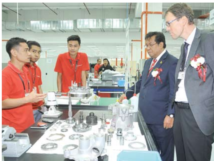
▲雪兰莪州的投资环境良好,成为海内外投资者的首选。