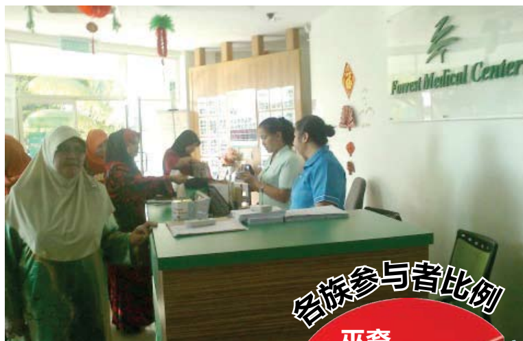
▲医疗中心负责人接待来自淡江区的参与者, 安排她们进行检查。

他说, 郊区缺乏网络便利, 当地妇女只能通过州议员服务中心获取资讯, 因此当局将主办汇报会或与妇女组织合作宣导健康知识, 让更多妇女知道州政府为她们提供的保健福利。