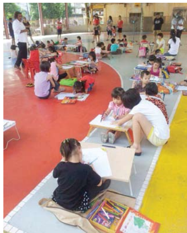
▲儿童填色比赛吸引20多名孩子参加。