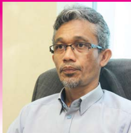
▲甘沙尼：协助提高妇女对健康检查的意识。