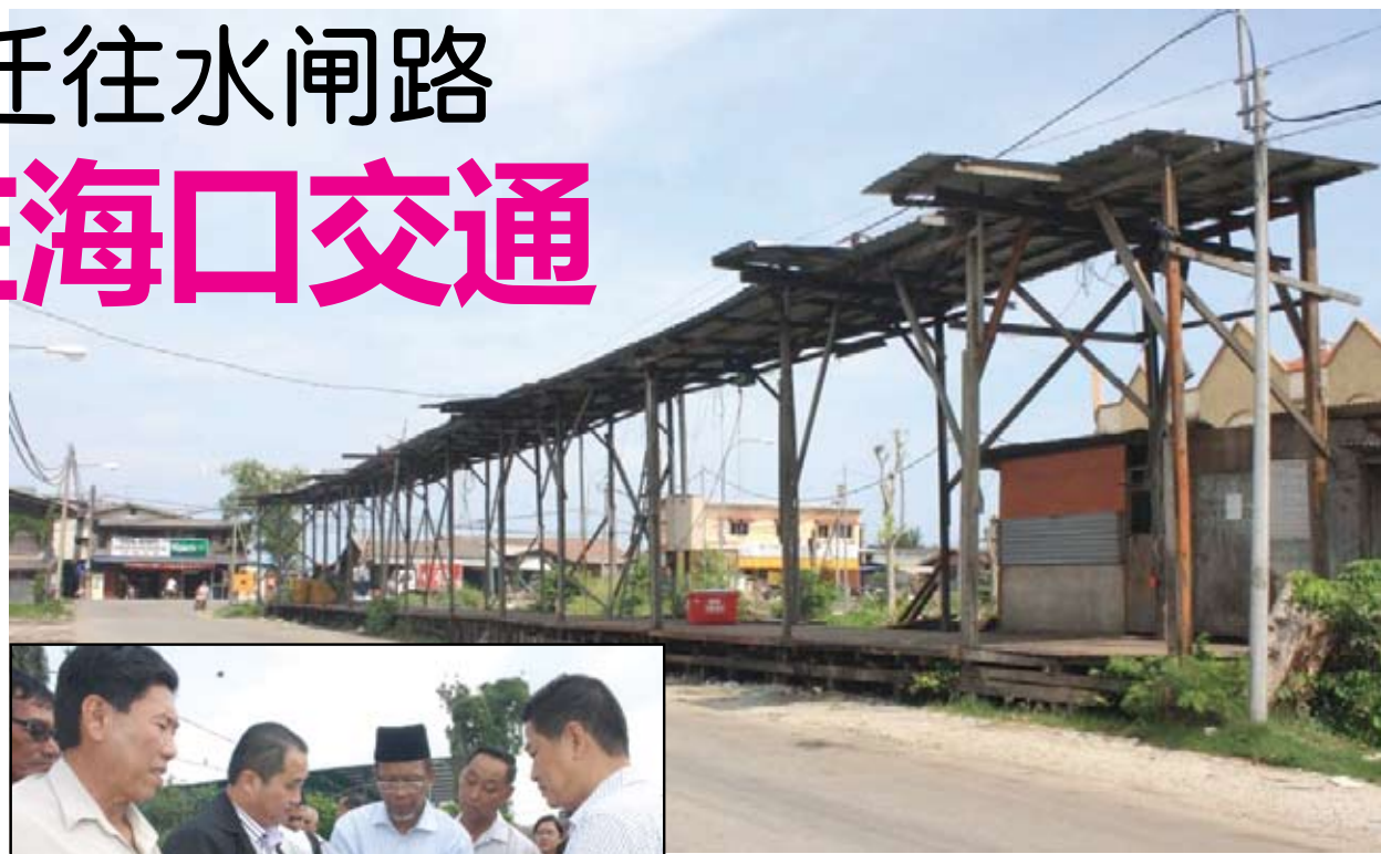
▲设于T字路口旁的渔获转运站被指阻碍交通。

他说，三苏丁经潮州会馆理事的解说后已口头赞成会馆提出的的申请，只是程序上需要跟进，呼吁