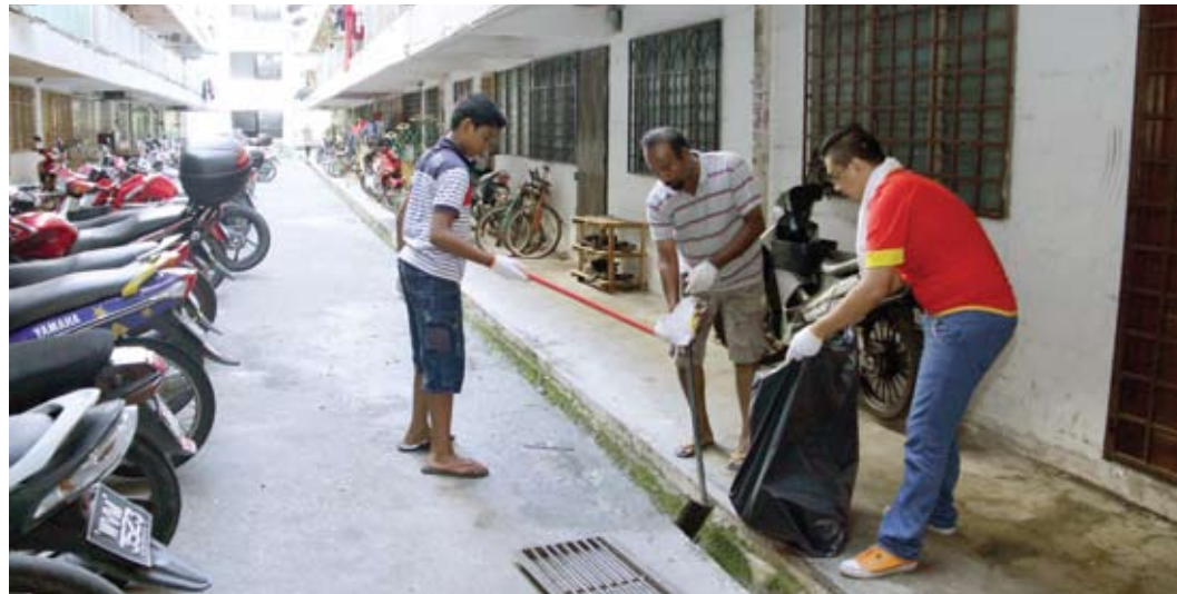
▲梳邦再也市议会呼吁民众照顾居家卫生,以杜绝骨痛热症的肆虐。