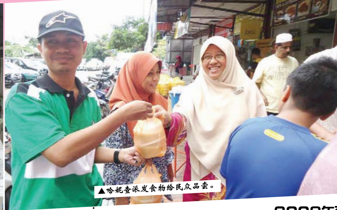
▲哈妮查派发食物给民众品尝。