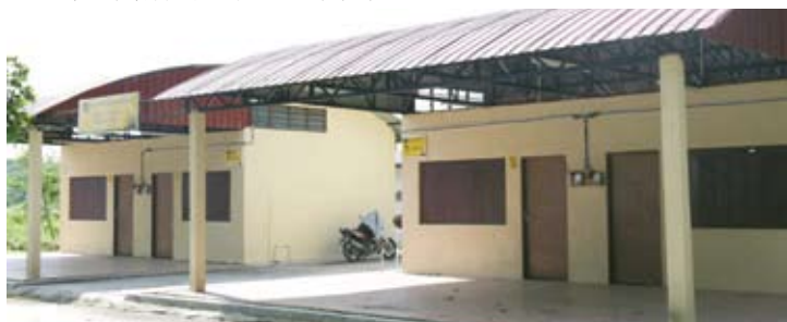
▲斯里安曼湖泊公园严重受污染，连累邻近的餐饮档也被逼关门大吉。

“湖泊表面堆满大量垃圾，经一段时日后便会干涸，再进行填土工程以作为其他发展用途。”