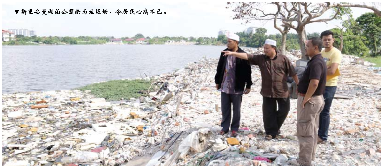
▼斯里安曼湖泊公园沦为垃圾场，令居民心痛不已。

“地方政府必须马上行动以修复湖泊原貌，人民也受促合作，不要再把湖泊当成‘垃圾桶’，破坏生态环境。”