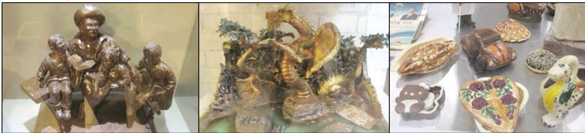
▼手工精细的巧克力艺术品，让人看了爱不释手。