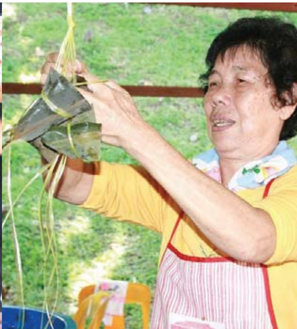
▲妇女全神贯注在万挠新村村委会的活动上裹粽子。