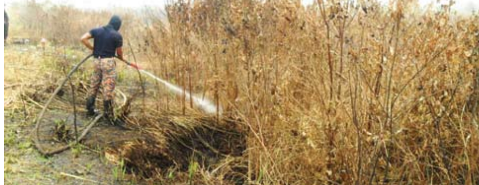
▲雪州政府与各单位积极配合,防范旱季期间的林火意外。