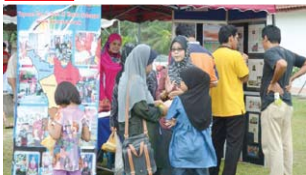
▲ 雪州微型贷款计划走入乡区,以协助更多小商家改善生活。