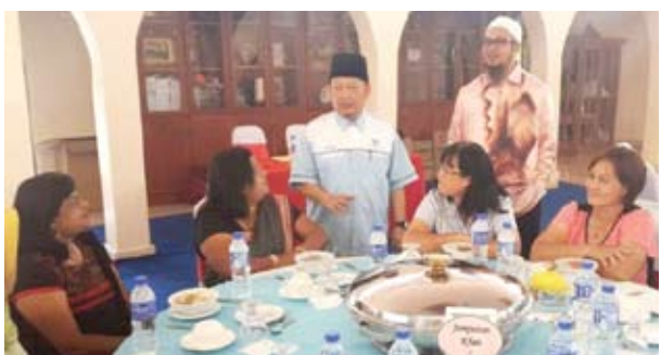
▲ 中路区州议员阿都加尼与华裔及印裔商家了解微型贷款计划的情况。