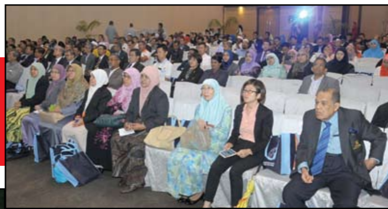
▼多名雪州议员以了解2015年雪州财政预算案概况。

他建议州政府可以要求垃圾承包商在特定日子,只分类收集普通垃圾和可循环使用的垃圾,培养民众的垃圾分类习惯。