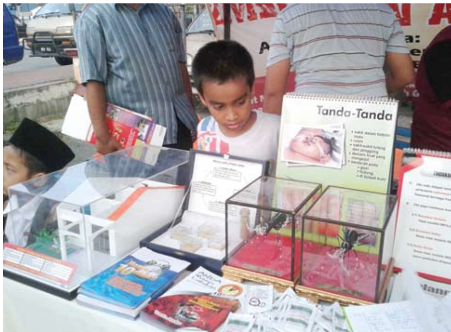
▲雪州政府积极向小学生灌输防范骨痛热症的醒觉。