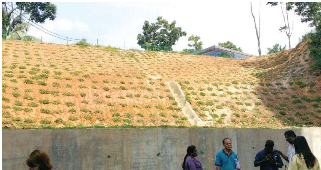
▲ 加影市议会破例首次拨款30万令吉，资助满卡伦玛斯公寓进行防崩墙建筑工程。

(无拉港讯) 加影市议会破例首次拨款30万令吉，资助满卡伦玛斯公寓进行防崩墙建筑工程，以免公寓泊车场斜坡旁的崩塌情况危及住户安全。