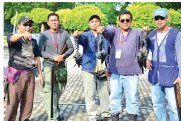
▲参赛者展示他们射杀的乌鸦。

他说，市议会将聆听民众提出的建议及看法来消灭乌鸦，甚至在它们投诉的乌鸦黑区装置捕捉器，以减少当地乌鸦的数量，避免衍生卫生问题。