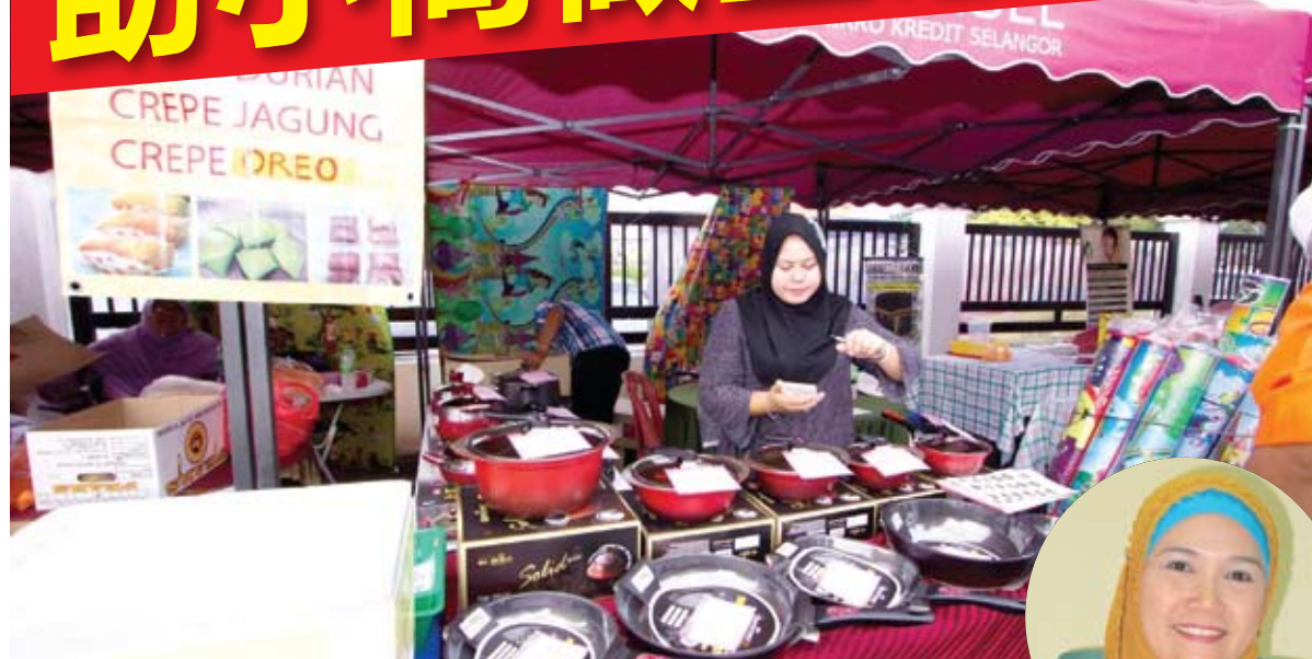
▲ 雪州微型贷款计划协助妇女开拓小生意。