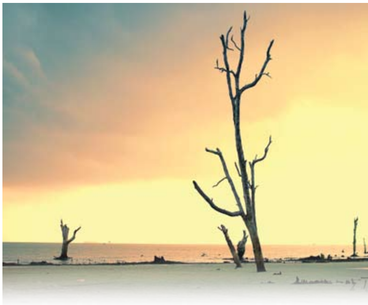
▲ 吉玲珑海滩是个具有发展潜能的旅游卖点。

万津市郊吉玲珑海滩 (Pantai Kelanang) 的魅力丝毫不亚于距离7公里外的摩立海滩，摩立区州议员哈斯努峇哈鲁丁矢言扩大吉玲珑海滩的知名度，使它成为雪州新景点，增强瓜冷县旅游的卖点。