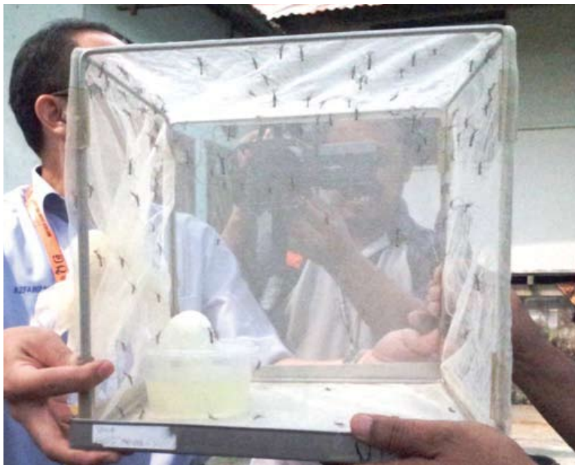
▲梳邦再也市议会希望通过释放巨蚊，克服黑斑蚊滋生的问题。

梳邦再也市议会早前与马来西亚理科大学合作，在特定住宅区释放金腹巨蚊，希望通过此方法能够在5个月至6个月内发挥“以蚊克蚊”的成效，减少该区的黑斑蚊及骨痛热症病例。