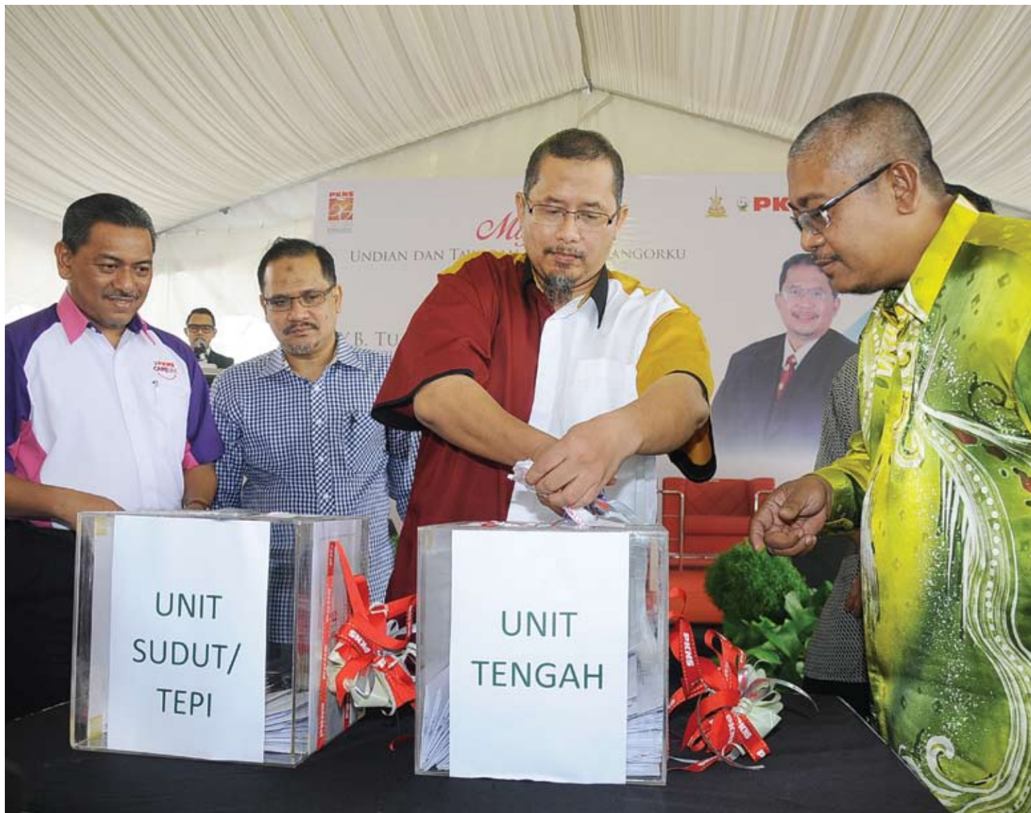
KOMITED... Iskandar memotong reben pada kotak undi sewaktu Majlis Undian dan Tawaran Rumah Selangorku Idaman PKNS yang dibangunkan perbadanan tersebut

"Usaha ini akan kita perlukan lagi bagi membolehkan rakyat menikmati hasil ekonomi Selangor," katanya di hadapan lebih 100 hadirin pada Majlis Undian dan Tawaran Rumah Selangorku Idaman Antara Gapi yang dibangunkan Perbadanan Kemajuan Negeri Selangor (PKNS), baru-baru ini.