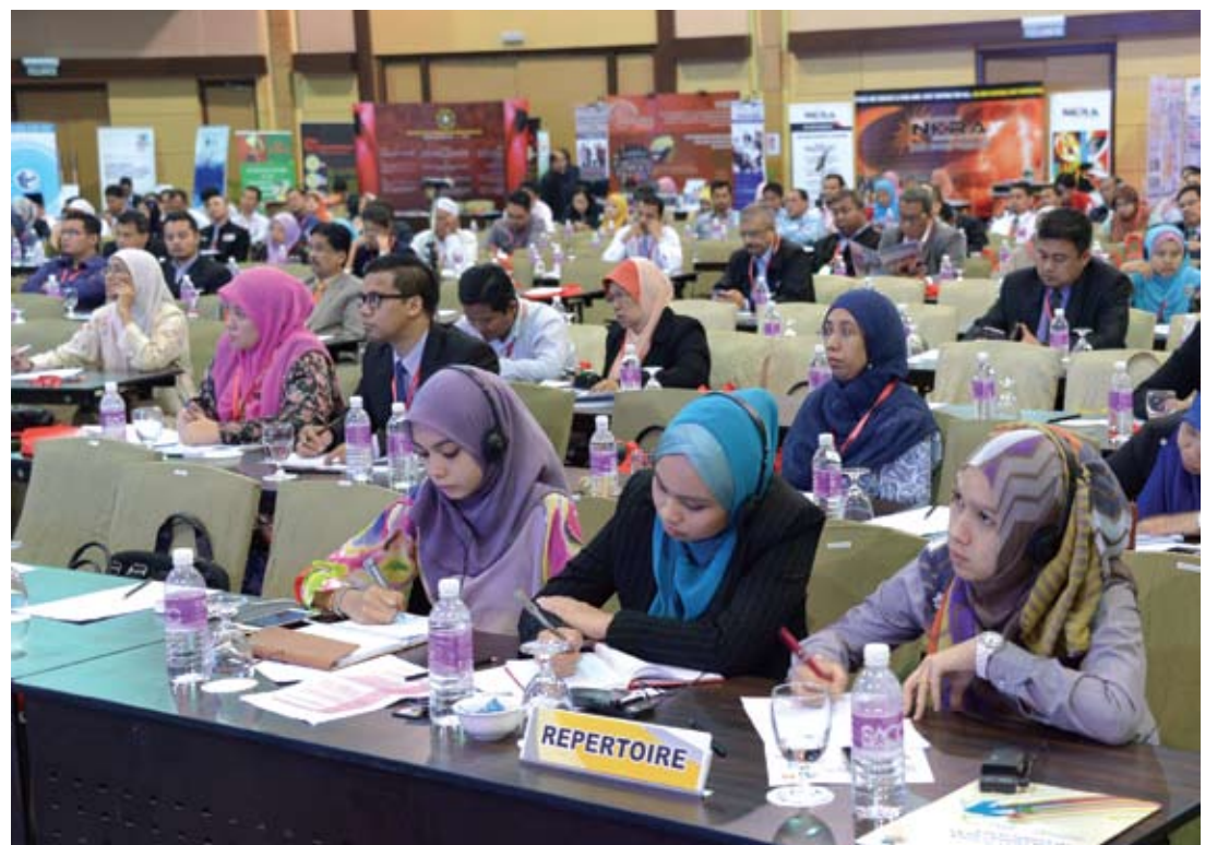
Sebahagian daripada peserta Persidangan Tahunan Integriti PKNS yang hadir

"Ta juga memberi kelebihan kepada nilai pulangan wang dan meningkatkan pengurusan risiko yang berkesan selain mengurangkan kos jangka panjang serta memberi daya tarikan yang lebih besar kepada institusi berkenaan dalam memastikan pembangunan ekonomi yang mampan," katanya lagi.