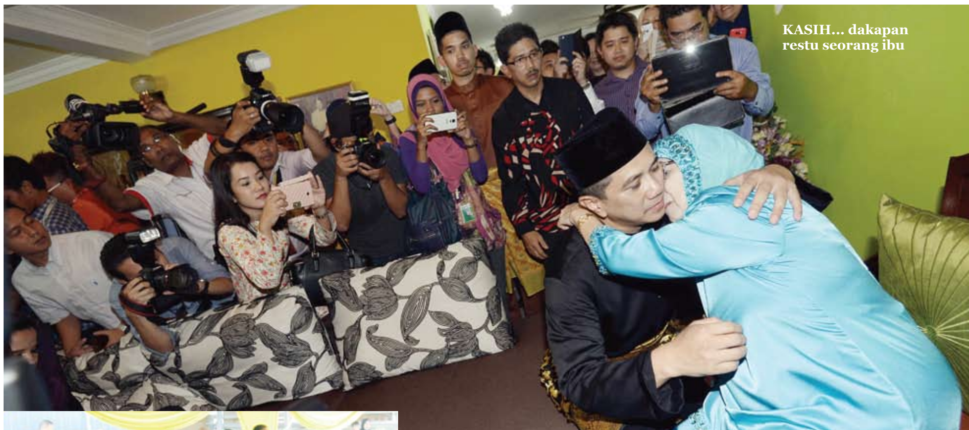
KASIH... dakapan restu seorang ibu