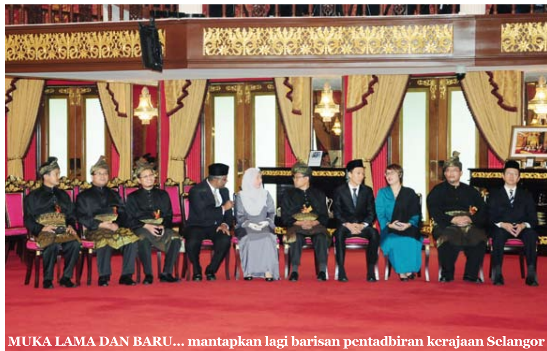
MUKA LAMA DAN BARU... mantapkan lagi barisan pentadbiran kerajaan Selangor

Calon Timbalan Speaker akan dilantik ketika DNS bersidang November depan.