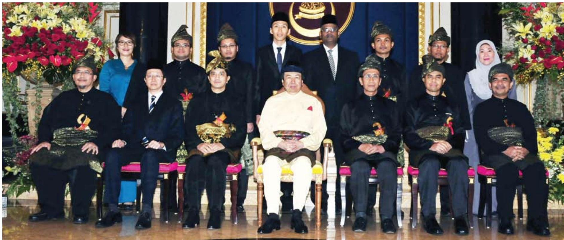
SEDIA GALAS TUGAS... barisan Exco lama dan baru bersama DYMM Sultan Selangor, Sultan Sharafuddin Idris Shah dan pimpinan kanan Kerajaan Negeri selepas majlis angkat sumpah di Istana Alam Shah, Klang