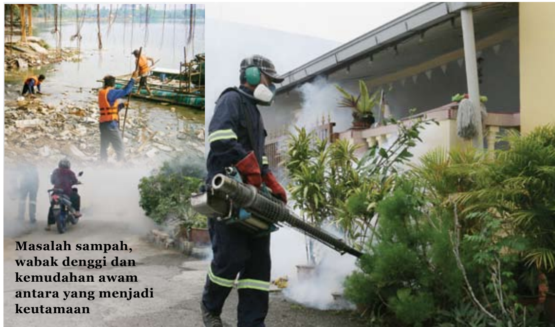
Masalah sampah, wabak denggi dan kemudahan awam antara yang menjadi keutamaan

GOMBAK - Menangani permasalahan sampah, penularan wabak denggi, keselamatan awam dan penyelenggaraan jalan ke tahap yang lebih berkesan mendapat keutamaan Menteri Besar Mohamed Azmin Ali.