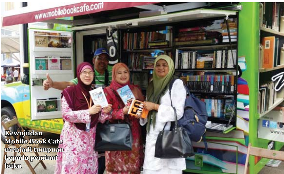
Kewujudan Mobile Book Cafe menjadi tumpuan kepada peminat buku