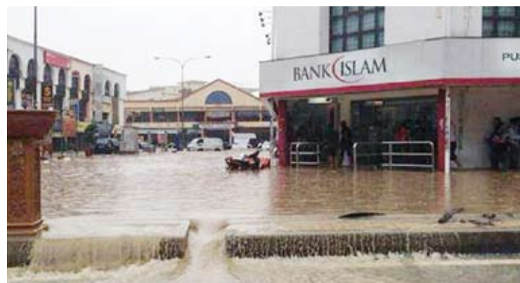
Banjir teruk melanda pekan Kajang baru-baru ini

"Mereka (MPKj) ada datang bersihkan tetapi seminggu atau sebulan sekali sahaja.