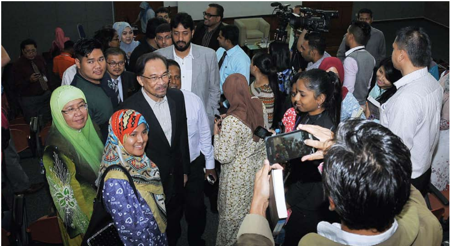
Mahasiswa dan kakitangan Unisel mengambil peluang bergambar bersama Anwar