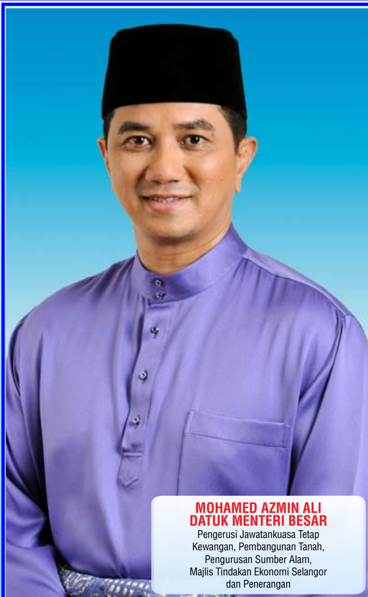
MOHAMED AZMIN ALI DATUK MENTERI BESAR Pengerusi Jawatankuasa Tetap Kewangan, Pembangunan Tanah, Pengurusan Sumber Alam, Majlis Tindakan Ekonomi Selangor dan Penerangan