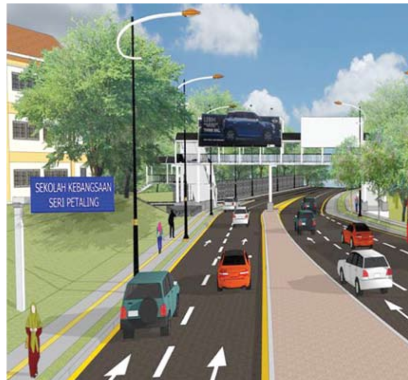
Gambaran keadaan di Jalan Utara sekiranya jalan sehala dilaksanakan di kawasan tersebut