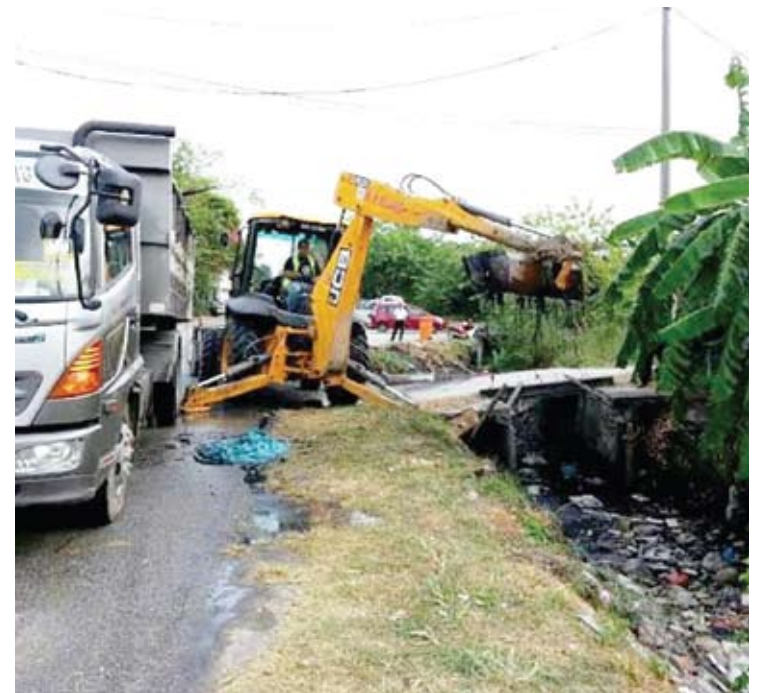
Kerja-kerja pembersihan giat dijalankan oleh MPK

KLANG - Majlis Perbandaran Klang (MPK) menganggarkan enam hingga tujuh tan sampah dikutip sekitar Pasar Pagi Jalan Papan.