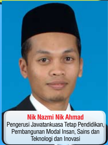
Nik Nazmi Nik Ahmad Pengerusi Jawatankuasa Tetap Pendidikan, Pembangunan Modal Insan, Sains dan Teknologi dan Inovasi