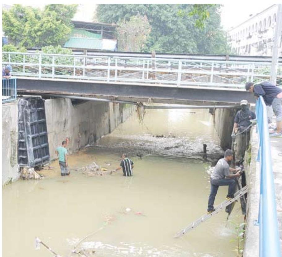
Sungai Kajang tidak mampu menampung limpahan air setiap kali hujan lebat

Baru-baru ini, hujan lebat selama lebih sejam menyebabkan beberapa kawasan termasuk pekan Kajang dan Kampung Sungai Kantan dilanda banjir kilat.