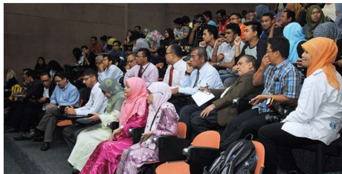
Sebahagian daripada kakitangan dan mahasiswa Unisel yang hadir