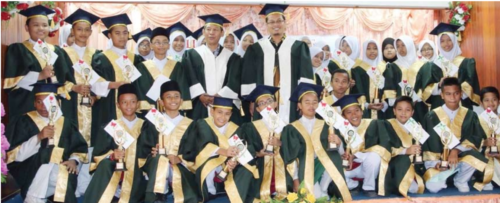
▲ Hari Kecemerlangan Pelajar SRA Ehyaul Falah, Sungai Besar. Exco Pendidikan, Pembangunan Modal Insan, Sains dan Teknologi dan Inovasi, Nik Nazmi Nik Ahmad, meraikan seramai 38 orang pelajar yang berjaya mendapat keputusan muntaz dalam PSRA 2014