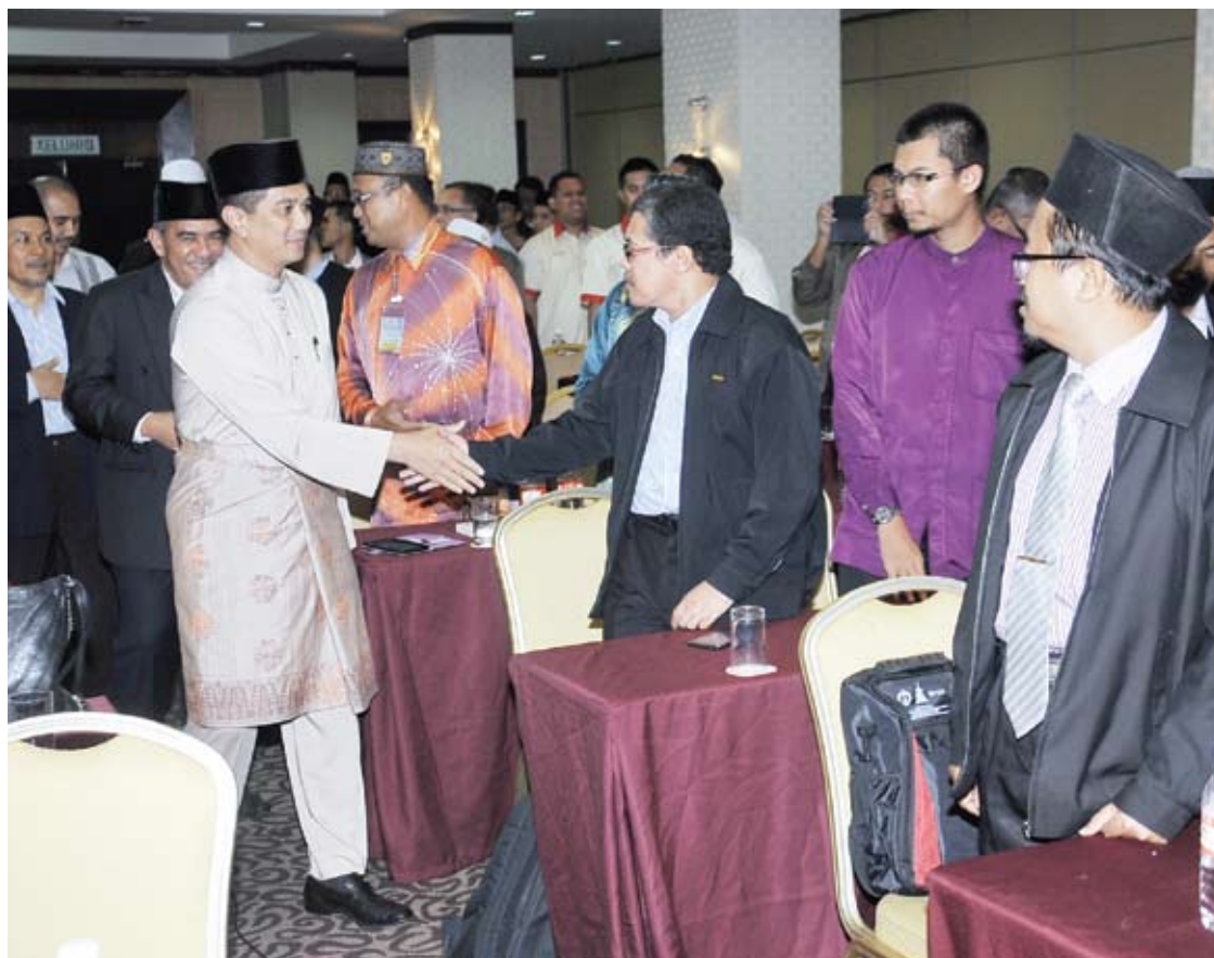
Dato' Menteri Besar bersalaman dengan kakitangan dan pengetua sekolah tahfiz aliran sains

Beliau berkata, kepimpinan SAM Tahfiz Aliran Sains perlu lebih serius membudaya al-Quran termasuk hafazan dan kefahaman serta pembelajaran sains dan teknologi.