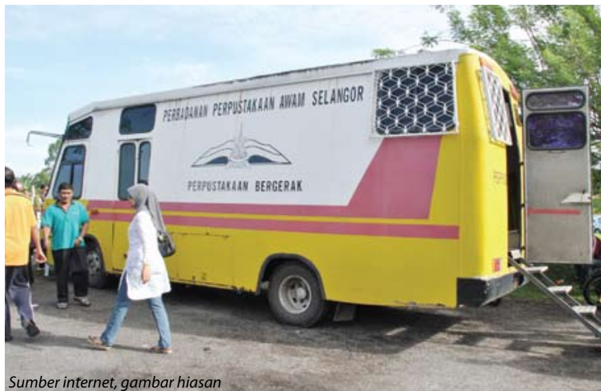
gambar hiasan