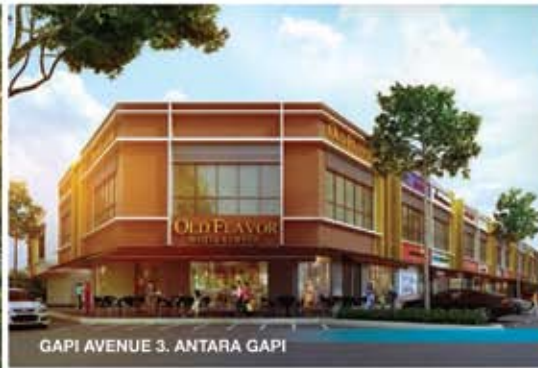
GAPI AVENUE 3, ANTARA GAPI