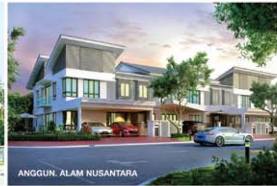
ANGGUN, ALAM NUSANTARA