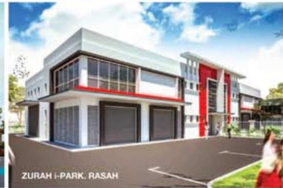
ZURAH I-PARK, RASAH