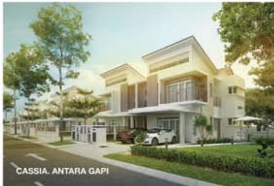
CASSIA, ANTARA GAPI