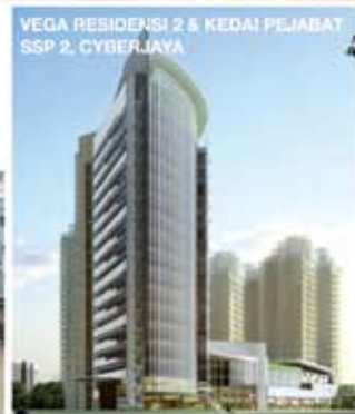
VEGA RESIDENSI 2 & KEDAI PEJABAT SSP 2, CYBERJAYA