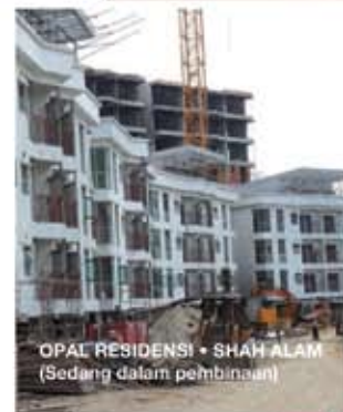
OPAL RESIDENSI • SHAH ALAM (Sedang dalam pembinaan)