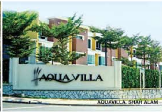
AQUAVILLA, SHAH ALAM