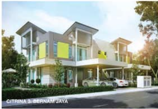
CITRINA 3, BERNAM JAYA

Kunjungi kami dari 27 Feb - 8 Mac 2015 • 10 pagi - 8 malam