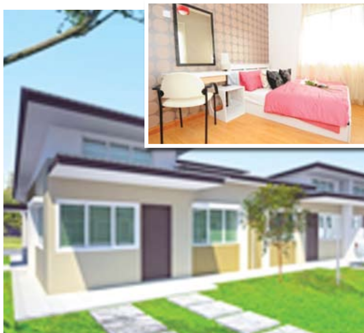
Pelaksanaan projek perintis rumah Selangorku di Antara Gapi, Serendah

"Sasaran keseluruhan ialah 35,000 unit siap menjelang 2018. Sebanyak 8,402 unit akan dilancarkan selewat-lewatnya April ini," katanya.