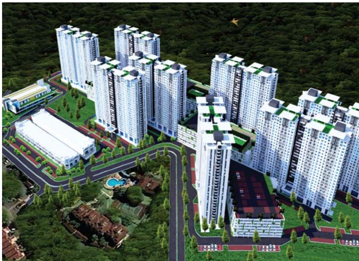
Perlaksanaan projek perintis rumah Selangorku di Taman Ukay Indah, Sungai Sering

Iskandar mengulangi komitmen Kerajaan Selangor untuk memperbanyak rumah mampu milik kepada rakyat negeri ini.