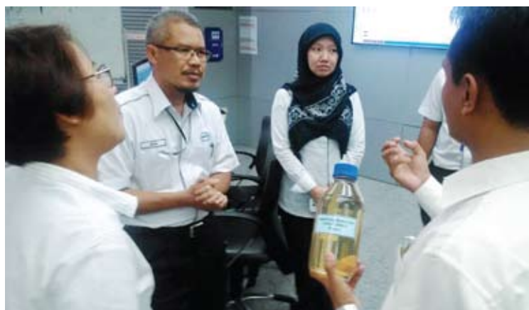
Zaidy ke Loji Pembersihan Sungai Semenyih untuk dapatkan maklumat terbaru berkenaan pencemaran mangan dan ammonia