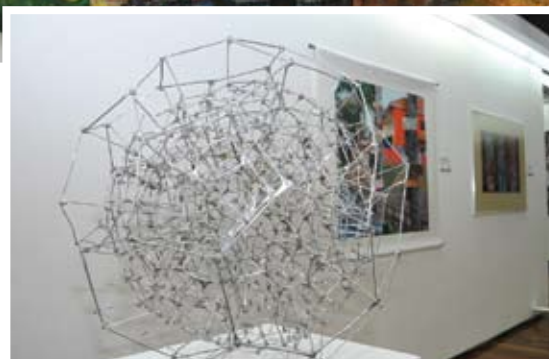
Pelbagai bentuk lukisan dipamerkan