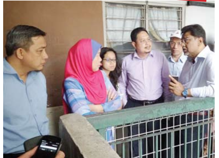
Ahli jawatankuasa SELCAT meninjau keadaan rumah PPR