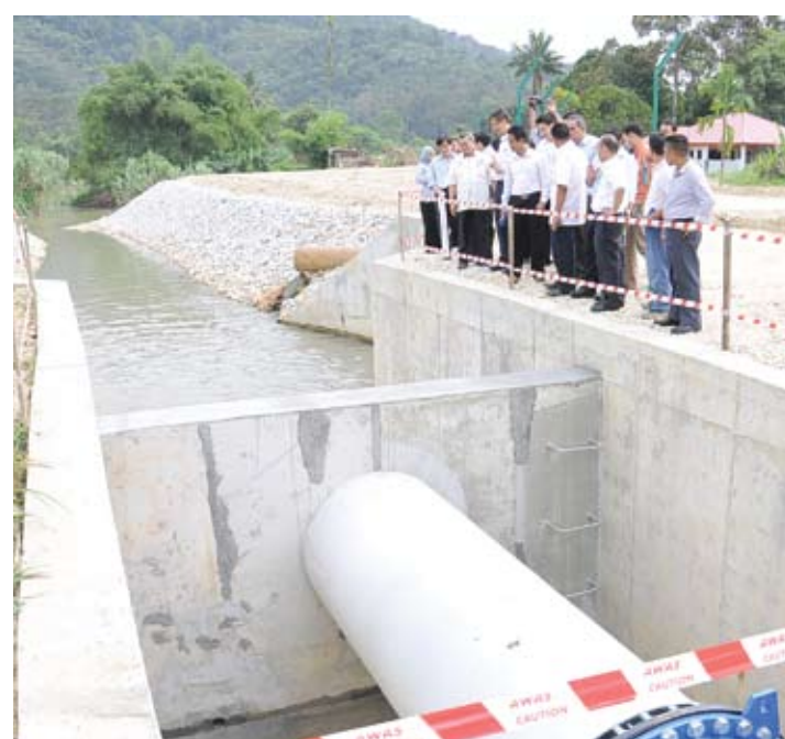
Zaidy sewaktu melawat Tapak Projek Penyaluran Air Mentah Paip Pahang- Selangor (PPAMPS) 1800mm dari 'Tunnel Outlet' ke Sungai Langat.

"Bacaan di empangan tidak membimbangkan. Bagaimanapun, kita berhati-hati terhadap keadaan luar jangka," katanya.