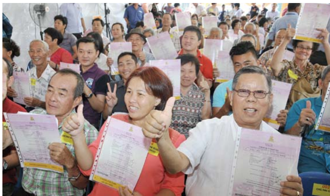
Mereka menganggap pemberian ini sebagai hadiah Tahun Baru Cina yang cukup bermakna