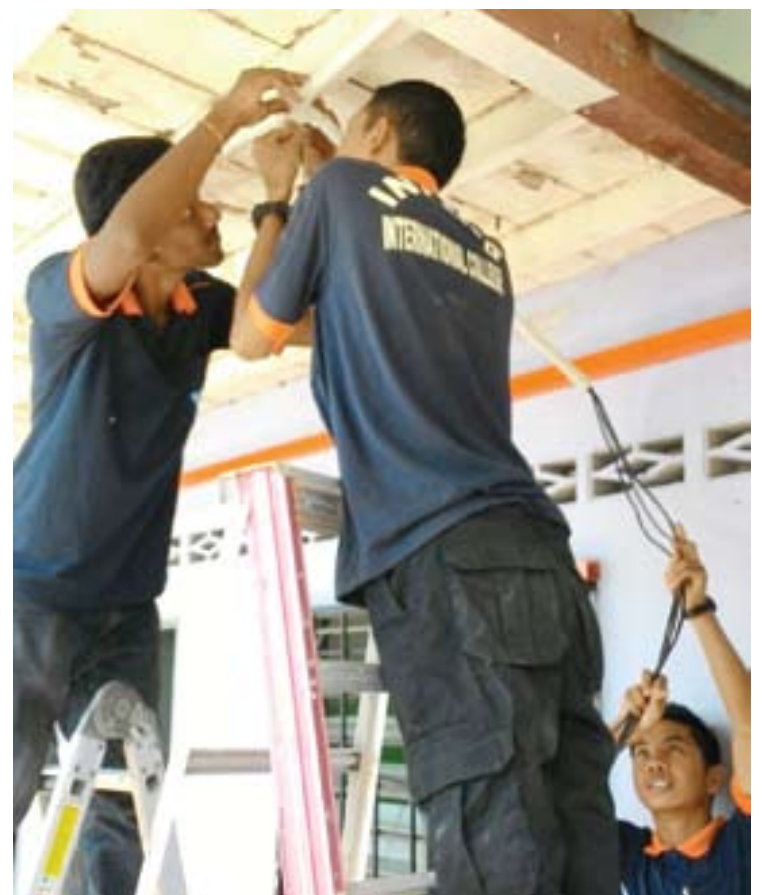
Pelajar Kolej INPENS membantu memasang semula litar pendawaian elektrik di Maahad Tahfiz Quran al Ansar Kampung Asahan yang rosak dipukul ribut

Untuk maklumat lanjut, boleh melayari www.inpens.edu.my atau hubungi 03-3281 2619.