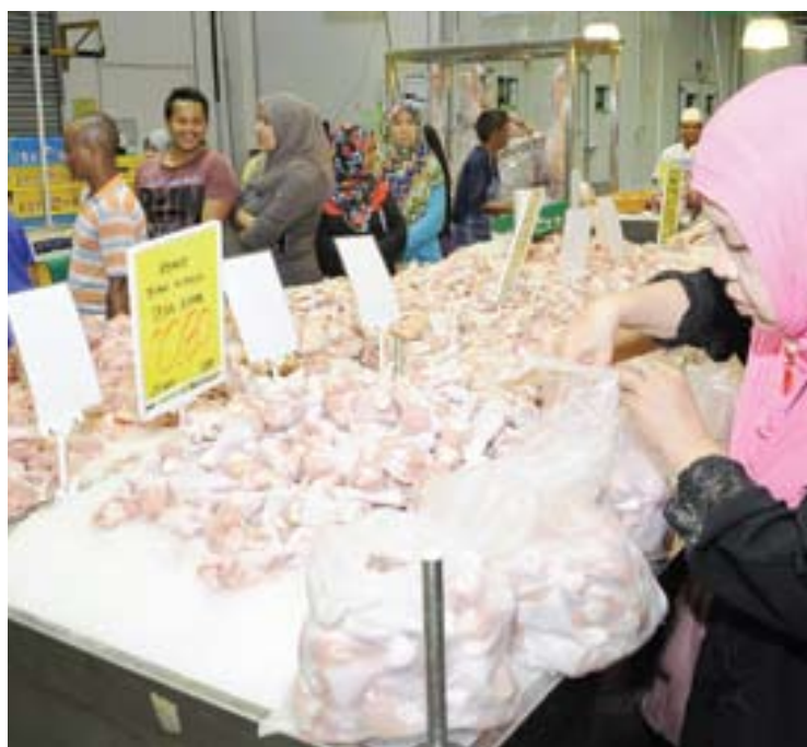
Peniaga berpeluang memasarkan produk di pasar raya bagi meluaskan pasaran tempatan

Portal segifresh 2u.com membantu peniaga membeli pukal melalui e-dagang selain