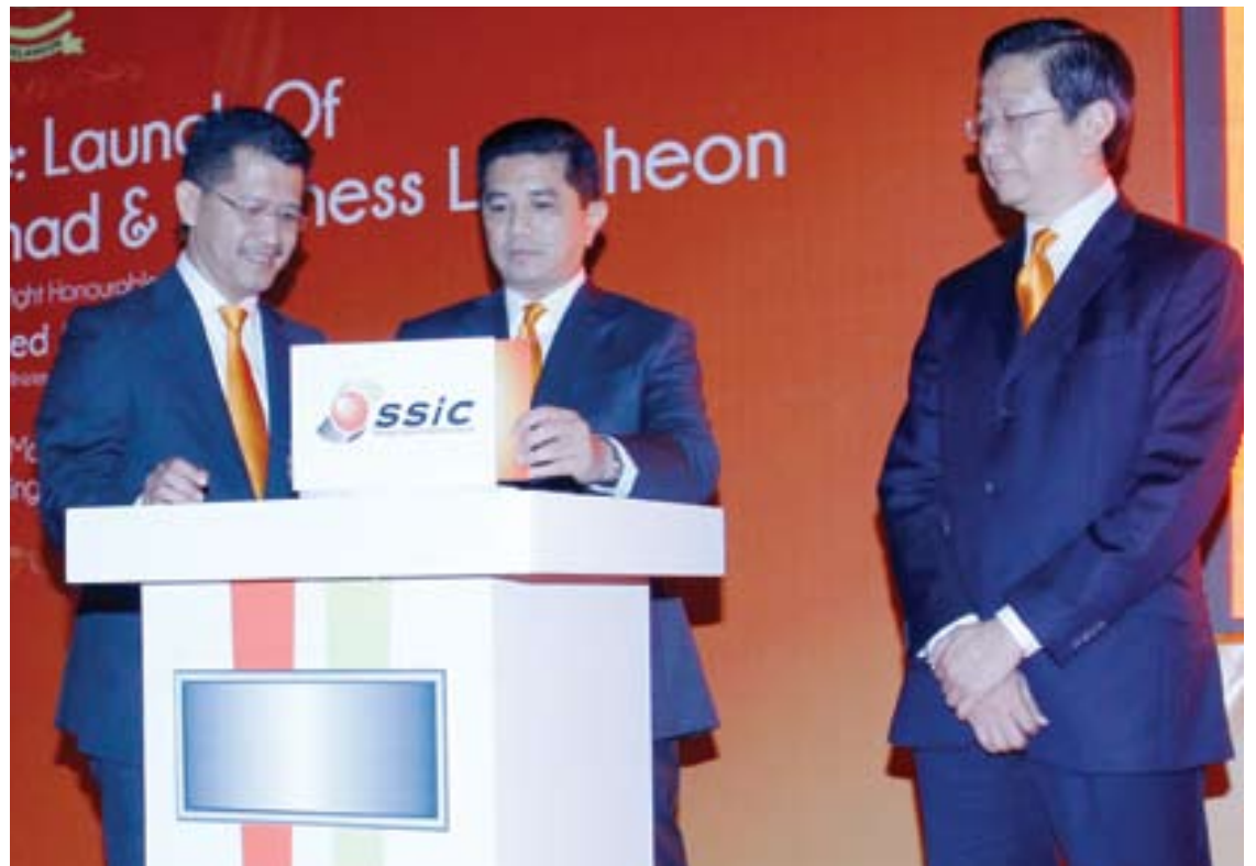
Dato' Menteri Besar melancarkan imej baharu Invest Selangor Berhad di Hotel Hilton Petaling Jaya

Sepanjang itu, RM60.45 bilion ialah pelaburan tempatan dan RM57.30 bilion pelaburan asing manakala 328,168 potensi peluang pekerjaan wujud.