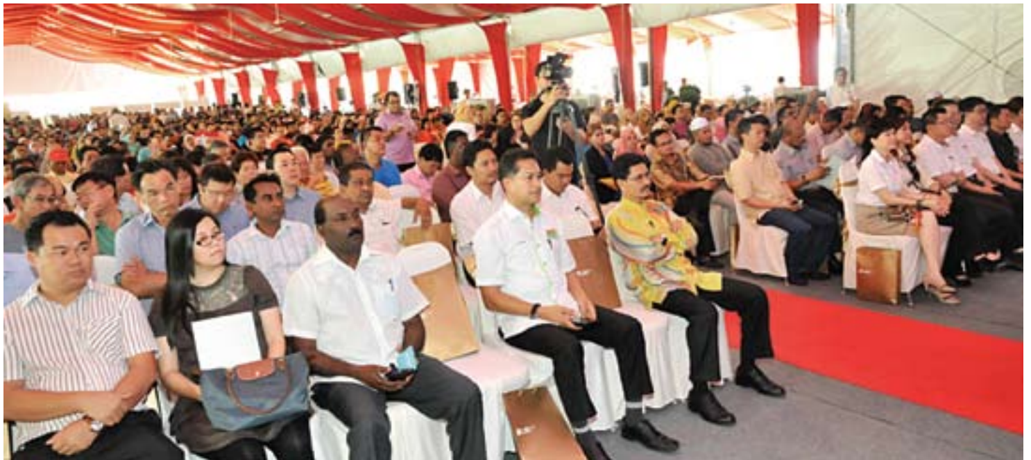
Bakal pembeli mendengar penjelasan Rumah Mampu Milik di Majlis Pelancaran Rumah Selangorku di Bandar Saujana Putra

Mereka membanjiri Majlis Pelancaran Rumah Selangorku di Bandar Saujana Putra sekaligus melebihi bilangan pemohon melebihi unit yang ditawarkan.