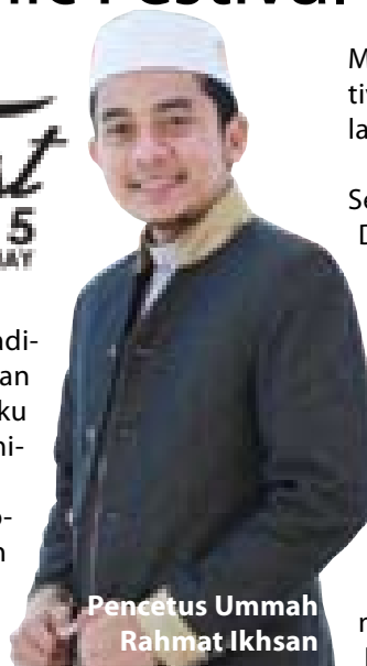
Pencetus Ummah Rahmat Ikhsan

Mohamed Azmin Ali dan tirai festival ditutup dengan Malam Selangor Berselawat 2015.