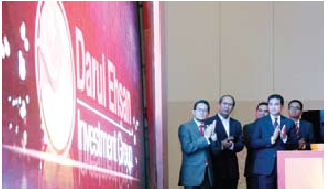
Dato' Menteri Besar melancarkan Agenda Makmur Selangor (AGENDA) dan penubuhan Kumpulan Pelaburan Darul Ehsan (DEIG) bagi membantu Kerajaan Negeri mengurus tadbir ekonomi Selangor ke tahap lebih maju di Pusat Konvensyen Shah Alam (SACC) Shah Alam

"Sebagai jaminan, Kerajaan Negeri tuntas melaksanakan kebijakan yang peduli rakyat berasaskan prinsip keuntungan berasaskan tanggungjawab sosial," katanya.