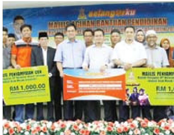
Bantuan Pendidikan bagi menaiktaraf sekolah serta manfaat pelajar di daerah Hulu Langat

Beliau berkata demikian selepas Majlis Agihan Bantuan Sekolah 2015 peringkat Hulu Langat, 19 Mei lalu.