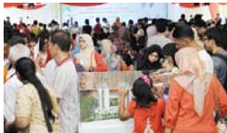
Rumah Selangorku menerima sambutan hangat orang ramai