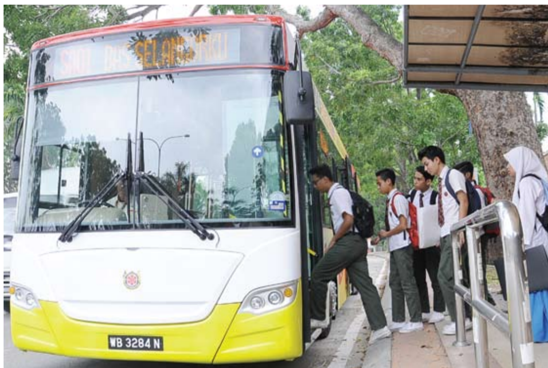
Kemudahan disediakan Kerajaan Selangor patut dimanfaatkan orang ramai