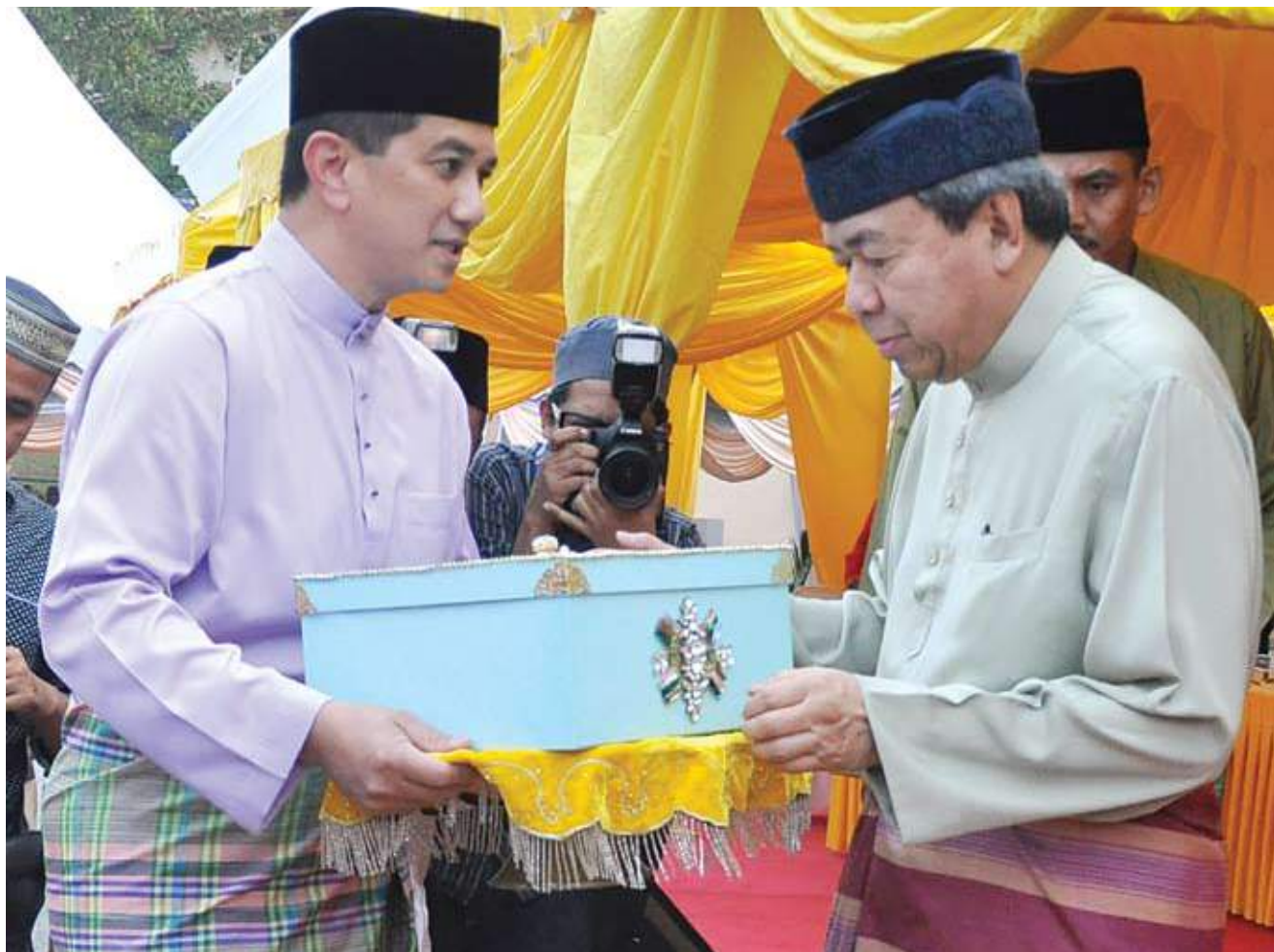
Dato' Menteri Besar, Mohamed Azmin Ali yang juga Adun Bukit Antarabangsa menyampaikan cenderahati kepada DYMM Sultan Sharafuddin Idris Shah yang berkenan merasmikan Masjid Bukit Antarabangsa.