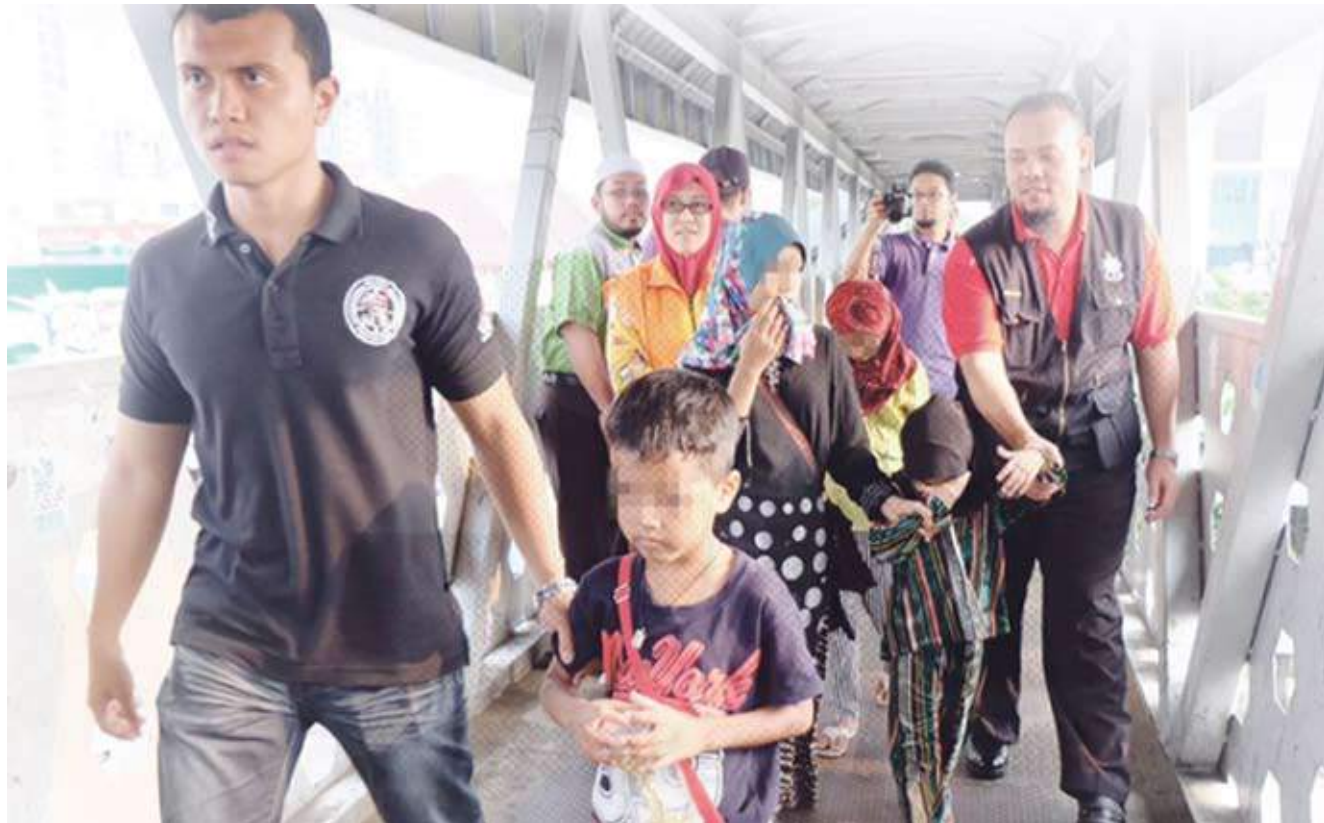
Penguatkuasa MPAJ menahan beberapa kanak-kanak dipergunakan disyaki untuk mengemis ketika melaksanakan operasi di sekitar Ampang

Selain itu, melalui email di aduan@mbpj.gov.my atau sistem pesanan ringkas di 33213, Faks 03-79551804 atau Facebook MBPJ Aduan.