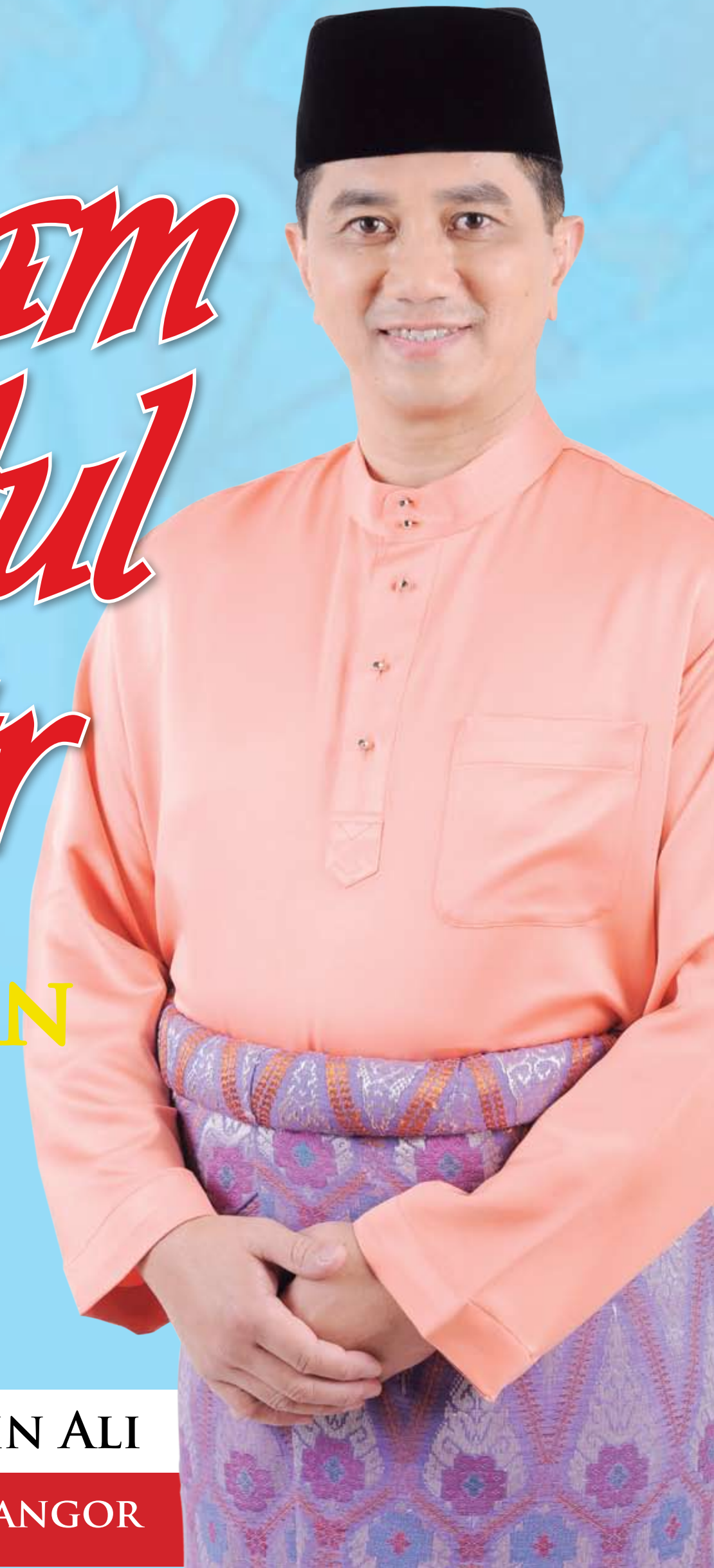
YAB MOHAMED AZMIN ALI DATO' MENTERI BESAR SELANGOR