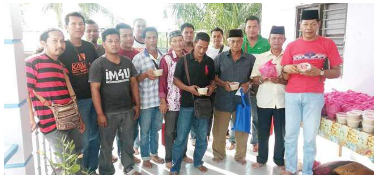
Adun Bukit Melawati, Jakiran Jacomah bersama kumpulan nelayan Kampung Assam Jawa bagi menyampaikan sumbangan Hari Raya dan mengagihkan sumbangan Bubur Lambuk untuk berbuka puasa