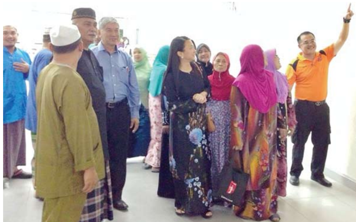
▶ Adun Subang Jaya, Hannah Yeoh bersama Persatuan Penduduk Pangsapuri Indah Court di PJS 11 Sunway bagi kerja naik taraf di pangsapuri dan dewan orang ramai untuk pelbagai kegunaan