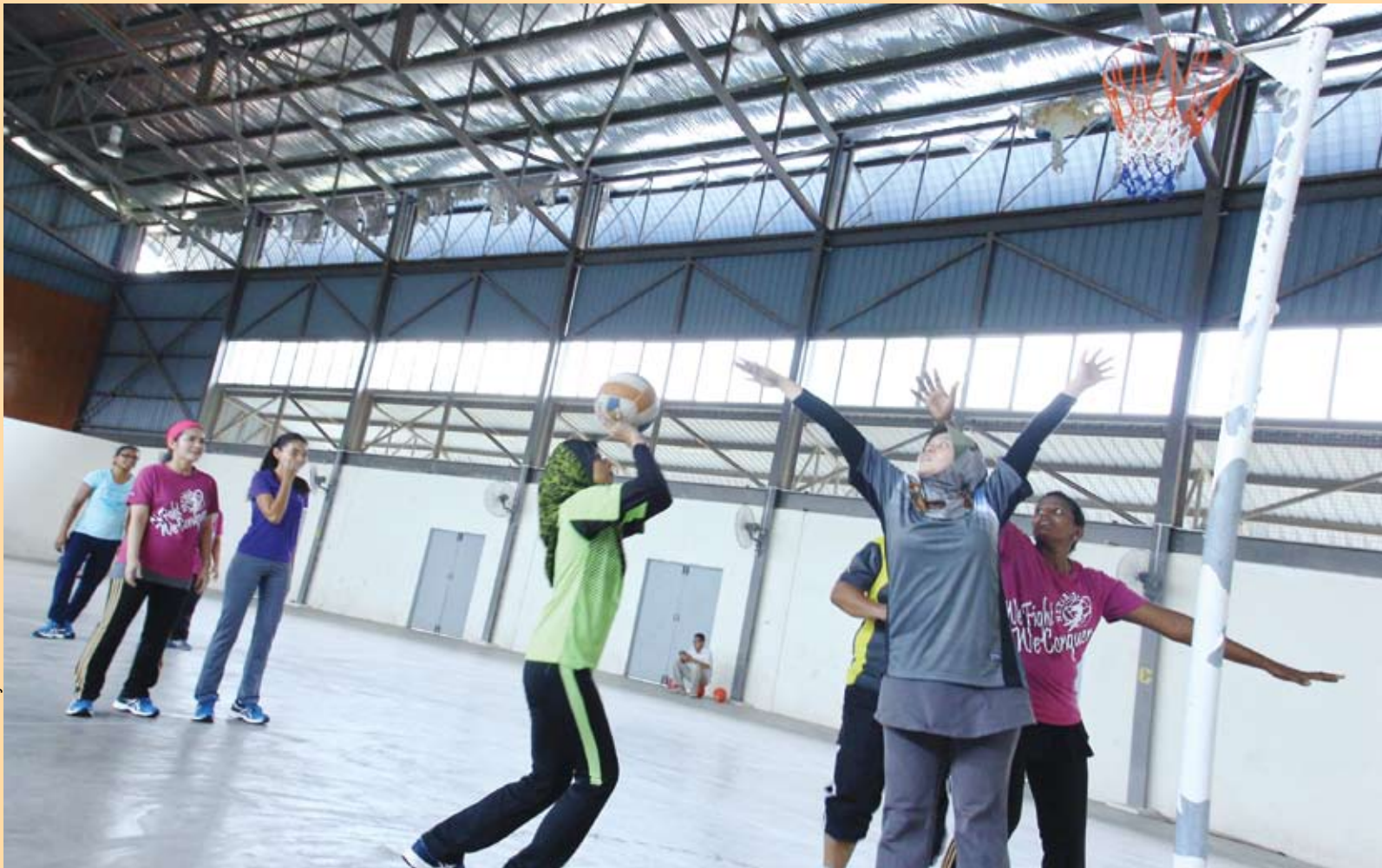
Gambar oleh Shuaib Ayob