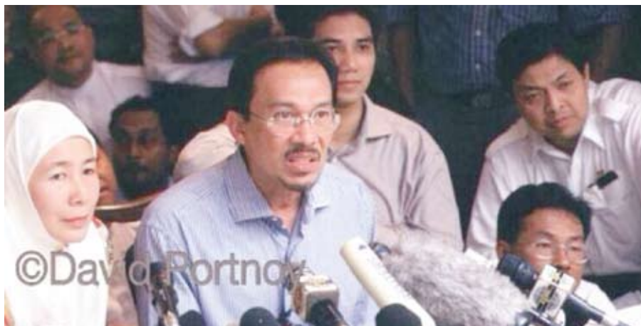
Imbas kembali pemecatan Anwar 2 September 1998

Selain pelbagai komen kecaman, facebook Najib turut dibanjiri dengan #najibletakjawatan dan #bencinajib oleh pengguna laman sosial itu.