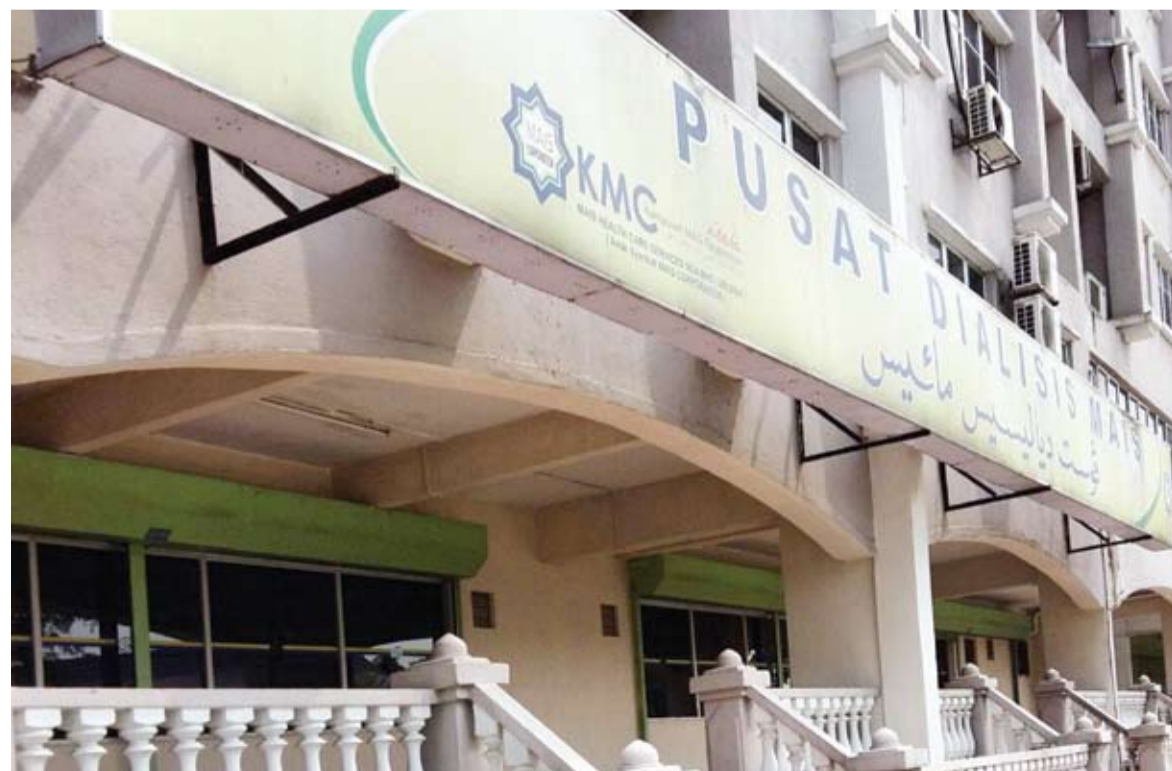
Pusat Dialisis MAIS, Cawangan Shah Alam

Ketiga, yayasan juga menawarkan perkhidmatan dialisis di Selangor. Ketika ini, kita mempunyai enam pusat dialisis iaitu di Sungai Besar, Kuala Selangor, Taman Melawati, Klang, Shah Alam dan terbaharu, Bukit Jelutong. Kita mensasarkan penubuhan pusat dialisis di setiap daerah dengan belanja keseluruhan lebih kurang RM1 juta.