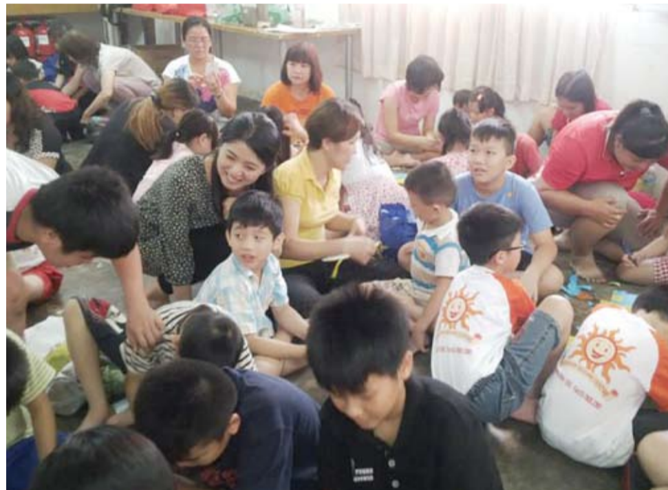
▲ Adun Damansara Utama, Yeo Bee Yin di Program Riang Ria Membaca di Kampung Chempaka anjuran bersama Kerajaan Negeri dan JKKK kampung itu. Lebih 100 kanak-kanak dan ibu bapa mengambil bahagian.