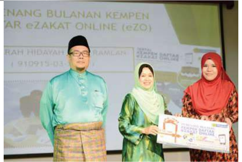
Pemenang bulanan eZO Bulan Pertama

A2 - Syarikat Usahasama yang diperbadankan di Malaysia dan equiti asing tidak melebihi 49% dan majoriti ahli Lembaga Pengarah, Pengurusan dan pekerja adalah warganegara.