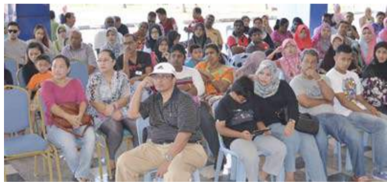
Ibu bapa pelajar menunggu ketika sesi pendaftaran UNISEL

"Memang setaraf IPTA melihat apa yang ada di sini dan saya sangat berpuas hati," katanya.