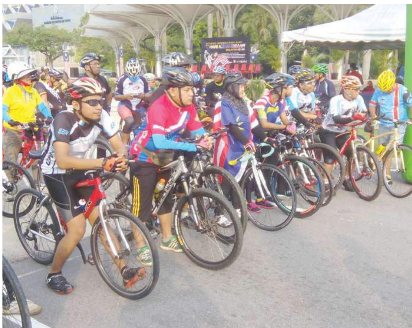
Sebahagian peserta Program Berbasikal Kayuhan Santai ketika upacara pelepasan, pada 19 Ogos lalu