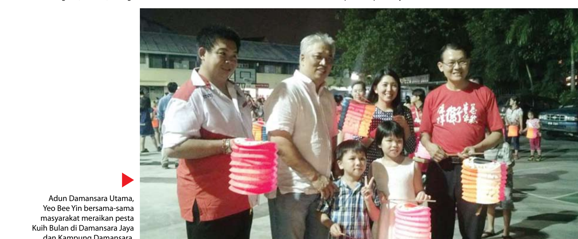
▲ Adun Damansara Utama, Yeo Bee Yin bersama-sama masyarakat meraikan pesta Kuih Bulan di Damansara Jaya dan Kampung Damansara.