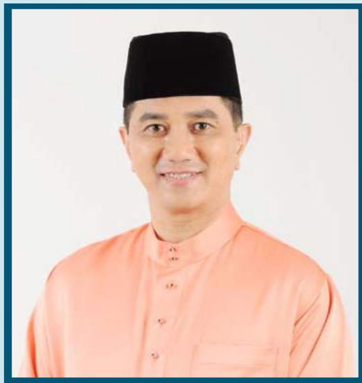
YANG AMAT BERHORMAT MOHAMED AZMIN BIN ALI DATO' MENTERI BESAR SELANGOR

ATAS ULANGTAHUN PERTAMA PENTADBIRAN NEGERI SELANGOR DARUL EHSAN