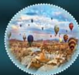
KEMBARA TURKI FROM RM2480