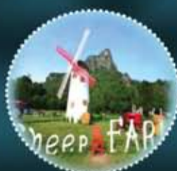
HUA HIN+BANGKOK RM1350