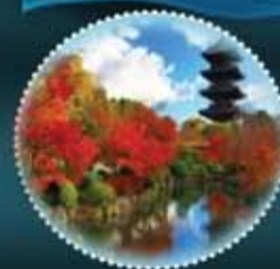
KYOTO FROM RM4498