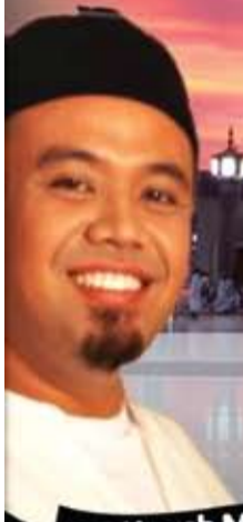
Duta Umrah Marli Travel